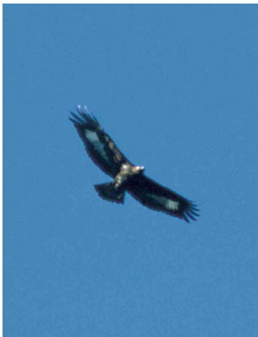
94 Golden Eagle / Steenarend Aquila chrysaetos , first-year, Norg, Drenthe, Netherlands, 16 February 2002

Black Vulture Aegypius monachus for Cyprus since 1982 was an immature at Kensington Cliffs from 8 January (the bird was already reported on 7 December) to at least February. In Sicily, Italy, four Short-toed Eagles Circaetus gallicus remained through January-February. On 11 January, one was at Port-la-nouvelle, Aude, France. The sixth or seventh Bateleur Terathopius ecaudatus for Israel was a first-year at Bet-Guvrin from 6 to at least 14 February. A Shikra Accipiter badius was present at Mushrif National Park, Dubai, UAE, from 29 January to 13 February. In the Camargue, Bouches-du-Rhône, France, allegedly up to three Long-legged Buzzard Buteo rufinus were present on 3-15 January including the adult at Mas Neuf from 3 November into February. A Lesser Spotted Eagle Aquila pomarina was reported at Grand Birieu, Dombes, Ain, France, on 20 January. The one wintering in the Camargue from 15 December onwards was still claimed in mid-January. In Spain, a first-winter Greater Spotted Eagle A clanga was seen at Aiguamolls de l'Empordà, Girona, on 8 January and an adult at La Rocina, Coto Doñana, on 10 January. In France, apart from up to three in the Camargue, singles were seen at Dombes, Ain, on 19 February and at Saint-Martin-de-Seignanx, Landes, during January-February. In Hungary, a third-year was at Ferençmajor fish-ponds on 4 January and an adult at the same site from 13 January onwards; another was at the Hortobágy from 6 January