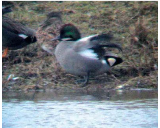
99 Zwarte Ibis / Glossy Ibis Plegadis falcinellus , adult, Petten, Noord-Holland, 27 januari 2002 ( Harm Niesen ) 100 Witstuitbarmsijs / Arctic Redpoll Carduelis hornemanni , Zuid-Eierland, Texel, Noord-Holland, 10 januari 2002 ( Arnoud B van den Berg ) 101 Witoogeed / Ferruginous Duck Aythya nyroca , Rotterdam, Zuid-Holland, 26 januari 2002 ( Chris van Rijswijk ) 102 Bronskopeend / Falcated Duck Mareca falcata , mannetje, Asselt, Limburg, 10 februari 2002 ( Max Berlijn )

gen (op 9 februari twee), en op 6 februari in Hellevoetsluis, Zuid-Holland. In totaal werden 15 Grote Burgemeesters L hyperboreus doorgegeven, met in Den Helder in januari twee adulte en in IJmuiden tussen 12 januari en 24 februari drie verschillende. In totaal werden 20 Kleine Alken Alle alle gemeld, waarvan 12 op 2 februari langs Breskens, Zeeland.