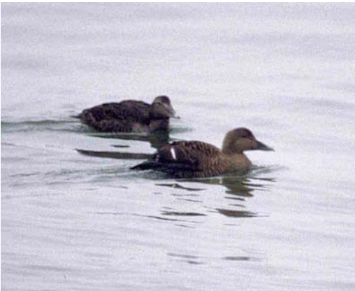
71-72 Raadseleider / mystery eider Somateria , adult vrouwkje, en Eider / Common Eider Somateria mollissima , eerste-winter, IJmuiden, Noord-Holland, 20 januari 1987

De snavelbevedering (het korte culmen en de ronde teugelbegrenzing) sluit Amerikaanse ('Atlantic') Eider S m dresseri en Hudsonbaai-eider ('Hudson Bay') S m sedentaria uit (namen tussen haakjes zijn de geografische aanduidingen in Sibley 2000). De ronde begrenzing van de teugelbevedering zou wel kunnen passen op Pacificse ('West Arctic') Eider S m v-nigra die geïsoleerd van andere ondersoorten broedt in een gebied van Noordoost-Siberië oost tot Victoria Island en Kent Peninsula in Mackenzie Territory in Noordwest-Canada en overwintert in de Beringzee (Ogilvie & Young 1998). De precieze vorm van het culmen is op de foto's moeilijk te zien maar lijkt kort genoeg om zowel op Pacificse als op Noordelijke ('East Arctic') Eider S m borealis te kunnen passen (Noordelijke broedt in het arctische deel van het Atlantische gebied). Van een Noordelijke zou men echter een iets minder ronde teugelbegrenzing dan de IJmuidense vogel verwachten. Faeröereider S m faeroeensis verschilt weinig van Europese nominaat en wordt vaak als synoniem beschouwd (cf British Ornithologists' Union 1992). Tenslotte