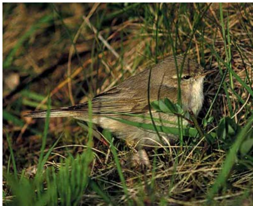
83 Willow Warbler / Fitis Phylloscopus trochilus , Lauwersoog, Groningen, Netherlands, 4 May 1999

bler. Indeed, the whitish underparts lacking any patterning like bars or stripes and the greenish upperparts strongly point in this direction. Of all other warblers in the Western Palearctic, only Icterine Hippolais icterina and Melodious Warbler H polyglotta share these characters. Both species, however, show less clear whitish underparts and have dark greyish (in Icterine) or dark brownish to greyish (in Melodious) legs and feet. Moreover, Icterine and Melodious both show much stronger legs and feet compared with most Phylloscopus warblers. Unfortunately, our mystery bird is facing away, making the use of important identification characters such as supercilium, eye-stripe and bill structure, impossible. However, leg colour, wing colour, wing structure and the colour of the upper- and underparts are clearly visible, making a safe identification possible.