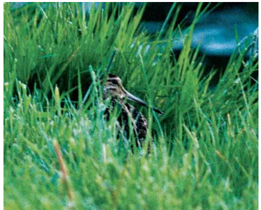
217 Witstaartkievit / White-tailed Lapwing Vanellus leucurus , Nieuwendijk, Hoekse Waard, Zuid-Holland, 4 juli 2002 218 Vorkstaartplevier / Collared Pratincole Glareola pratincola , Bandpolder, Friesland, mei 2002 219 Poelsnip / Great Snipe Gallinago media , Maassluis, Zuid-Holland, 16 mei 2002 220 Poelsnip / Great Snipe Gallinago media , Maassluis, Zuid-Holland, 16 mei 2002

is een Amerikaanse Goudplevier Pluvialis dominica in zomerkleed die op 4 en 5 juli verbleef in de Vlietpolder bij Wissenkerke, Zeeland. Op 19 juni werd een Witstaartkievit Vanellus leucurus waargenomen bij Gouderak, Zuid-Holland; waarschijnlijk dezelfde vogel pleisterde op 4 juli bij Nieuwendijk, Zuid-Holland, en op 5 juli kortstondig in het Stinkgat op Tholen, Zeeland. Sinds 1998 is deze soort elk jaar gezien in Nederland. Gestreepte Strandlopers Calidris melanotos verbleven op 16 mei in de Prunjepolder, op 18 mei in de Ezumakeeg, op 19 en 20 mei bij Beusichem, op 28 mei bij Heerhugowaard, Noord-Holland en op 29 en 30 juni alweer in de Ezumakeeg. Breedbekstrandlopers Limicola falcinellus waren zoals gewoonlijk erg schaars met exemplaren op 20 mei in de Lettelerpetten, op 26 en 27 mei bij Termunten, Groningen, en op 31 mei en 1 juni in de Ezumakeeg. Goede vondsten waren de