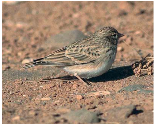
190 Lesser Short-toed Lark / Kleine Kortteenleeuwerik Calandrella rufescens rufescens , Fuerteventura, Canary Islands, 10 August 2000 ( Peter van Rij ). Note dark breast-streaks extending to centre of breast, long primary projection and short thick bill

ceous. The repeated downward tail flicking of Eastern Olivaceous is also a good clue to distinguish this species from Marsh, Blyth's Reed, European Reed and probably also from the sometimes strikingly similar Caspian Reed Warbler (plate 188). An excellent paper on the identification of Western Olivaceous, Eastern Olivaceous, Booted and Sykes's Warbler by Lars Svensson can be found in Birding World 14: 192-219, 2001.