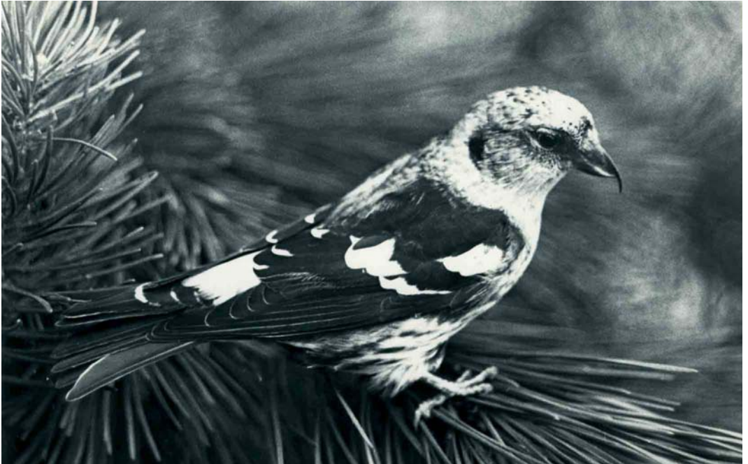
180 White-winged Crossbill / Witvleugelkruisbek Loxia leucoptera leucoptera , in captivity, De Zilk, Noordwijkerhout, Zuid-Holland, 7 October 1963