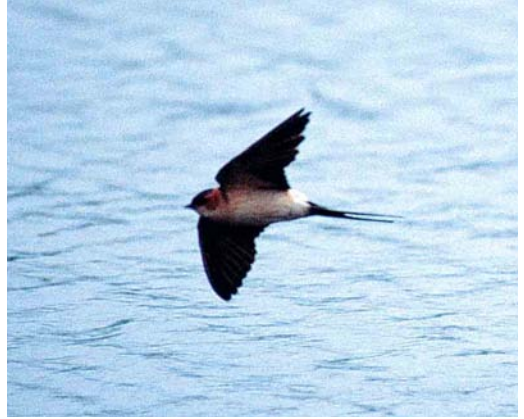
227 Roodstuitzwaluw / Red-rumped Swallow Hirundo daurica , Grand-Leez, Namur, 4 mei 2002

over Genk, Limburg, op 1 mei; over Gent (één) en Wuustwezel, Antwerpen (twee), op 7 mei; over Brecht, Antwerpen, op 8 mei; over Frasnes-lez-Buissenal, Hainaut, op 14 mei; over Escannafles, Hainaut, op 15 mei; over Krulbeke, Oost-Vlaanderen, op 19 mei; twee over Harchies op 20 mei; en over Waasmunster, Oost-Vlaanderen, op 30 mei. In totaal werden 41 Ooievaars Ciconia gezien. Op 25 mei dook de Europese Flamingo Phoenicopterus roseus weer op te Kallo-Melsele.