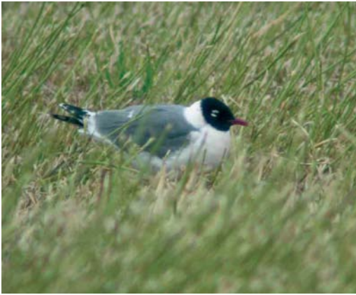
231 Franklins Meeuw / Franklin's Gull Larus pipixcan , Wissenkerke, Zeeland, 5 juli 2002