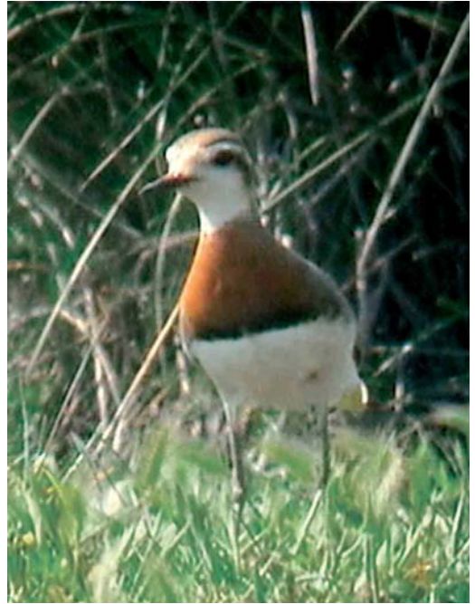
196 Cattle Egret / Koereiger Bubulcus ibis , Ahvenanmaa, Finland, 17 May 2002 ( Henry Lehto ) 197 Caspian Plover / Kaspische Plevier Charadrius asiaticus , male, Kalloni salt pans, Lesvos, Greece, May 2002 ( Steve Blain ) 198 Lesser Sand Plover / Mongoolse Plevier Charadrius mongolus (left), with Common Ringed Plover / Bontbekplevier C. hiaticula , Rimac, Lincolnshire, England, May 2002 ( Iain H Leach ) cf Dutch Birding 24: 176-177, 2002