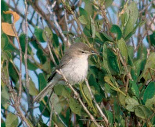
189 Sykes's Warbler / Sykes' Spotvogel Acrocephalus rama , Khor Livva, Oman, 9 March 2001. Sykes's Warbler is very similar to Eastern Olivaceous Warbler A pallidus . Note rather long bill and head pattern with rather long supercilium without obvious dark upper edge