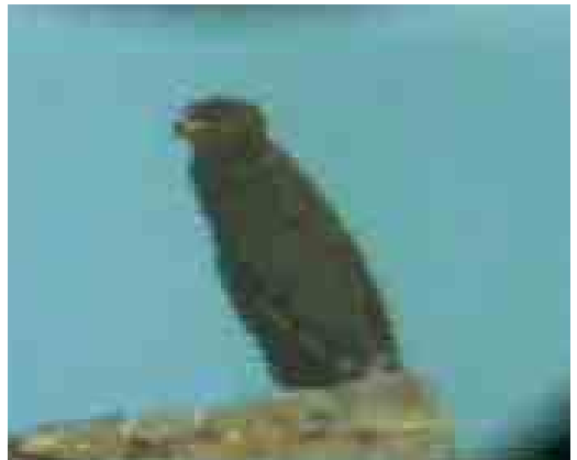
178 Lesser Spotted Eagle / Schreeuwarend Aquila pomarina , Vendicari NR, Sicily, Italy, 31 December 2000 (Andrea Corso & Carlo Nardini)

The very similar Greater Spotted Eagle A clanga could be excluded by the following characters (cf Forsman 1999, Clark 1999; Andrea Corso pers obs). The iris was yellowish with an easily discernible pupil; in Greater Spotted, it is always darker, ie, dark brown-amber or blackish-grey (Andrea Corso pers obs). The bill was small and not very high (very kite Milvus -like); in Greater Spotted, it is usually higher, bigger and heavier looking. The upper- and underwing showed an obvious contrast between the paler brownish coverts and the much darker blackish remiges; in Greater Spotted, the upperwing appears uniform (or even shows the reverse pattern, more or less the same contrast can be found in the palest Lesser Spotted Eagle). The pale spots on the upperwing were small and inconspicuous; in juvenile Greater Spotted, these spots are normally much more dense, obvious and extended. The bird showed a well-visible and conspicuous golden nape patch; this is absent in most Greater Spotted or, if visible, not so conspicuous and wide (normally it is also situated more at the rear-crown than on the nape). The base to the