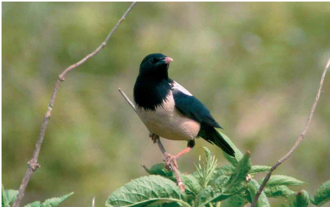
207 Rose-coloured Starling / Roze Spreeuw Sturnus roseus , Texel, Noord-Holland, Netherlands, 3 June 2002