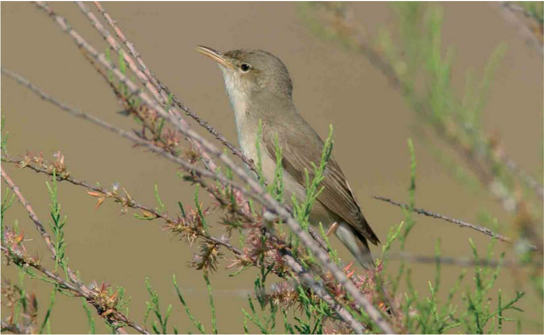
187 Eastern Olivaceous Warbler / Oostelijke Vale Spotvogel Acrocephalus pallidus , Lesvos, Greece, 7 May 2002. Note long straight bill with down-curved tip and all-pale lower mandible, pale secondary tips forming pale secondary bar and hint of pale secondary panel 188 Caspian Reed Warbler / Kaspische Karekiet Acrocephalus fuscus , Jubail, Saudi Arabia, 16 April 1991. Caspian Reed can look strikingly similar to Eastern Olivaceous Warbler A pallidus . Note lack of pale secondary panel, long primary projection and absence of prominent pale tips on secondaries