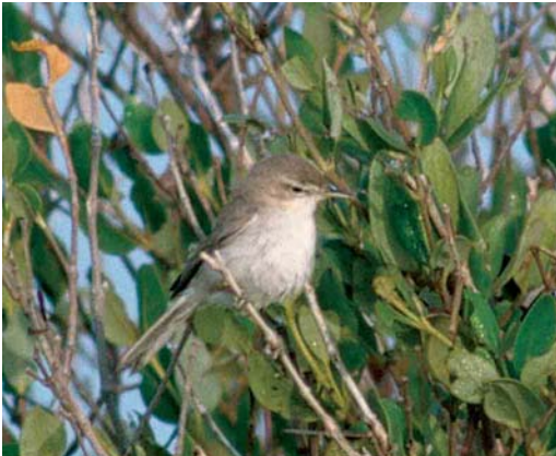
189 Sykes's Warbler / Sykes' Spotvogel Acrocephalus rama , Khor Livva, Oman, 9 March 2001. Sykes's Warbler is very similar to Eastern Olivaceous Warbler A pallidus . Note rather long bill and head pattern with rather long supercilium without obvious dark upper edge