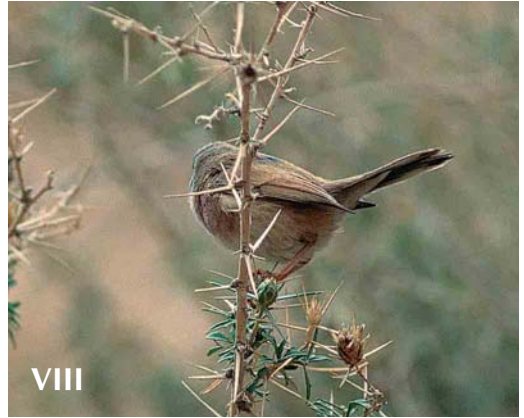
Mystery photograph VIII (April)

Entries for the second round have to arrive by 10 September 2002 . From those entrants having identified both mystery birds correctly, two persons will be drawn who will receive a copy of the video Dutch Birding video-jaaroverzicht 2001 ,