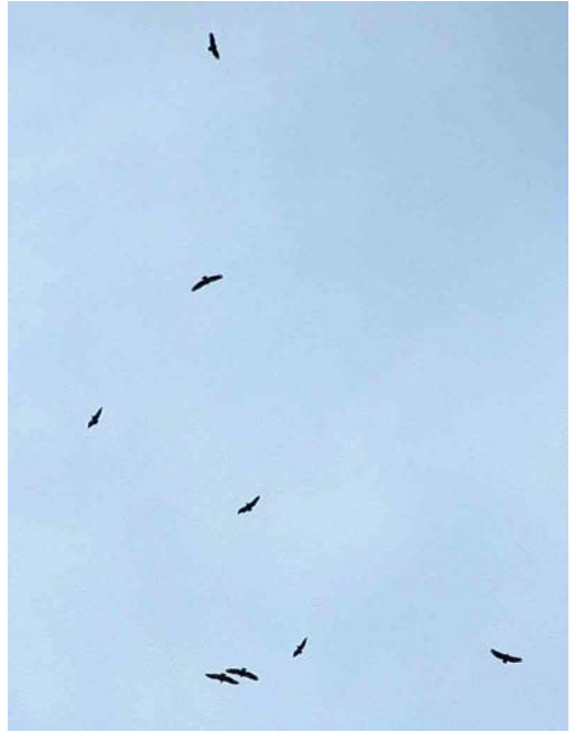
208 Lammergier / Lammergeier Gypaetus barbatus , onvolwassen, De Cocksdorp, Texel, Noord-Holland, 3 juni 2002 209 Vale Gieren / Eurasian Griffon Vultures Gyps fulvus , Groningen, Groningen, 1 juni 2002 210 Lammergier / Lammergeier Gypaetus barbatus , onvolwassen, De Cocksdorp, Texel, Noord-Holland, 3 juni 2002