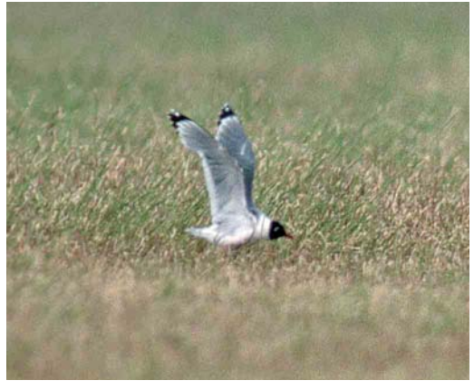
232 Franklins Meeuw / Franklin's Gull Larus pipixcan , Wissenkerke, Zeeland, 5 juli 2002

dat ook de bovenzijde veel donkerder was dan bij de aanwezige Goudplevieren. Een haastige autokilometer verder kon de vogel als Amerikaanse Goudplevier P dominica gedetermineerd worden. Ondanks een waarneemafstand van c 150 m was te zien dat de handpennen c 2 cm voorbij de staart reikten terwijl de tertials ten minste 3 cm van de handpennen onbedekt lieten. De vogel was in iets gesleten zomerkleed maar van rui was op enkele onderstaartdekveren na niets te zien. Hij foerageerde tijdens zijn verblijf zeer succesvol en trok in ongeveer een half uur ruim 1.5 m regenworm uit de bodem. Na het middaguur verdween de vogel maar keerde later in de avond terug naar de akker en werd tot in de schemering door enkele 10-tal vogelaars gezien.