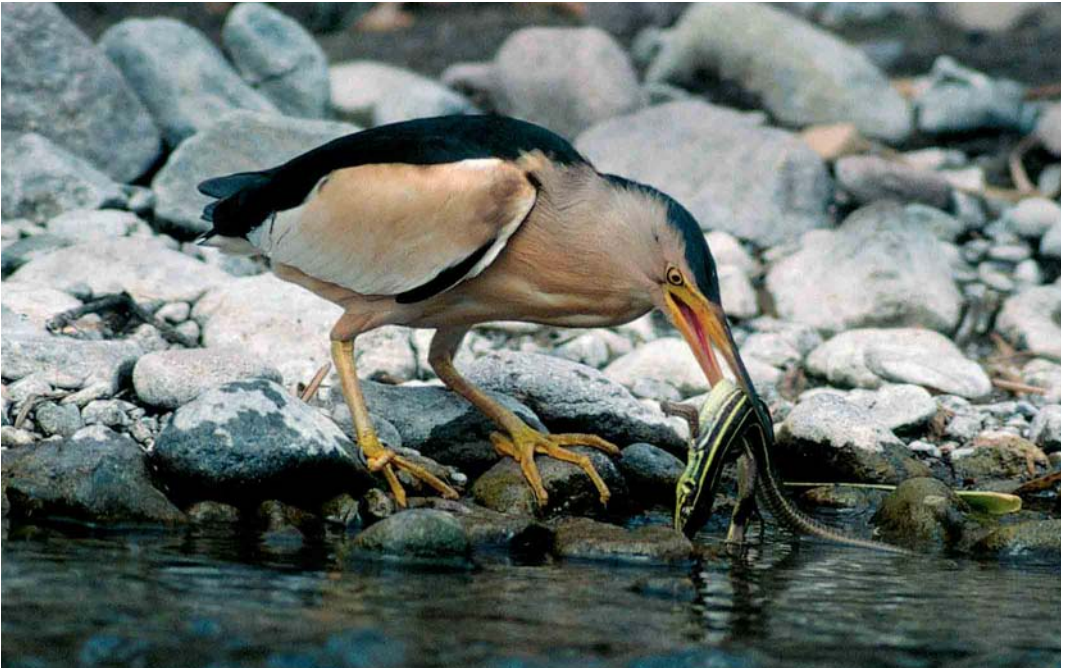
183-184 Little Bittern / Woudaap Ixobrychus minutus , with Balkan Green Lizard Lacerta trilineata , near Sigrí, Lesvos, Greece, 3 May 2000