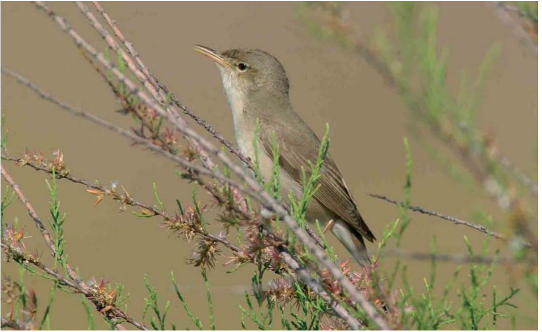
187 Eastern Olivaceous Warbler / Oostelijke Vale Spotvogel Acrocephalus pallidus , Lesvos, Greece, 7 May 2002. Note long straight bill with down-curved tip and all-pale lower mandible, pale secondary tips forming pale secondary bar and hint of pale secondary panel 188 Caspian Reed Warbler / Kaspische Karekiet Acrocephalus fuscus , Jubail, Saudi Arabia, 16 April 1991. Caspian Reed can look strikingly similar to Eastern Olivaceous Warbler A pallidus . Note lack of pale secondary panel, long primary projection and absence of prominent pale tips on secondaries