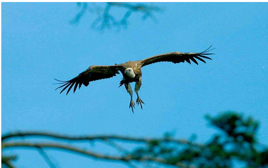
192 Eurasian Griffon Vulture / Vale Gier Gyps fulvus , Nokere, Oost-Vlaanderen, Belgium, 8 June 2002 (Ivan Steenkiste)