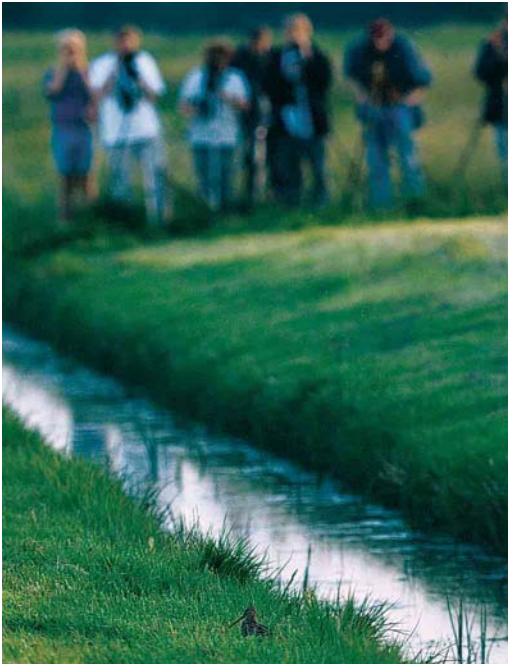
212 Poelsnip / Great Snipe Gallinago media , Maassluis, Zuid-Holland, 16 mei 2002