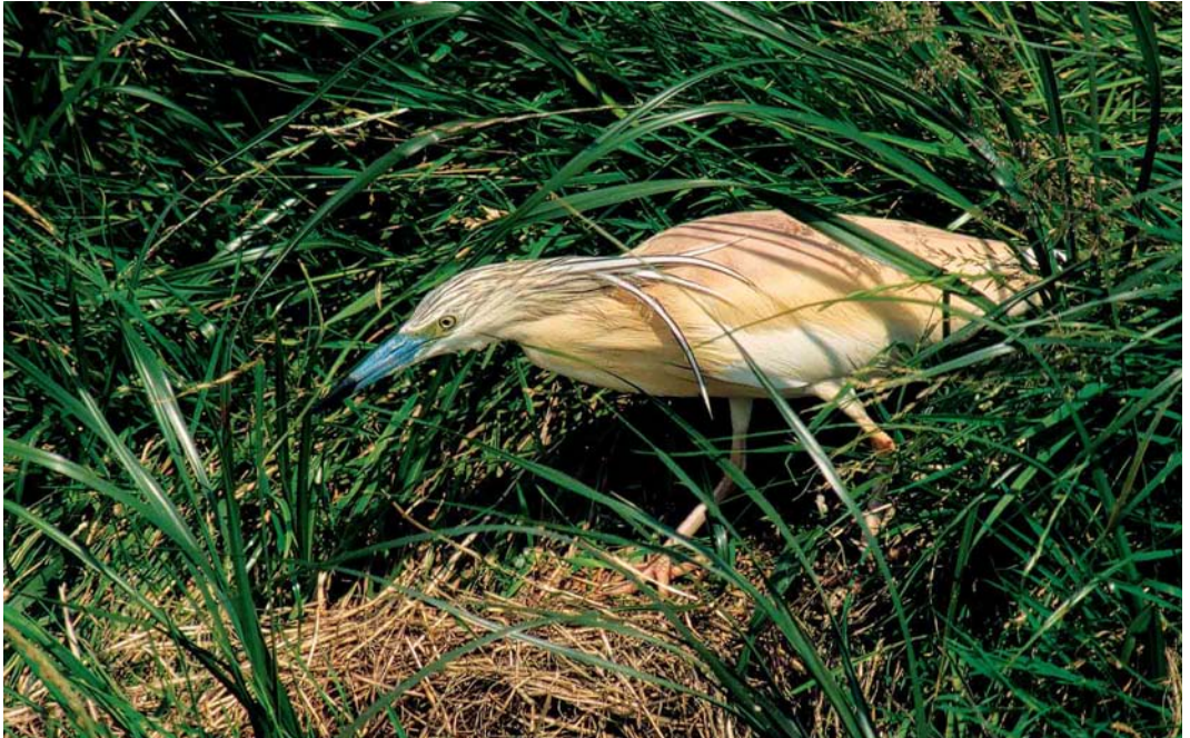
211 Ralreiger / Squacco Heron Ardeola ralloides , adult, Zuid-Schermer, Noord-Holland, 26 juni 2002