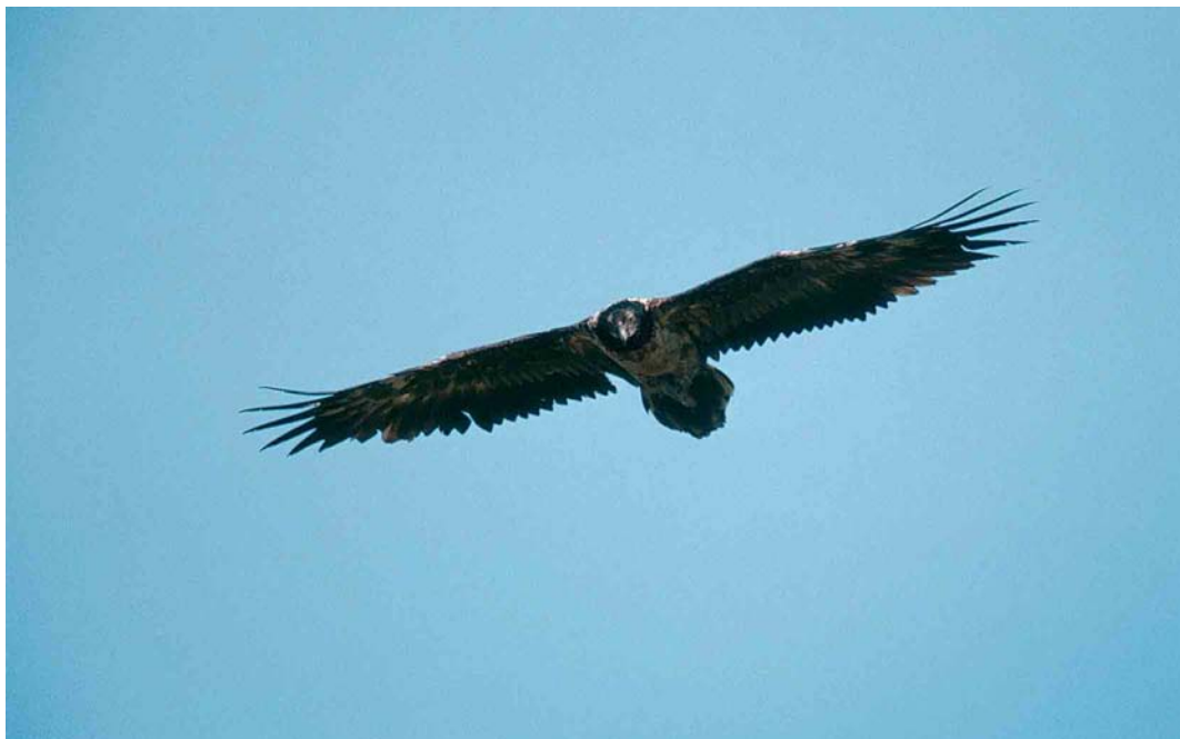
191 Lammergeier / Lammergier Gypaetus barbatus , immature, De Cocksdorp, Texel, Noord-Holland, Netherlands, 3 June 2002 (Marten van Dijk)