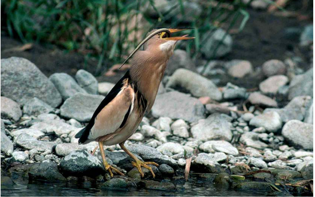
185 Little Bittern / Woudaap Ixobrychus minutus , with Balkan Green Lizard Lacerta trilineata , near Sigri, Lesvos, Greece, 3 May 2000

home, based on the slides, our initial identification turned out to be correct: an immature Balkan Green Lizard of the nominate subspecies L t trilineata . It was estimated to be about nine months old (A Troidl in litt). Assuming an average length of 50 mm for both the bill and tarsus of the Little Bittern (Voisin 1991), we could estimate the size of the lizard. The head plus body length was estimated to be 110 mm, and including the tail, the total length was estimated to be 285 mm. These measurements, and the ratio of head plus body compared with tail length, fit well within those given for its age (Böhme 1984). A head plus body length of 110 mm corresponds with an estimated weight of c 33 g (Böhme 1984).