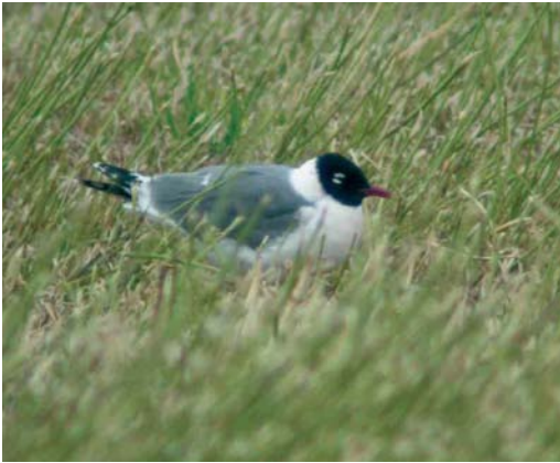
231 Franklins Meeuw / Franklin's Gull Larus pipixcan , Wissenkerke, Zeeland, 5 juli 2002