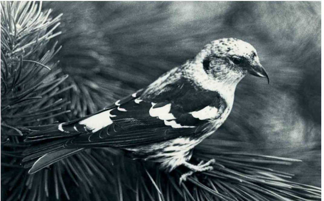
180 White-winged Crossbill / Witvleugelkruisbek Loxia leucoptera leucoptera , in captivity, De Zilk, Noordwijkerhout, Zuid-Holland, 7 October 1963