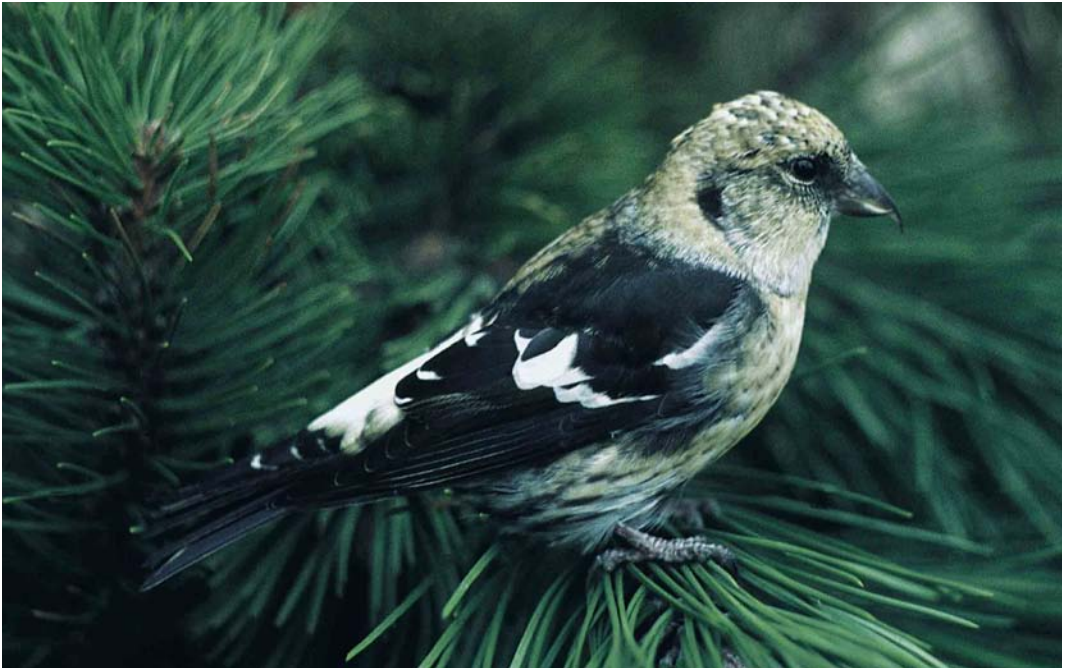
179 White-winged Crossbill / Witvleugelkruisbek Loxia leucoptera leucoptera , in captivity, De Zilk, Noordwijkerhout, Zuid-Holland, 7 October 1963