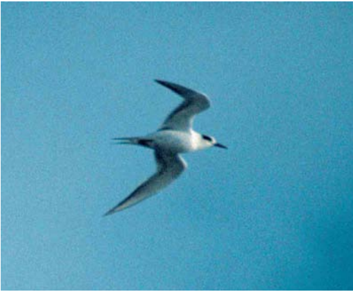
181 Forsters Stern / Forster's Tern Sterna forsteri , adult-winter, Boschplaat, Terschelling, Friesland, 14 november 1999