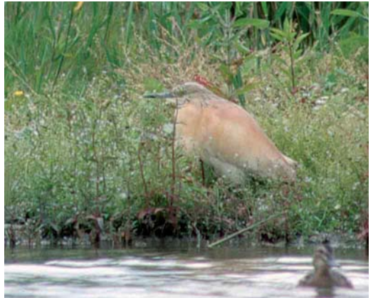
221 Orpheusspottvogel / Melodious Warbler Hippolais polyglotta , Tongerlo, Limburg, 8 juni 2002 (Marten van Dijf) 222 Kortteenleeuwerik / Greater Short-toed Lark Calandrella brachydactyla , Ackerdijk, Delft, Zuid-Holland, 23 mei 2002 (Ellen Sandberg) 223 Kleine Topper / Lesser Scaup Aythya affinis , mannetje, Hoogkerk, Groningen, Groningen, 25 mei 2002 (Eric Koops) 224 Ralreiger / Squacco Heron Ardeola ralloides , adult, Kardingse, Groningen, Groningen, 26 juni 2002 (Eric Koops)

Friesland. Grauwe Franjepoten Phalaropus lobatus werden opgemerkt op 12 en 18 mei in de Bandpolder, op 19 mei in de Ezumakeeg, op 31 mei in de Rammelwaard bij Voorst, Gelderland, en op 5 juni (drie) in De Tjamme bij Beerta, Groningen. De Rosse Franjepoot P fulicaria van Waal en Burg op Texel bleef tot 1 mei, en op 6 juni was er één aanwezig in de Workumerwaard, Friesland. Opmerkelijk was de waarneming van een Middelste Jager Stercorarius pomarinus die op 2 juni meer dan een uur op een prooi zat in de Bovenpolder bij Amerongen, Utrecht. Later vloog de vogel in noordoostelijke richting door. Een adulte Kleinste Jager S longicaudus vloog op 26 mei langs Heemskerk, Noord-Holland. De adulte Lachmeeuw Larus atricilla net over de Duitse grens in het Zwillbrocker Venn, Nordrhein-Westfalen, werd daar in ieder geval tot begin mei gezien. Alvast vermeldens-