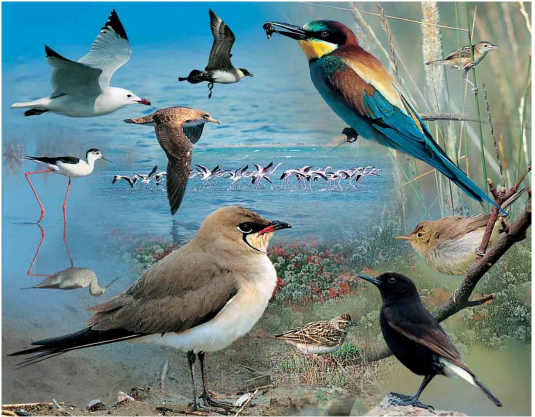
FIGURE 1 Postcard from Spain ( original design by John Scovell ). From top left, clockwise: Audouin's Gull ( Anthony McGeehan ), Cory's Shearwater ( Ricard Gutiérrez ), Pomarine Skua ( Anthony McGeehan ), Greater Flamingos ( Anthony McGeehan ), Bee-eater ( Tom Ennis ), Zitting Cisticola ( Anthony McGeehan ), Melodious Warbler ( Anthony McGeehan ), Black Wheatear ( Tom Ennis ), Short-toed Lark ( Anthony McGeehan ), Collared Pratincole ( Anthony McGeehan ), Black-winged Stilt ( Tom Ennis )

the Nile. Egrets and Black-winged Stilts danced in the shallows, Garganey slumbered among wet tussocks and swarms of martins, swallows and swifts bustled back and forth below a threatening firmament. Audouin's Gulls driven inland from wave-lashed beaches mingled with Avocets and Mediterranean Gulls. Above them Whiskered, Black and White-winged Black Terns dipped and fluttered like windborne pages of burnt newspaper. Cameo performances came thick and fast. Little Bitterns burst into flight from clumps of reeds, their black and gold upperparts flashing like a matador's cape. Then, distant rumbling. Not thunder but a faint cacophony recalling the yelp of migrating geese. The source could be picked out as strange twig-like formations suggesting coat-hangers in the sky. Line after line