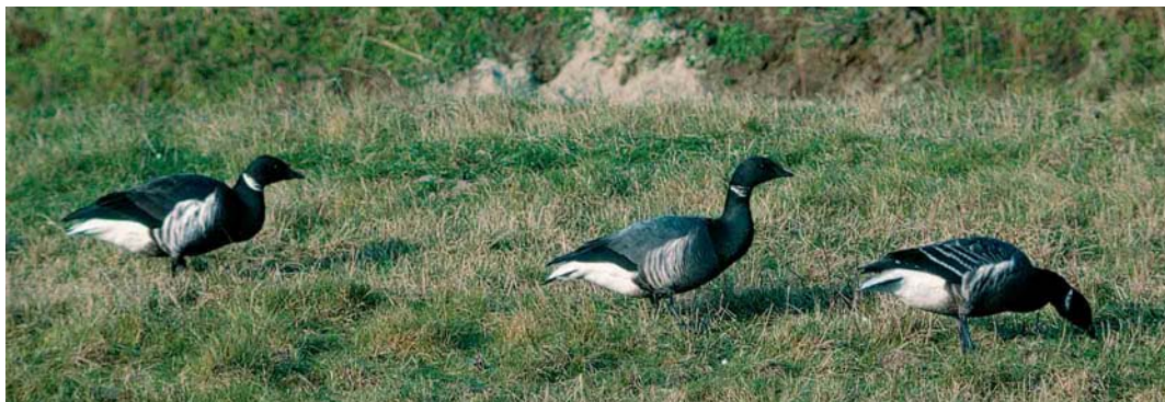
176 Zwarte Rotgans / Black Brant Branta nigricans , adult (links), Rotgans / Dark-bellied Brent Goose B bernicla , adult (midden) en hybride Rotgans x Zwarte Rotgans / hybrid Dark-bellied Brent Goose x Black Brant, eerste-winter (rechts), Grevelingendam, Zeeland, 22 januari 1992 (Arnoud B van den Berg) 177 Zwarte Rotgans / Black Brant Branta nigricans , adult (midden), Rotgans / Dark-bellied Brent Goose B bernicla , adult (links) en twee hybriden Rotgans x Zwarte Rotgans / hybriden Dark-bellied Brent Goose x Black Brant, eerste-winter, Grevelingendam, Zeeland, 22 januari 1992 (Arnoud B van den Berg)

In Engeland zijn sinds 1989 ook enkele gemengde paren met jongen vastgesteld. Van 8 januari tot 18 maart 1989 verbleef een paar met zes hybride jongen bij Thorney Deeps, West