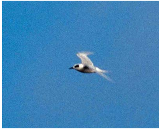
182 Forsters Stern / Forster's Tern Sterna forsteri , adult-winter, Boschplaat, Terschelling, Friesland, 14 november 1999

succesvolle actie toenam. Rond 10:00 kwamen c 25 vogelaars aan in West-Terschelling. Per taxi ging de groep naar Oosterend. Daarvandaan startte de door de venijnige oostenwind en het deels onverharde fietspad barre fietstocht van c 15 km naar de oostpunt van het eiland. De eersten arriveerden hier om c 12:00. Ondertussen was de vogel al enige tijd uit beeld... De inspanning werd echter beloond toen de stern om 13:10 tevoorschijn kwam. Gedurende c 45 min liet de vogel zich op wisselende afstand zien, langzaam afdwalend richting Ameland, Friesland. Drie vogelaars die met de snelboot van 11:30 waren overgestoken waren om c 14:00 nog net op tijd om de vogel voor de kust van Ameland te zien. Daarna is de vogel niet meer aangetroffen.