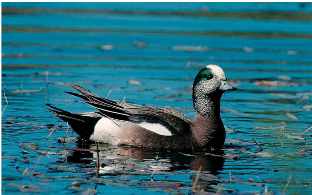
195 American Wigeon / Amerikaanse Smient Mareca americana , male, Turenki, Finland, 22 May 2002