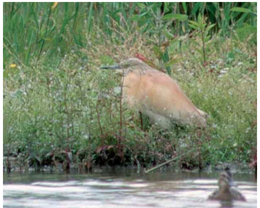
221 Orpheusspottvogel / Melodious Warbler Hippolais polyglotta , Tongerlo, Limburg, 8 juni 2002 (Marten van Dijf) 222 Kortteenleeuwerik / Greater Short-toed Lark Calandrella brachydactyla , Ackerdijk, Delft, Zuid-Holland, 23 mei 2002 (Ellen Sandberg) 223 Kleine Topper / Lesser Scaup Aythya affinis , mannetje, Hoogkerk, Groningen, Groningen, 25 mei 2002 (Eric Koops) 224 Ralreiger / Squacco Heron Ardeola ralloides , adult, Kardingse, Groningen, Groningen, 26 juni 2002 (Eric Koops)

Friesland. Grauwe Franjepoten Phalaropus lobatus werden opgemerkt op 12 en 18 mei in de Bandpolder, op 19 mei in de Ezumakeeg, op 31 mei in de Rammelwaard bij Voorst, Gelderland, en op 5 juni (drie) in De Tjammie bij Beerta, Groningen. De Rosse Franjepoot P fulicaria van Waal en Burg op Texel bleef tot 1 mei, en op 6 juni was er één aanwezig in de Workumerwaard, Friesland. Opmerkelijk was de waarneming van een Middelste Jager Stercorarius pomarinus die op 2 juni meer dan een uur op een prooi zat in de Bovenpolder bij Amerongen, Utrecht. Later vloog de vogel in noordoostelijke richting door. Een adulte Kleinste Jager S longicaudus vloog op 26 mei langs Heemskerk, Noord-Holland. De adulte Lachmeeuw Larus atricilla net over de Duitse grens in het Zwillbrocker Venn, Nordrhein-Westfalen, werd daar in ieder geval tot begin mei gezien. Alvast vermeldens-