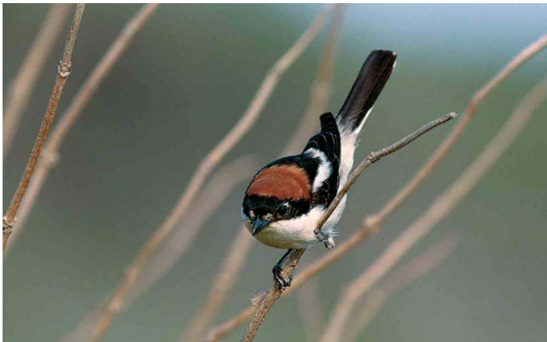
206 Woodchat Shrike / Roodkopklauwier Lanius senator , Helgoland, Schleswig-Holstein, Germany, 20 May 2002