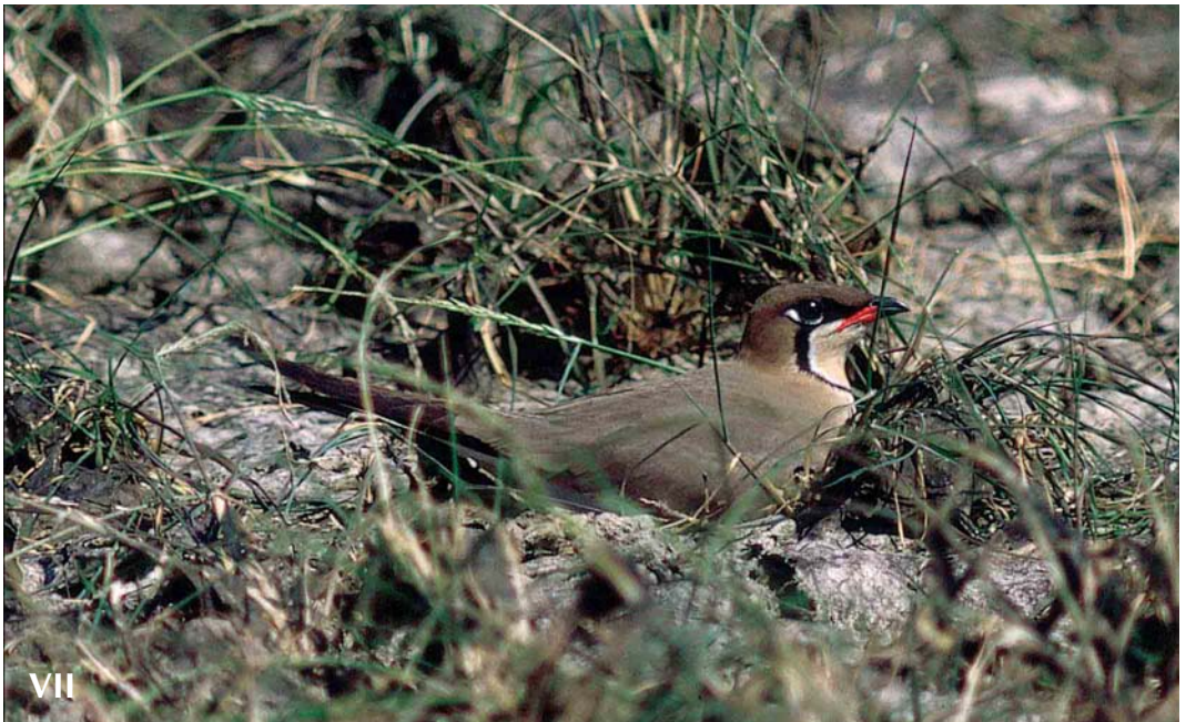
Mystery photograph VII (April)