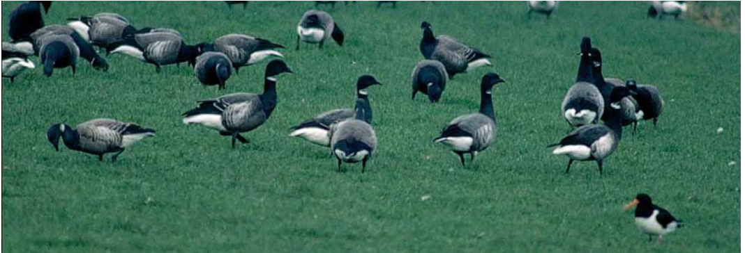
174 Zwarte Rotgans / Black Brant Branta nigricans , adult (rechts), met twee hybriden Rotgans B bernicla x Zwarte Rotgans / hybrids Dark-bellied Brent Goose x Black Brant, eerste-winter (midden en net links van midden), en Rotganzen / Dark-bellied Brent Geese, Terschelling, Friesland, april 2000 (Theo Bakker/Cursorius) 175 Zwarte Rotgans / Black Brant Branta nigricans , adult (links van midden), met twee hybriden Rotgans B bernicla x Zwarte Rotgans / hybrids Dark-bellied Brent Goose x Black Brant, eerste-winter (rechts van midden), en Rotganzen / Dark-bellied Brent Geese, Terschelling, Friesland, april 2000 (Theo Bakker/Cursorius)

In het voorjaar van 2000 bevond zich een recordaantal van minimaal vijf Zwarte Rotganzen op Terschelling (Dutch Birding 22: 122, 2000). Op 8 april 2000 stelde Theo Bakker vast dat één van deze vogels gepaard was met een Rotgans B bernicla en vergezeld werd door twee hybride jongen in eerste-winterkleed; deze vogels werden gezien tot 2 mei. Op plaat 174-175 is de adulte Zwarte Rotgans gemakkelijk te herkennen aan de donkere bovendelen, donker bruinzwarte borst bijna zonder contrast met de zwarte hals, opvallende witte, driehoekige flankvlek met zwarte schubtekening, en uitgebreide witte halsvlek. De twee hybride jongen vertonen kenmerken die intermediair zijn tussen beide ouders. De borst is iets minder donker dan bij de Zwarte Rotgans en vertoont daardoor iets meer contrast met de zwarte hals. Dit contrast is bij de meeste op de