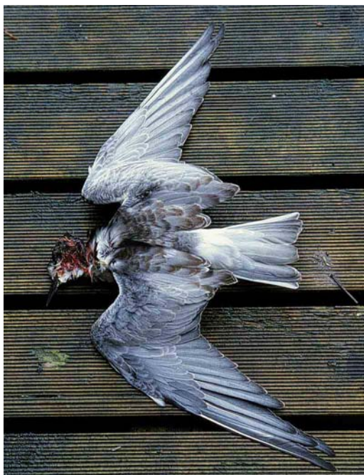
70 Witvleugelstern / White-winged Tern Chlidonias leucopterus , juveniel mannetje, ruiend naar eerste winterkleed (verzameld bij Den Oever, Noord-Holland, 27 december 2000), Arnhem, 13 januari 2001 (Harvey van Diek)

WHITE-WINGED TERN AT DEN OEVER IN DECEMBER 2000 KILLED BY COMMON MAGPIE In November-December 2000, up to three White-winged Terns Chlidonias leucopterus were wintering together with some Black Terns C niger at Den Oever, Noord-Holland, the Netherlands; the late stay of White-winged Terns (the last reported sighting was on 1 January 2001) is exceptional for the Netherlands. On 27 December 2000, one of the starving/weakened White-winged Terns was observed being killed by a Common Magpie Pica pica . The tern was collected and identified as a juvenile male moulting to first-winter plumage (now at Zoological Museum of Amsterdam, ZMA). Although Common Magpies are known to eat and/or kill many bird species, especially smaller passerines, predation of a White-winged Tern has probably not been documented before.