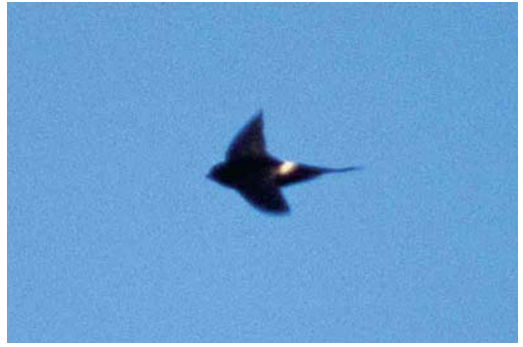
77 White-rumped Swift / Kaffergierzwaluw Apus caffer , eastern Algarve, Portugal, 14 July 1999

remaining inside and lining the entrance with feathers to hinder entry (del Hoyo et al 1999, Chantler & Driessens 2000). Mark Bolton and others visited the site on 21 August and caught sight of a well-grown chick and heard vocalizations from inside the nest whenever an adult approached and briefly visited the nest. KS and KP again visited the site on 7 September and found that the body of the nest had been punctured from below in two places but the entrance was not damaged. A nearby Red-rumped Swallow's nest had suffered similar damage. The presence of two fresh sardine cans, a wine bottle and a cut stem of Giant Reed Arundo donax that had not been there on 16 July strongly suggested vandalism.