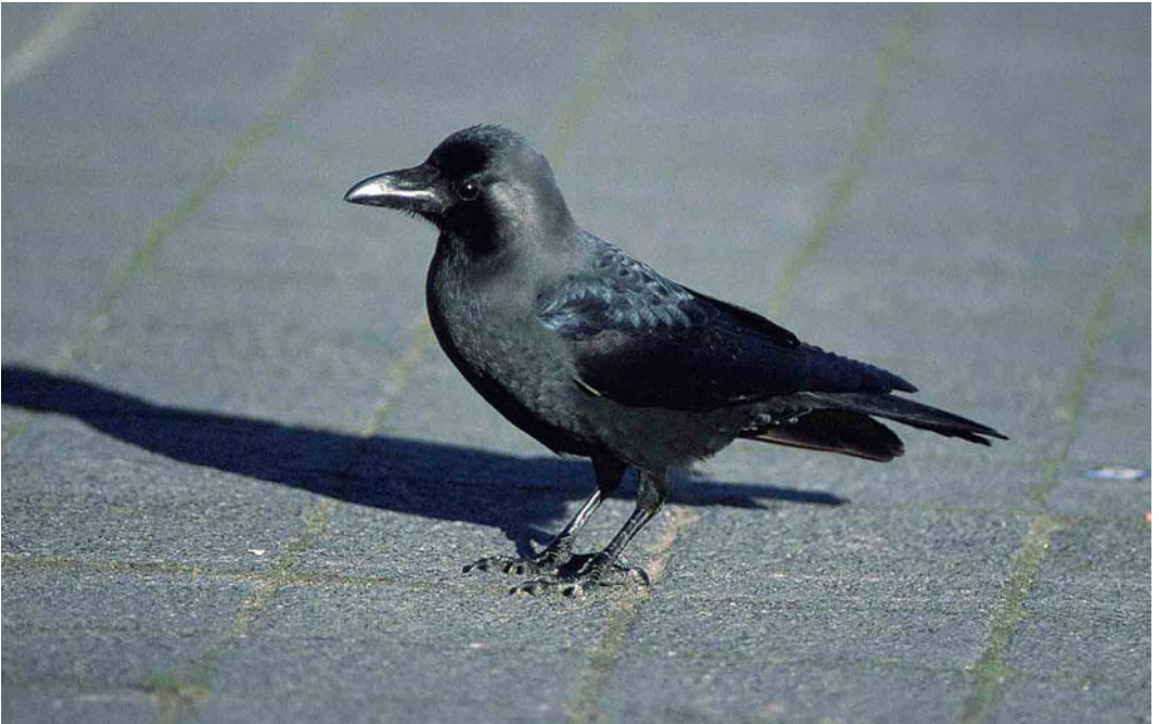
108 Huiskraai / House Crow Corvus splendens , Hoek van Holland, Zuid-Holland, 14 februari 2002 (Chris van Rijswijk)