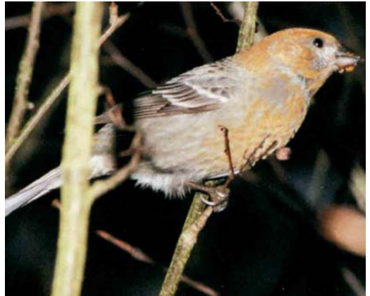
78 Pine Grosbeak / Haakbek Pinicola enucleator , adult male, Melissant, Zuid-Holland, Netherlands, 24 March 1996 79 Pine Grosbeak / Haakbek Pinicola enucleator , Tampere, Finland, February 1984 80-81 Pine Grosbeak / Haakbek Pinicola enucleator , first-year male, Nymölla, Skåne, Sweden, December 2000

bird) but, after reconsideration by the CDNA, the bird was still regarded as an escape (see editorial comment in Schaftenaar 1999).