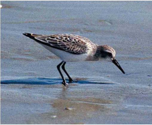
82 Western Sandpiper / Alaskastrandloper Calidris mauri , Vancouver Island, British Columbia, Canada, 14 August 1994 (Marcel Scholte)