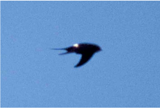
76 White-rumped Swift / Kaffergierzwaluw Apus caffer , eastern Algarve, Portugal, 7 July 2000