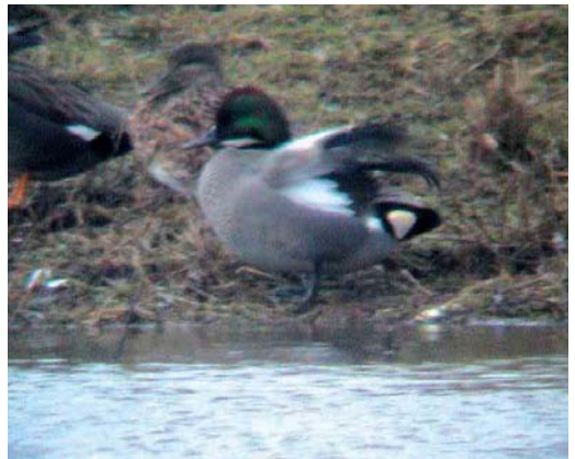
99 Zwarte Ibis / Glossy Ibis Plegadis falcinellus , adult, Petten, Noord-Holland, 27 januari 2002 100 Witstuitbarmsijs / Arctic Redpoll Carduelis hornemanni , Zuid-Eierland, Texel, Noord-Holland, 10 januari 2002 101 Witoogeed / Ferruginous Duck Aythya nyroca , Rotterdam, Zuid-Holland, 26 januari 2002 102 Bronskopeend / Falcated Duck Mareca falcata , mannetje, Asselt, Limburg, 10 februari 2002

gen (op 9 februari twee), en op 6 februari in Hellevoetsluis, Zuid-Holland. In totaal werden 15 Grote Burgemeesters L hyperboreus doorgegeven, met in Den Helder in januari twee adulte en in IJmuiden tussen 12 januari en 24 februari drie verschillende. In totaal werden 20 Kleine Alken Alle alle gemeld, waarvan 12 op 2 februari langs Breskens, Zeeland.