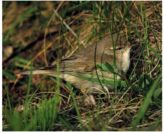
83 Willow Warbler / Fitis Phylloscopus trochilus , Lauwersoog, Groningen, Netherlands, 4 May 1999

bler. Indeed, the whitish underparts lacking any patterning like bars or stripes and the greenish upperparts strongly point in this direction. Of all other warblers in the Western Palearctic, only Icterine Hippolais icterina and Melodious Warbler H polyglotta share these characters. Both species, however, show less clear whitish underparts and have dark greyish (in Icterine) or dark brownish to greyish (in Melodious) legs and feet. Moreover, Icterine and Melodious both show much stronger legs and feet compared with most Phylloscopus warblers. Unfortunately, our mystery bird is facing away, making the use of important identification characters such as supercilium, eye-stripe and bill structure, impossible. However, leg colour, wing colour, wing structure and the colour of the upper- and underparts are clearly visible, making a safe identification possible.