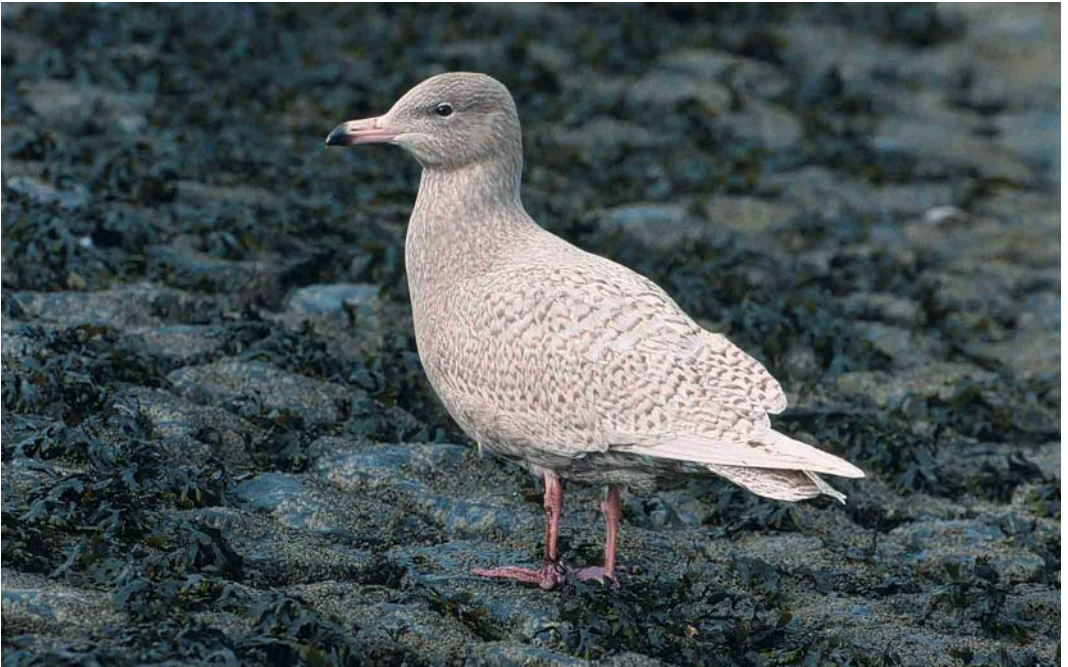
104 Grote Burgemeester / Glaucous Gull Larus hyperboreus , eerste-winter, Scheveningen, Zuid-Holland, 18 februari 2002 (Henk Harmsen)