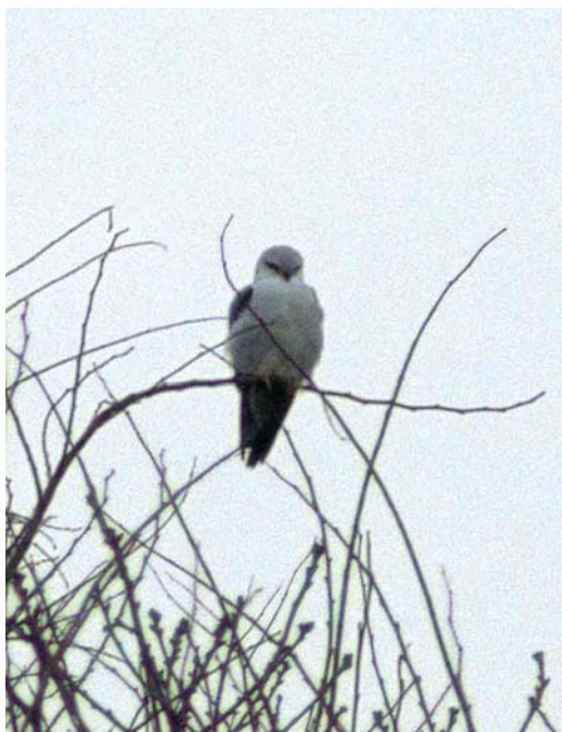
64 Grijze Wouw / Black-winged Kite Elanus caeruleus , Eierlandse Duinen, Texel, Noord-Holland, 29 maart 1998 (Arnoud B van den Berg)

middaguur werd hij uit het oog verloren; waarschijnlijk was hij langzaam in zuidelijke richting afgezakt. In totaal hebben ruim 200 vogelaars de Grijze Wouw kunnen bekijken. De ontdekking van de vogel gebeurde in een periode met zuidenwind en opvallend milde temperaturen en viel samen met de eerste waarneming van deze soort voor Denemarken bij Skagen, Nordjylland, op exact dezelfde datum (Witte 1998).