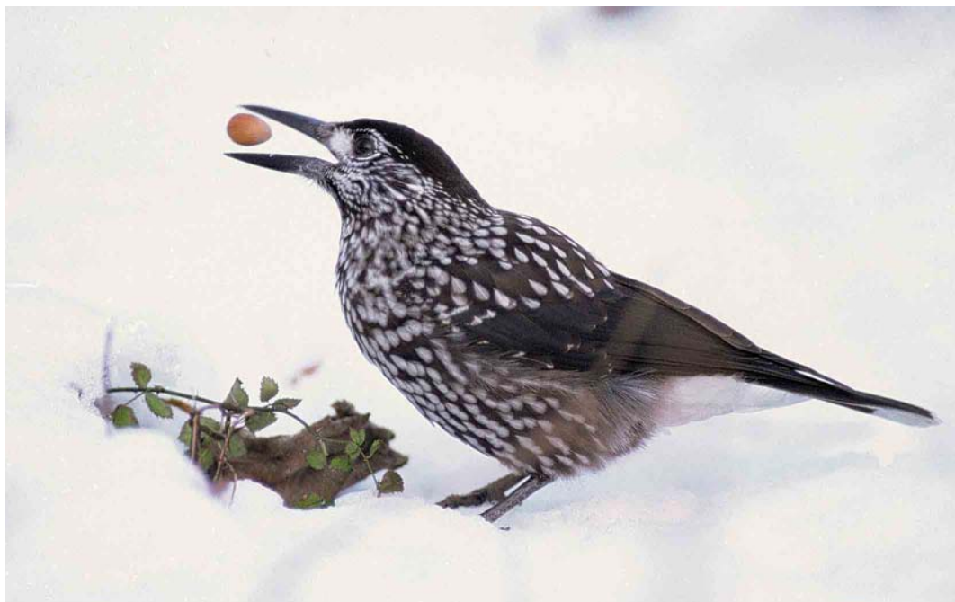
106 Notenkraker / Spotted Nutcracker Nucifraga caryocatactes , Zeewolde, Flevoland, 5 januari 2002