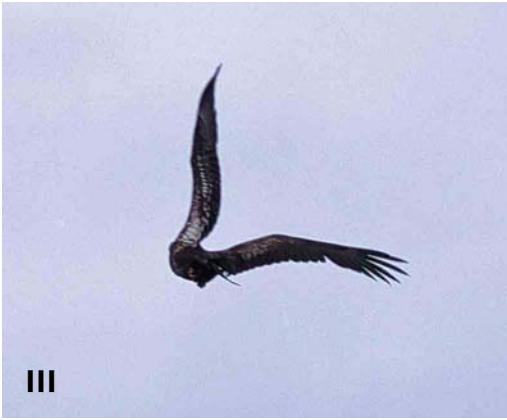
Mystery photograph III (June)