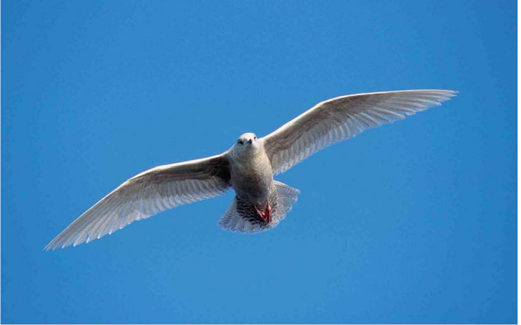
103 Kleine Burgemeester / Iceland Gull Larus glaucooides , eerste-winter, Scheveningen, Zuid-Holland, 17 februari 2002