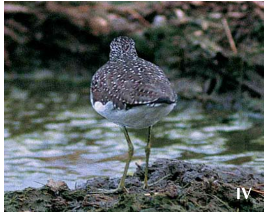
Mystery photograph IV (May)

the tibia feathering is pale yellowish. In both species of bonelli's, the tibia feathering is more whitish. In addition, wing-coverts and remiges, especially the secondaries, are edged bright greenish in both bonelli's warblers. In the mystery bird, the wing-coverts are uniform greyish-green and the edges of the remiges are pale yellowish and not so brightly coloured. So, we are left with Willow Warbler. The greenish-tinged upperparts, diffusely pale-edged tertials, yellowish-edged flight-feathers and the long primary projection, roughly equivalent to the visible tertial length, all fit only Willow.