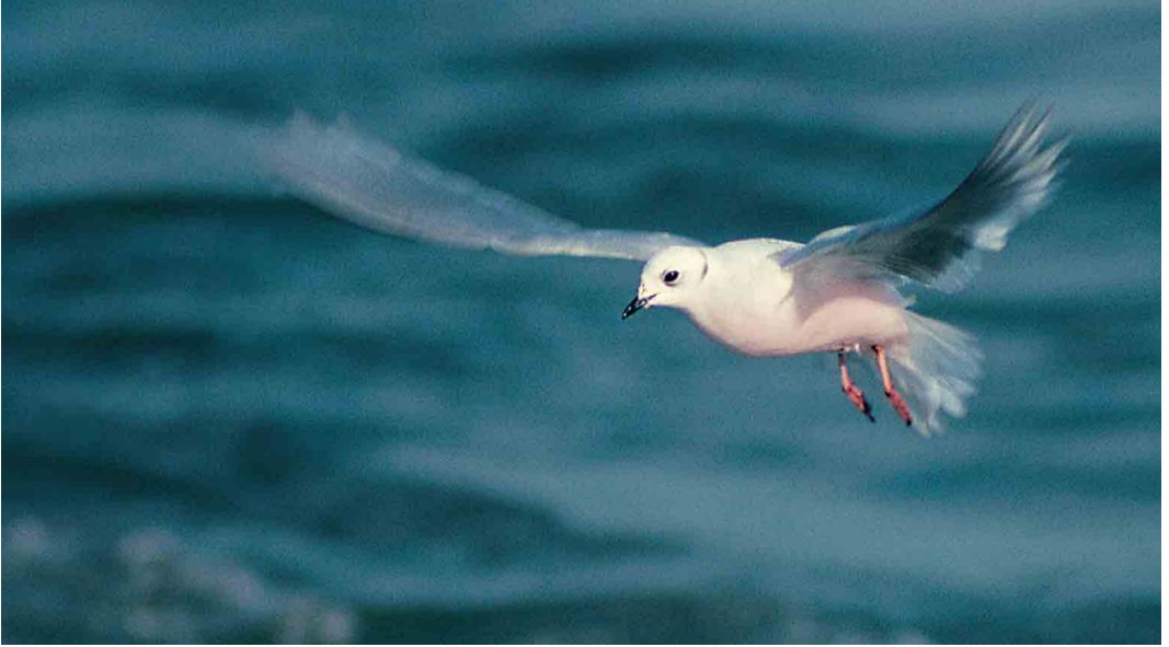
84 With such divine looks, it comes as no surprise to learn that Ross's Gulls seem to be Catholic (Anthony McGeehan)

gate the Antarctic Continent and established the existence of the vast Ross ice-shelf.