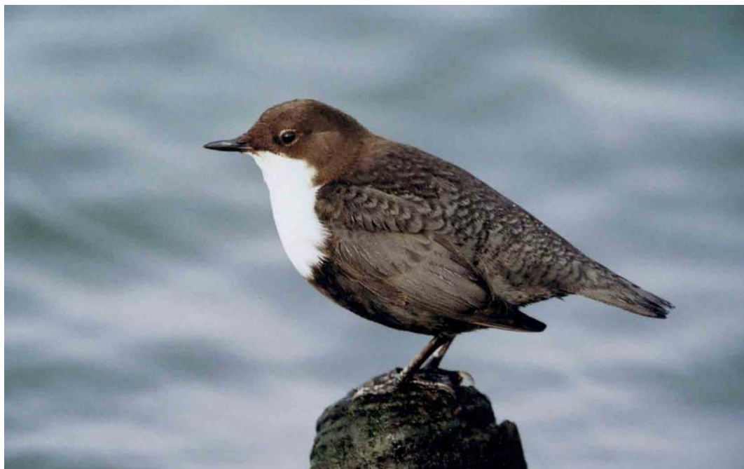
105 Zwartbuikwaterspreeuw / Black-bellied Dipper Cinclus cinclus cinclus , Ketelbrug, Flevoland, 1 februari 2002