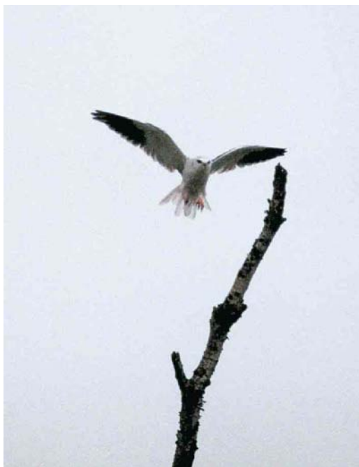
65-66 Grijze Wouw / Black-winged Kite Elanus caeruleus , Meerstalblok, Bargerveen, Drenthe, 28 juli 2000 (Arian van Dam)

ochtend en in de late namiddag en avond zien, terwijl de vogel overdag vaak 'onvindbaar' was. De vogel bleef tot 23 augustus in het gebied. Enkele malen stak hij de nabijgelegen Duitse grens over maar de waarneming is (nog) niet formeel aanvaard voor Duitsland (van der Vliet et al 2001). In het nabijgelegen Zwartemeer, Drenthe, speelde een plaatselijke snackbar enthousiast in op de toeloop van vogelaars door een 'Patatje Grijze Wouw' aan te bieden.