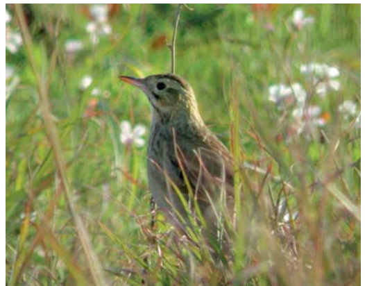
88 African Crake / Afrikaanse Kwartelkoning Crecopsis egregia , Tenerife, Canary Islands, November 2001 (Juan Antonio Lorenzo) 89 White-tailed Eagle / Zeearend Haliaeetus albicilla , first-winter, Circeo NP, Lazio, Italy, January 2002 (Marco Andreini) 90-91 Allen's Gallinule / Afrikaans Purperhoen Porphyryla alleni , Benidorm, Alacant, Spain, 26 February 2002 (Elias Gomis Martin) 92 Pallas's Gull / Reuzenzwartkopmeeuw Larus ichthyaeus , first-winter, Lentini lake, Siracusa, Sicily, Italy, 6 January 2002 (Andrea Corso) 93 Richard's Pipit / Grote Pieper Anthus richardi , adult, Siracusa, Sicily, Italy, 9 January 2002 (Andrea Corso)