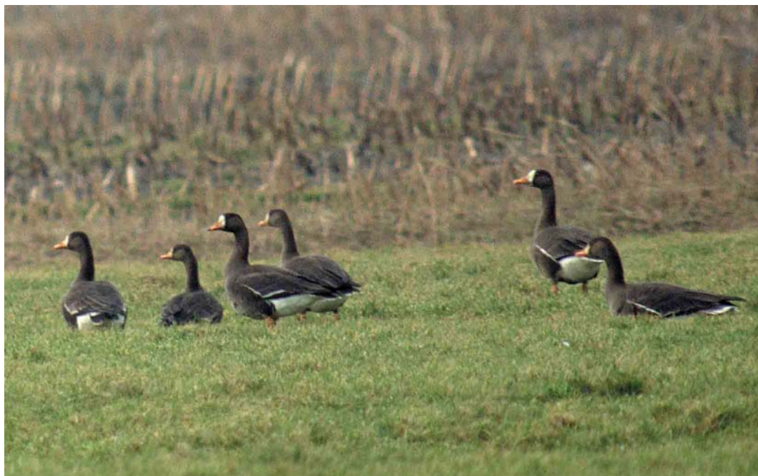
97 Groenlandse Kolganzen / Greenland White-fronted Geese Anser albifrons flavirostris , Burgervlotbrug, Noord-Holland, 16 januari 2002