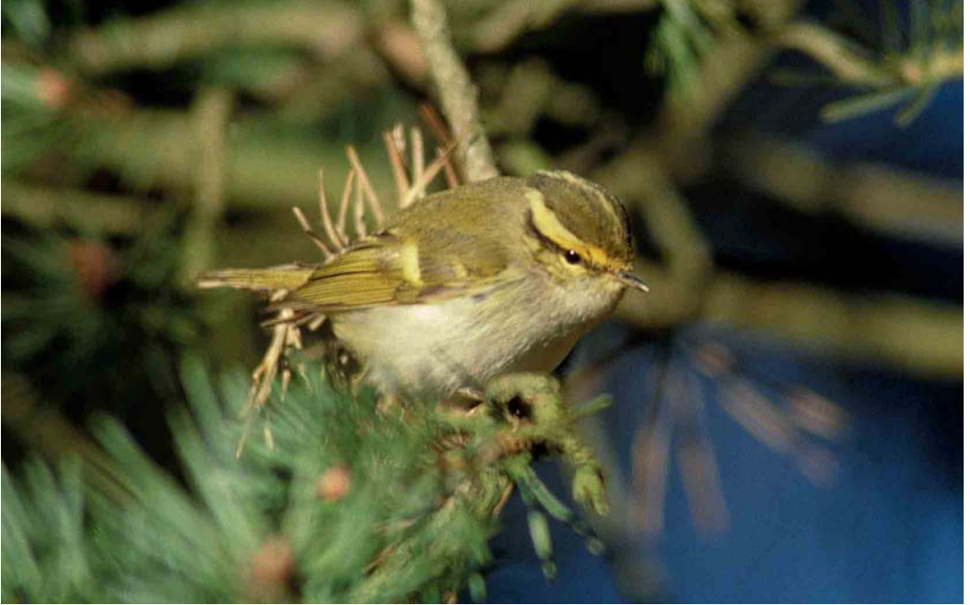
107 Pallas' Boszanger / Pallas's Leaf Warbler Phylloscopus proregulus , Zandvoort, Noord-Holland, 4 januari 2002 (Bas van de Boogaard)