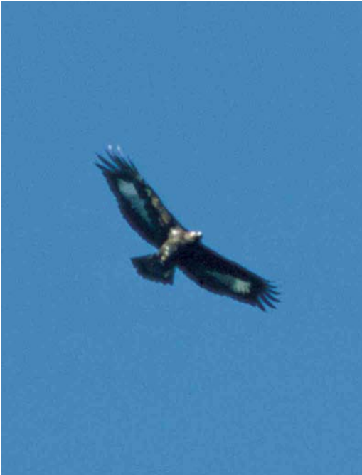
94 Golden Eagle / Steenarend Aquila chrysaetos , first-year, Norg, Drenthe, Netherlands, 16 February 2002

Black Vulture Aegypius monachus for Cyprus since 1982 was an immature at Kensington Cliffs from 8 January (the bird was already reported on 7 December) to at least February. In Sicily, Italy, four Short-toed Eagles Circaetus gallicus remained through January-February. On 11 January, one was at Port-la-nouvelle, Aude, France. The sixth or seventh Bateleur Terathopius ecaudatus for Israel was a first-year at Bet-Guvrin from 6 to at least 14 February. A Shikra Accipiter badius was present at Mushrif National Park, Dubai, UAE, from 29 January to 13 February. In the Camargue, Bouches-du-Rhône, France, allegedly up to three Long-legged Buzzard Buteo rufinus were present on 3-15 January including the adult at Mas Neuf from 3 November into February. A Lesser Spotted Eagle Aquila pomarina was reported at Grand Birieu, Dombes, Ain, France, on 20 January. The one wintering in the Camargue from 15 December onwards was still claimed in mid-January. In Spain, a first-winter Greater Spotted Eagle A. clanga was seen at Aiguamolls de l'Empordà, Girona, on 8 January and an adult at La Rocina, Coto Doñana, on 10 January. In France, apart from up to three in the Camargue, singles were seen at Dombes, Ain, on 19 February and at Saint-Martin-de-Seignanx, Landes, during January-February. In Hungary, a third-year was at Ferençmajor fish-ponds on 4 January and an adult at the same site from 13 January onwards; another was at the Hortobágy from 6 January