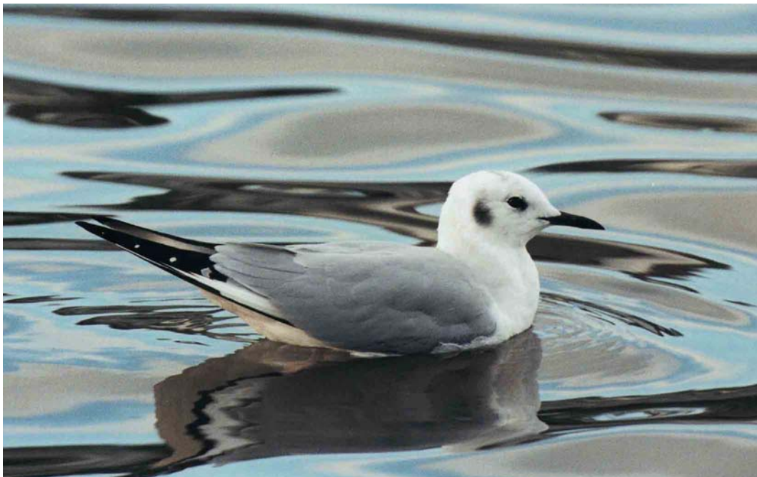
87 Bonaparte's Gull / Kleine Kokmeeuw Larus philadelphia , Millbrook, Cornwall, England, March 2002