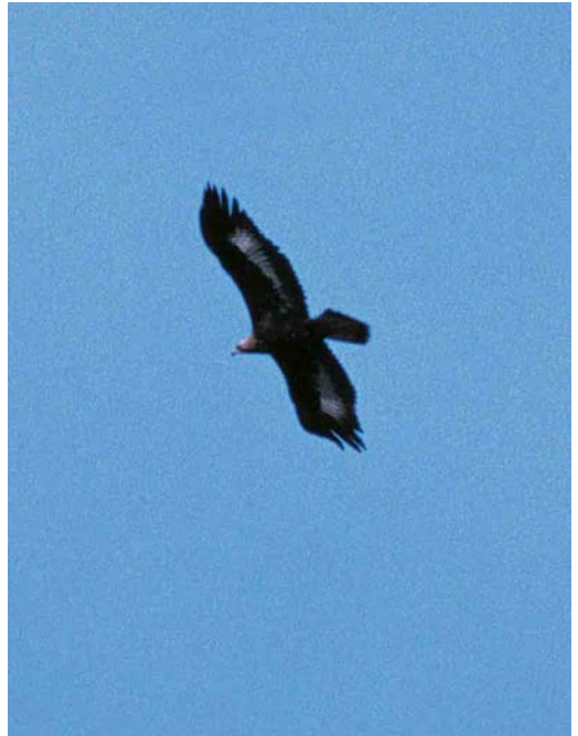
109 Steenarend / Golden Eagle Aquila chrysaetos, eerstejaars, Norg, Drenthe, 11 februari 2002