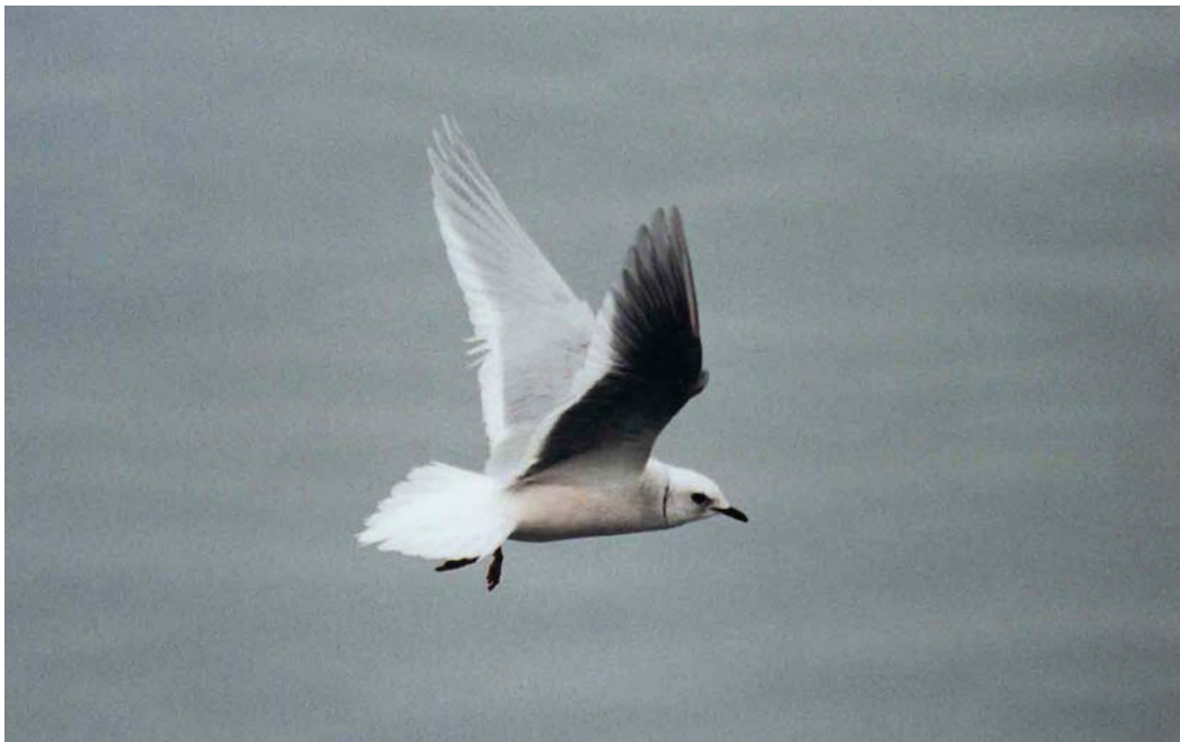
86 Ross's Gull / Ross' Meeuw Rhodostethia rosea , Plym Estuary, Devon, England, March 2002