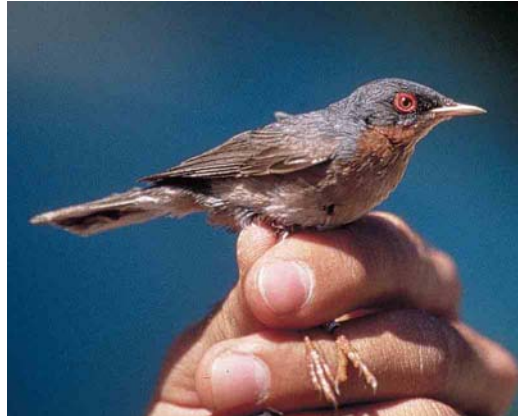
68-69 Moltoni's Warbler / Moltoni's Baardgrasmus Sylvia cantillans moltonii , adult male, Castellania, Alessandria province, Piemonte, Italy, 11 June 2001 (Ottavio Janni)

weeks later than the average cantillans , corresponding well to the late breeding season of moltonii (Shirihai et al 2001). On 11 June, an adult male (the age was determined by the pale orange iris) was captured and photographed. The bird responded aggressively to tape-recordings of territorial songs of both cantillans and moltonii . Its measurements were as follows: bill (to skull) 12.9 mm, wing (maximum chord) 64.5 mm, tarsus 19.6 mm; and weight 9.4 g. The feathers replaced during the moult into summer plumage included the sixth secondary, the four outer greater coverts, the median tertial, the central pair of the rectrices and the small alula-feather. The bird was thus indistinguishable from cantillans on its moult pattern as it belonged to those birds undertaking only a partial moult into summer plumage.