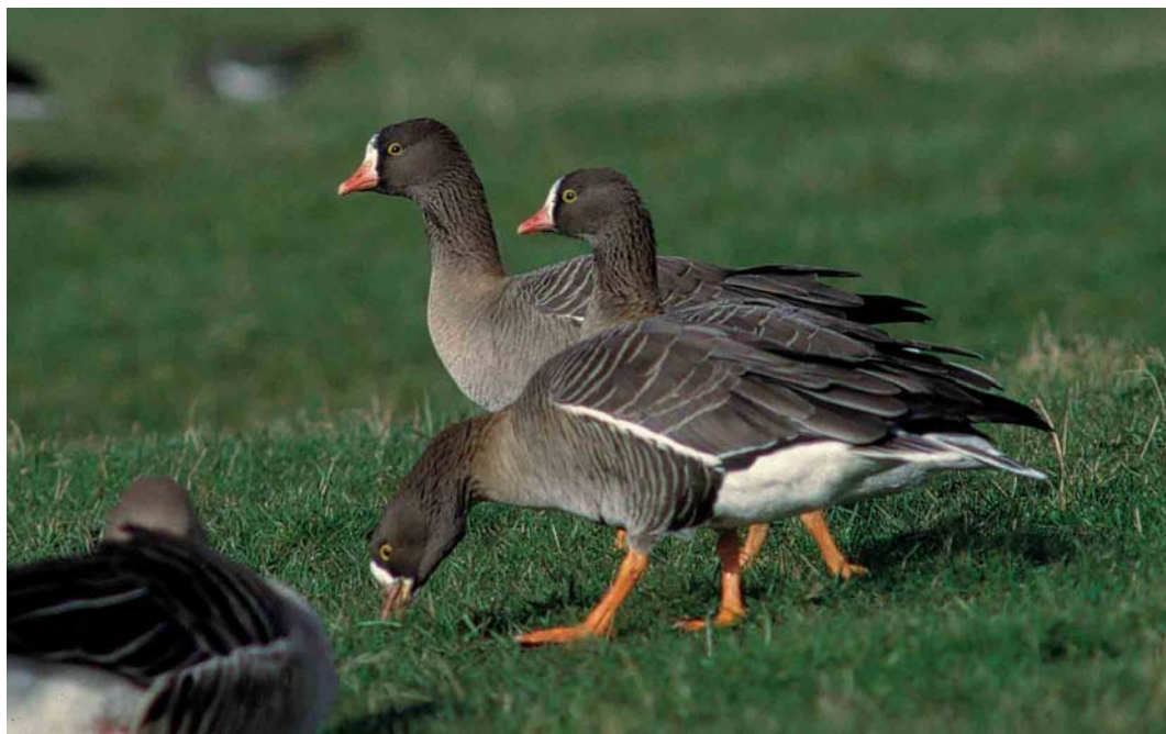
98 Dwergganzen / Lesser White-fronted Geese Anser erythropus , Camperduin, Noord-Holland, 20 februari 2002