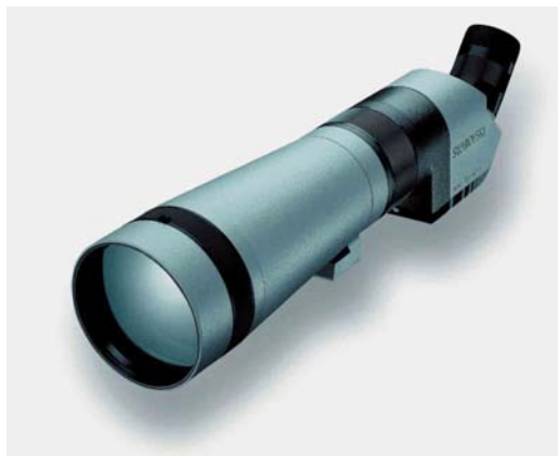
Swarovski AT80 telescope