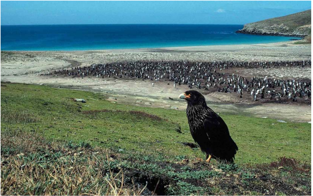
23 Striated Caracara / Falklandcaracara Phalcoboenus australis , near colony of Gentoo Penguin / Ezelspinguïn Pygoscelis papua , New Island, Falkland Islands, January 1991 (René Pop) 24 Southern Crested Caracaras / Zuidelijke Kuifcaracara's Caracara plancus , Saunders Island, Falkland Islands, December 1990 (René Pop) 25 Rufous-chested Plover / Patagonische Plevier Charadrius modestus , Saunders Island, Falkland Islands, December 1990 (René Pop)