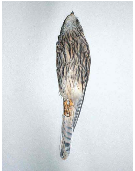
79-82 Kleine Torenvalk / Lesser Kestrel Falco naumanni , eerstejaars vrouwtje (gevonden bij Bergen, Noord-Holland, op 5 november 2000), Zoölogisch Museum Amsterdam, Noord-Holland, 18 december 2000 (André J van Loon)