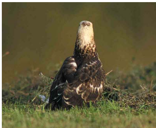
Mystery photograph I (September)