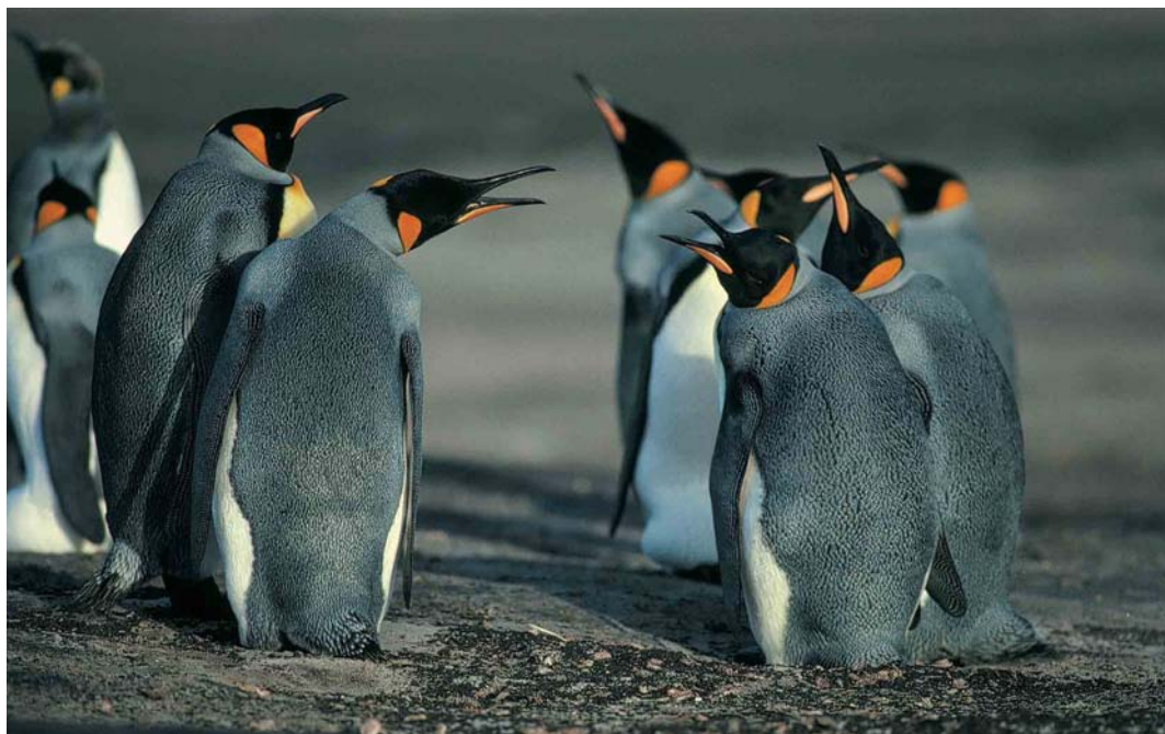
15 King Penguins / Koningspinguïns Aptenodytes patagonicus , Saunders Island, Falkland Islands, December 1990