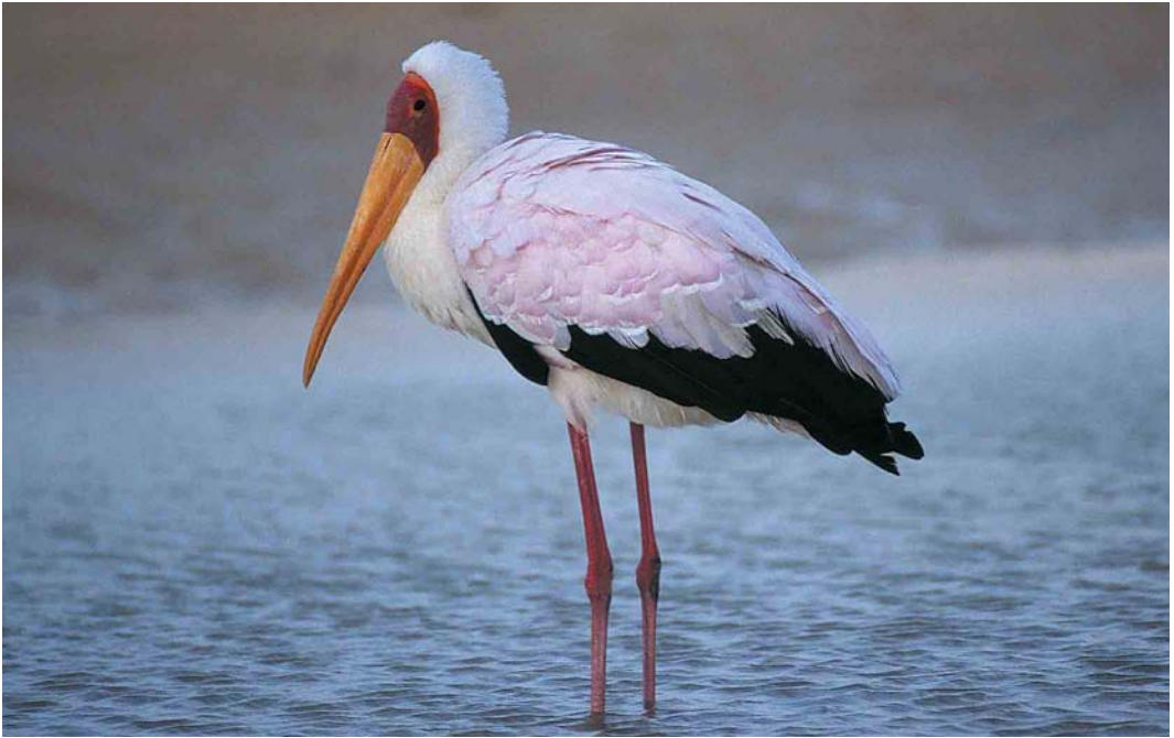
55 Yellow-billed Stork / Afrikaanse Nimmerzat Myxerpes ibis , Fuerteventura, Canary Islands, 7 November 2000 (Max Berlijn)