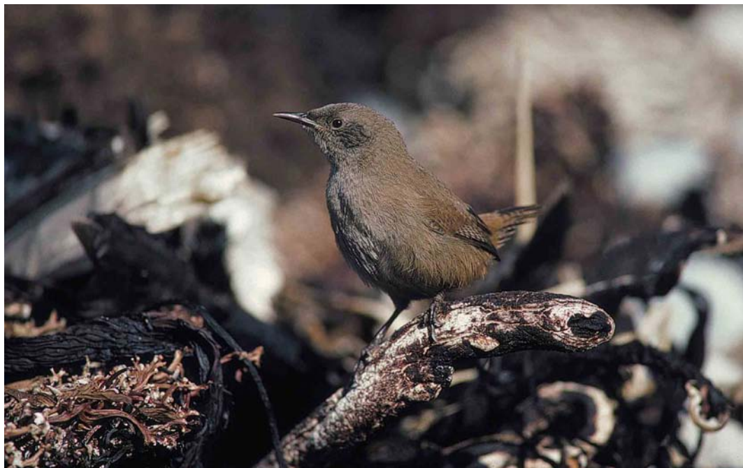
30 Cobb's Wren / Falklandwinterkoning Troglodytes cobbi , Kidney Island, Falkland Islands, January 1991 (René Pop)