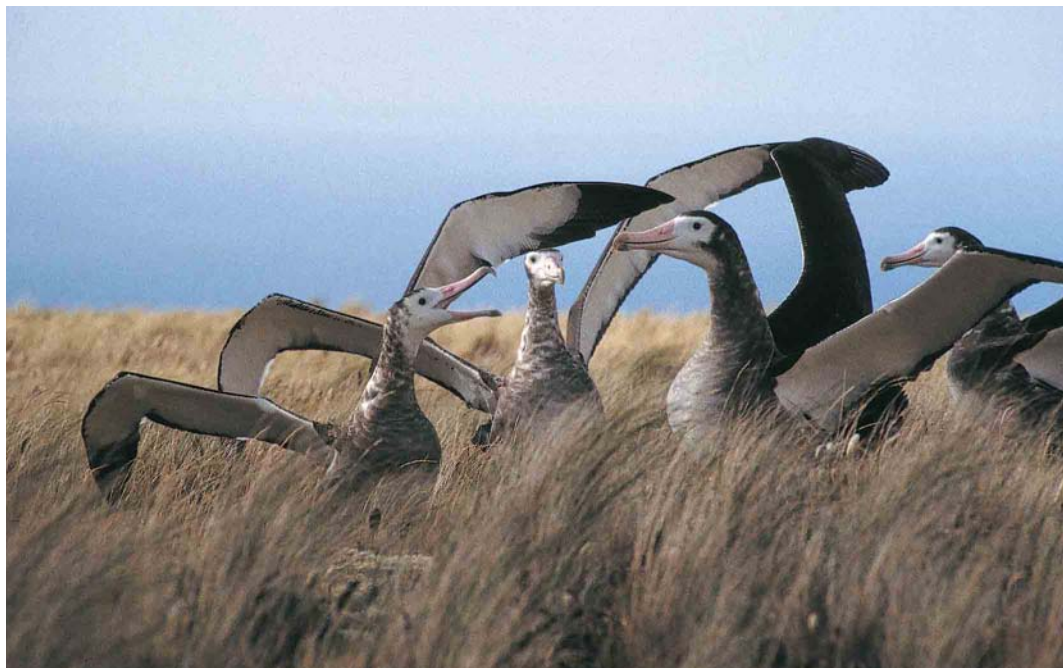
9 Amsterdam Albatrosses / Amsterdameilandalbatrossen Diomedea amsterdamensis , Amsterdam Island, Indian Ocean, January/February 1994 (Yann Tremblay)