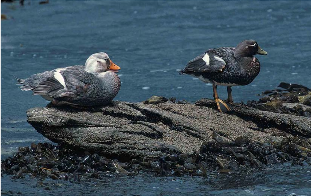
11 Falkland Steamer Duck / Falklandbooteend Tachyeres brachypterus , Kidney Island, Falkland Islands, January 1991 (René Pop) 12 Black-browed Albatrosses / Wenkbrauwalbatrossen Diomedea (melanophris) melanophris , New Island, Falkland Islands, January 1991 (René Pop) 13 Turkey Vultures / Roodkopgieren Cathartes aura falklandicus , New Island, Falkland Islands, December 1990 (René Pop)