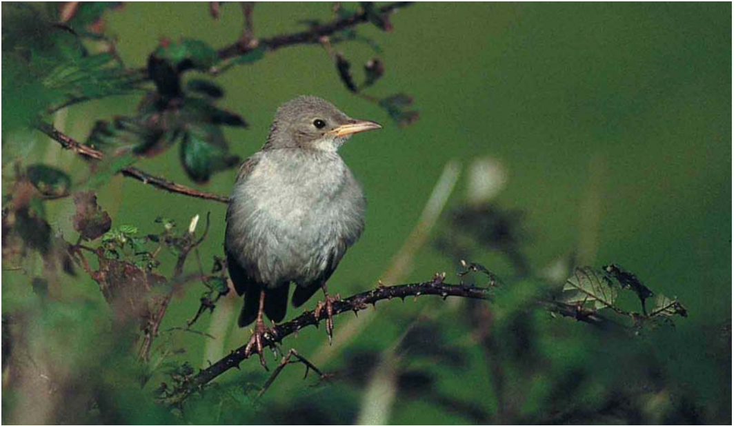
52 It took eight hours and 5000 kcal of effort to find this Rose-coloured Starling. Better than twitching it?

stuck with a sense of purpose that comes with strings attached. To me birding is hunting and the prizes have to be earned. Don't be fooled. When I am in the field I'm not unwinding in the soothing surroundings of the countryside – I'm locked in mortal, single-handed combat with Mother Nature's waifs and strays. Several emotions are in play: excitement, determination, patience and desperation. I need a fix but first I have to go through some kind of agony.