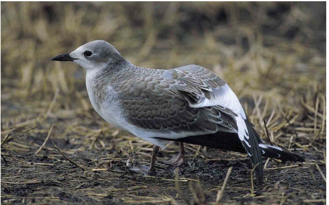
68 Vorkstaartmeeuw / Sabine's Gull Larus sabini , juveniel ruiend naar eerste-winter, Nieuwkoop, Zuid-Holland, 11 november 2000