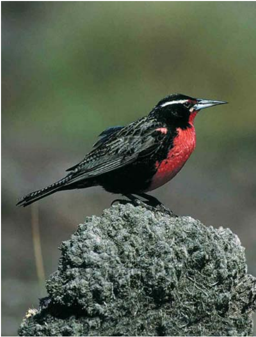
32 Long-tailed Meadowlark / Grote Weidespreeuw Sturnella loyca falklandica , Western Falkland, Falkland Islands, January 1991