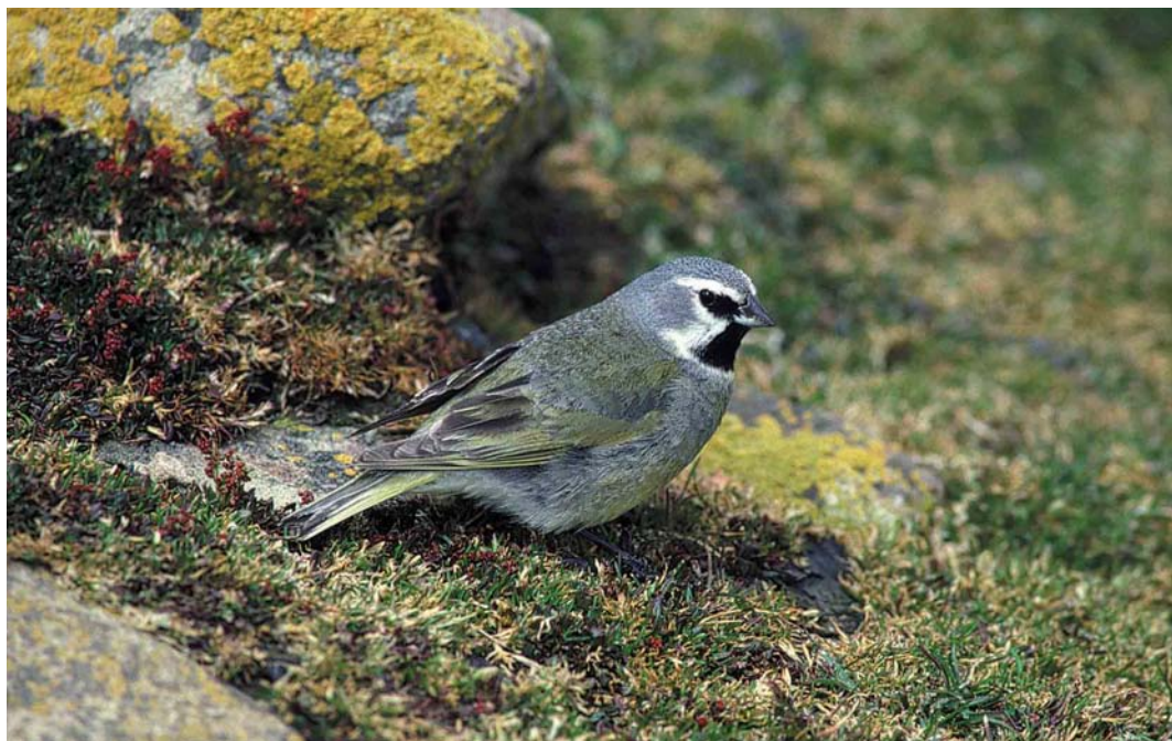
31 Canary-winged Finch / Magelhaengors Melanodera melanodera melanodera , Saunders Island, Falkland Islands, December 1990