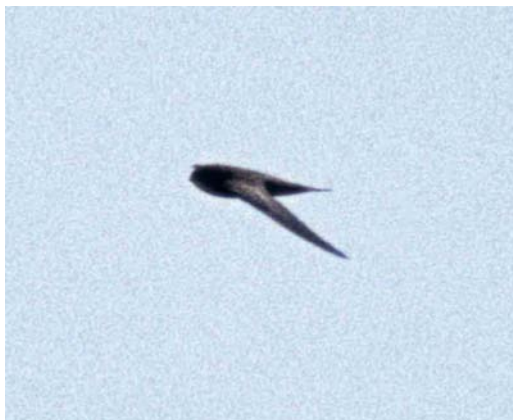
34 Possible Bates' Swift / mogelijke Bates' Gierzwaluw Apus batesi , Rabil Lagoon, Boavista, Cape Verde Islands, 22 February 1999

which Schouteden's Swift S schoutedeni is extremely rare and local, found only in Congo) could be excluded by their different structure: Schoutedenapus swifts are rather fat bodied and show a very pointed, spiky tail (not unlike White-rumped Swift A caffer ); they have a proportionally broader innerwing and a shorter-looking outerwing which gradually tapers to a sharp point. The throat is paler in Scarce Swift S myoptilus and a blue gloss is absent in both species. Cypsiurus species (the two palm swifts) are extremely slender, have a pale brown-grey plumage and show a different flight action.