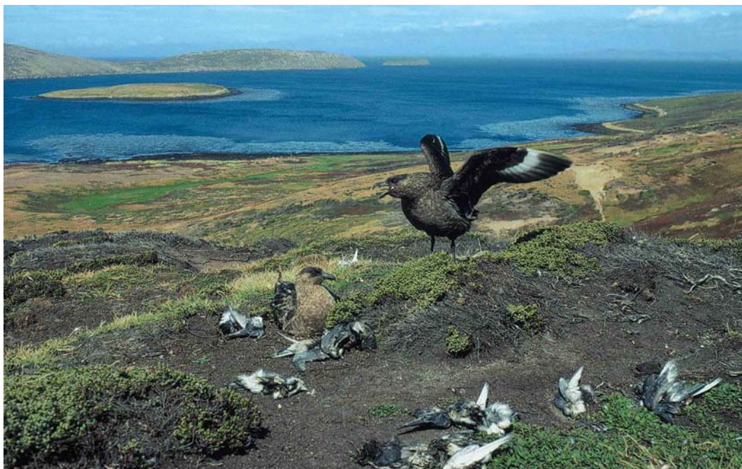
26 Brown Skuas / Subantarktische Grote Jagers Stercorarius antarcticus , New Island, Falkland Islands, January 1991 (René Pop)