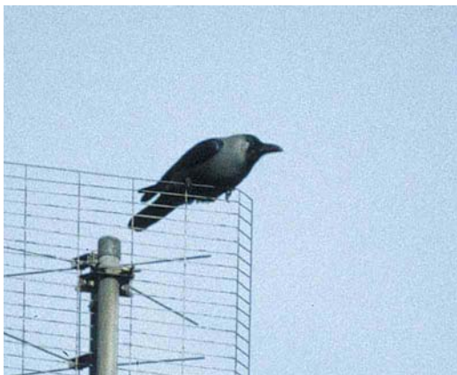
71 Huis kraai / House Crow Corvus splendens , adult, Hoorn, Noord-Holland, 29 oktober 2000