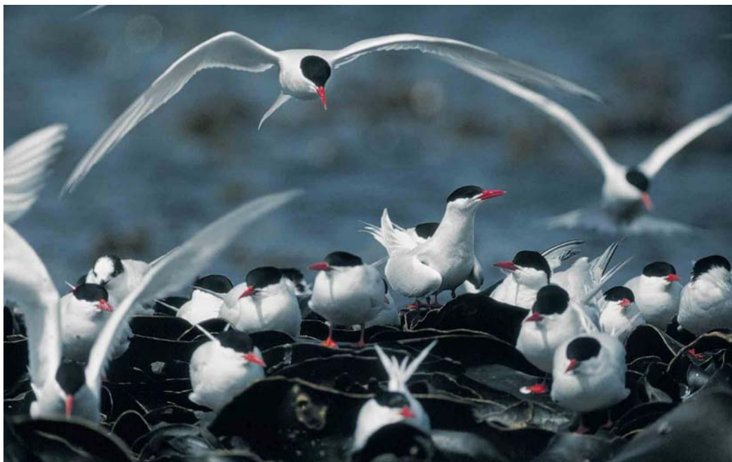
28 South American Terns / Zuid-Amerikaanse Visdieveen Sterna hirundinacea , Saunders Island, Falkland Islands, December 1990 (René Pop)