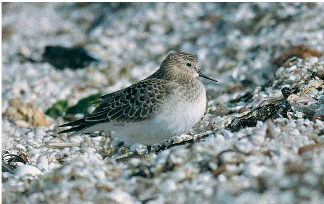
62 Baird's Sandpiper / Bairds Strandloper Calidris bairdii , juvenile, Stensnæs, Sæby, Nordjylland, Denmark, September 2000 (Allan Kjør Villesen) cf Dutch Birding 22: 297, 2000