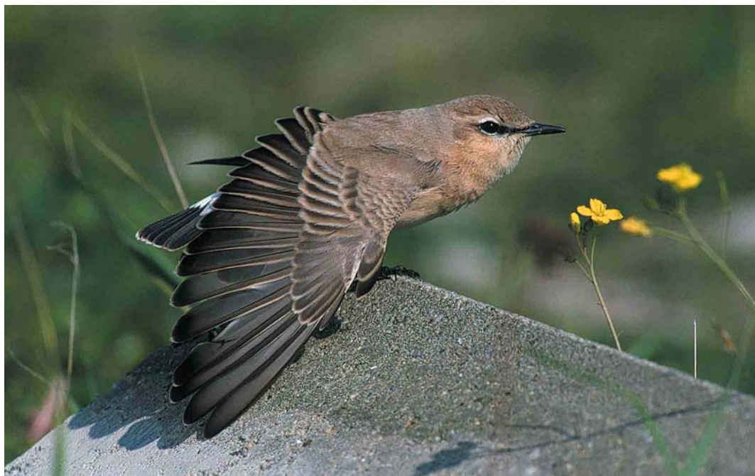
70 Izabeltapuit / Isabelline Wheatear Oenanthe isabellina , eerstejaars, IJmuiden, Noord-Holland, 23 september 2000 (Do van Dijck) cf Dutch Birding 22: 311, 2000