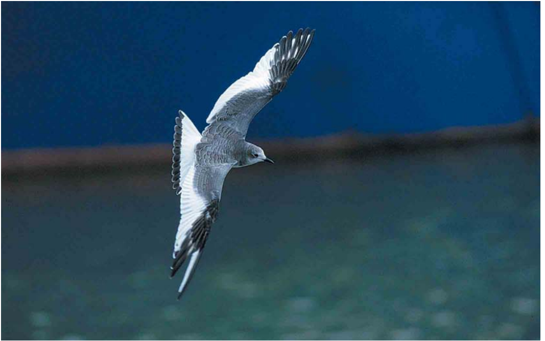
67 Vorkstaartmeeuw / Sabine's Gull Larus sabini , juveniel, Lauwersoog, Groningen, 14 oktober 2000 cf Dutch Birding 22: 311, 2000