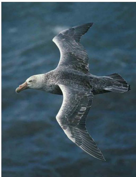
16 Black-browed Albatross / Wenkbrauwalbatros Diomedea (melanophris) melanophris , New Island, Falkland Islands, December 1990 (René Pop) 17 Southern Giant Petrel / Zuidelijke Reuzenstormvogel Macronectes giganteus , adult, Saunders Island, Falkland Islands, December 1990 (René Pop) 18 Silvery Grebes / Zilverfuten Podiceps occipitalis occipitalis , Sea Lion Island, Falkland Islands, February 1991 (René Pop)