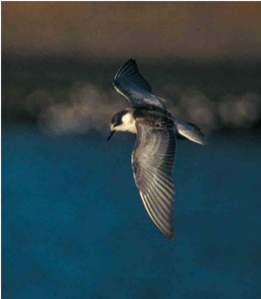
36 Whiskered Tern / Witwangstern Chlidonias hybridus , juvenile moulting to first-winter plumage, Den Oever, Noord-Holland, Netherlands, 5 November 1995 (Sander Lagerveld)