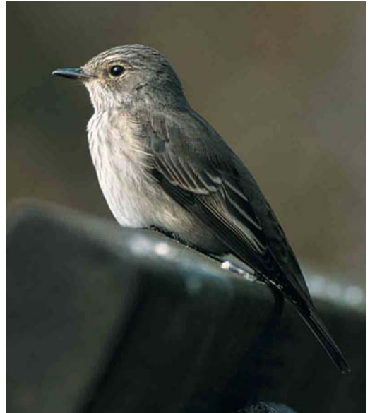
37 Spotted Flycatcher / Grauwe Vliegenvanger Muscicapa striata , first-winter, Helgoland, Schleswig-Holstein, Germany, October 2000

X Although belonging to the tern family for the same reasons as described for mystery bird IX, there are quite obvious structural differences between these two mystery birds. This bird has broader, proportionally shorter and more blunt-tipped wings than mystery bird IX and a shorter and more rounded tail with all tail-feathers round-tipped. All these features point to the marsh terns Chlidonias : Black C niger , White-winged C leucopterus and Whiskered Tern C hybridus . Additionally, the shape of the outer primaries is more curved in Chlidonias terns than in Sterna terns, which is also shown by the mystery bird.