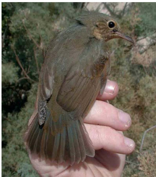
65 Siberian Blue Robin / Blauwe Nachtegaal Luscinia cyane , first-year female, Ebro delta, Catalunya, Spain, 18 October 2000 cf Dutch Birding 22: 299, 2000

Leaf Warbler P. humei for Norway this autumn (and the seventh ever) turned up at Nærland, Rogaland, on 5-6 November and the fifth at Mølen, Vestfold, on 11-12 November. The ninth (and the first of the autumn) for Denmark at Ribe, Vestjylland, on 15 October was also the earliest ever. On 7-11 November, an influx of seven occurred in eastern Britain; one was at Portland Bill on 4 December. Two were seen in Sweden in November. In Israel, one was territorial at the Eilat cemetery on 10 November. The only one in the Netherlands was found at Oosterscheldekering, Zeeland, on 10 November. During early January, a Dusky Warbler P. fuscatus was still present at Grouville, Jersey, Channel Islands.