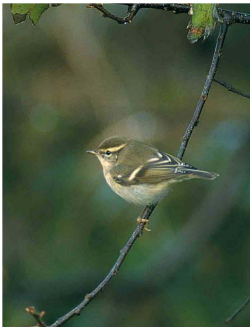
76 Bruine Boszanger / Dusky Warbler Phylloscopus fuscatus , Castricum, Noord-Holland, 5 november 2000 (Arnold Wijker) 77 Bladkoning / Yellow-browed Warbler Phylloscopus inornatus , Texel, Noord-Holland, november 2000 (Erik Menkveld) 78 Sperwergrasmus / Barred Warbler Sylvia nisoria , eerstejaars, Maasvlakte, Zuid-Holland, 17 september 2000 (Jan van Holten) cf Dutch Birding 22: 312, 2000