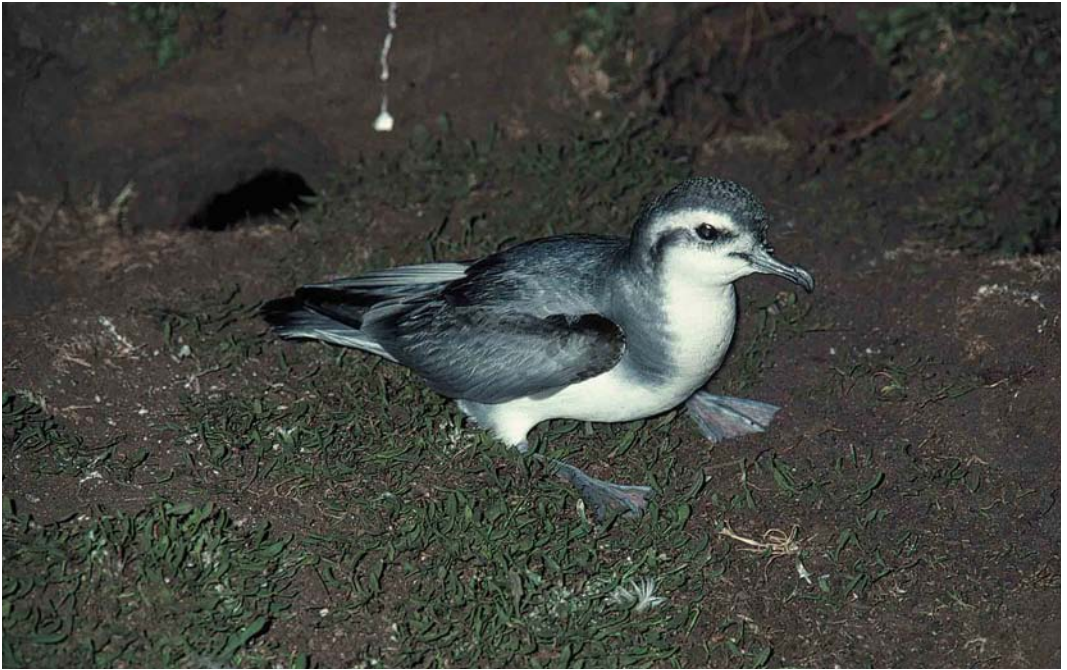
19 Slender-billed Prion / Dunbekprion Pachyptila belcheri , New Island, Falkland Islands, December 1990