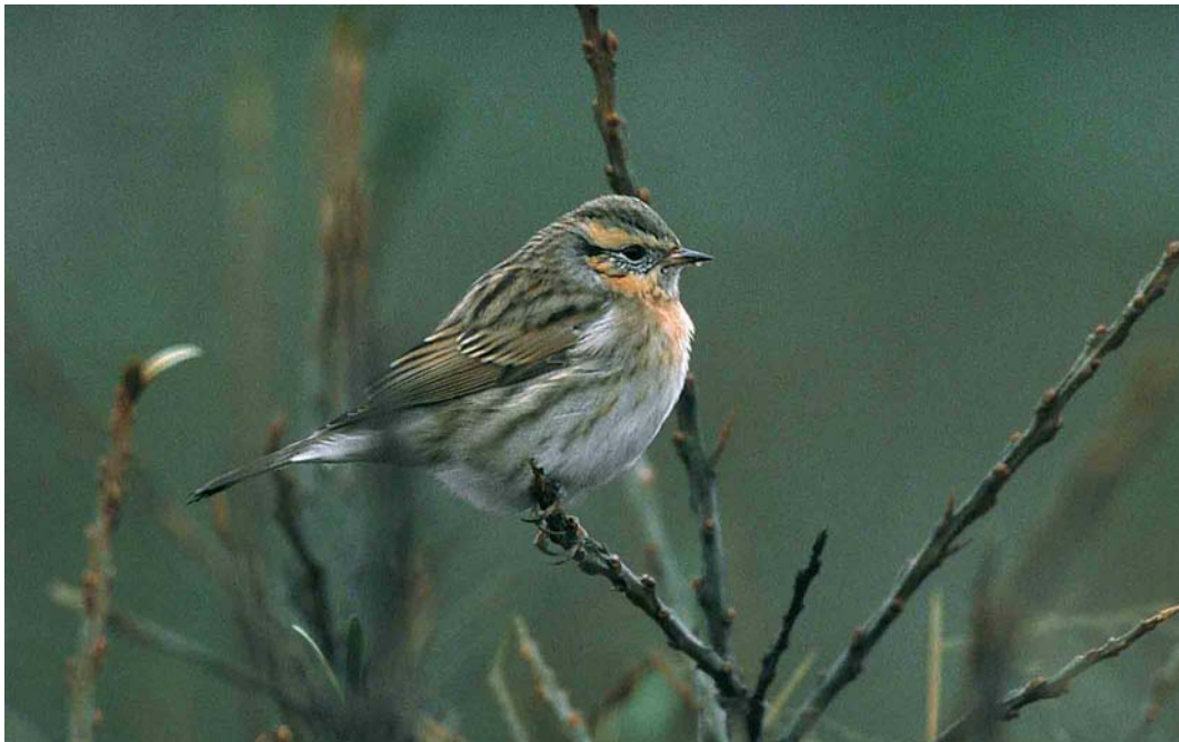
63 Black-throated Accentor / Zwartkeelheggenmus Prunella atrogularis , Pori, Tahkoluoto, Finland, November 2000