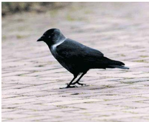
72 Russische Kauw / Russian Jackdaw Corvus monedula soemmerringii , Rotterdam, Zuid-Holland, 14 oktober 2000 (Chris van Rijswijk)

november, IJmuiden; 2 december, Den Oever. Visdief S hirundo : tot 19 december, Den Oever. Zwarte Stern C niger : tot 23 december maximaal vijf bij Den Oever. Zomertortel Streptopelia turtur : 29 november, Westkapelle; 17 december, Prunjepolder, Zeeland. Gierzwaluw Apus apus : in totaal vier gemeld, laatste twee 28 november, Delfzijl, Groningen; 1 december, Utrecht, Utrecht. Boerenzwaluw Hirundo rustica : c 25, laatste op 16 december, IJmuiden. Oeverzwaluw Riparia riparia : 7 tot 14 december samen met drie Boerenzwaluwen bij Huizen, Noord-Holland. Huiszwaluw Delichon urbica : 6 november, Huisduinen.