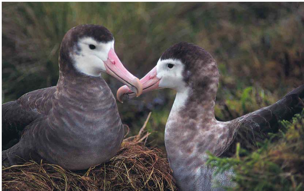
10 Amsterdam Albatrosses / Amsterdameilandalbatrossen Diomedea amsterdamensis , Amsterdam Island, Indian Ocean, March/April 1994