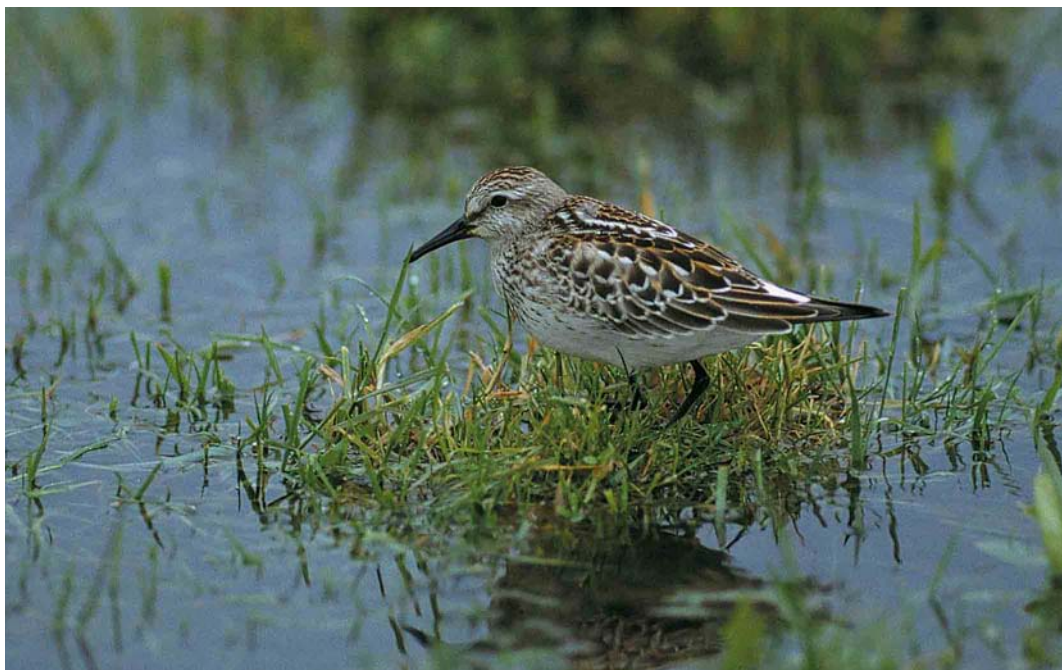
61 White-rumped Sandpiper / Bonapartes Strandloper Calidris fuscicollis , juvenile, Lough Beg, Londonderry, Northern Ireland, 30 October 2000 (Anthony McGeehan)