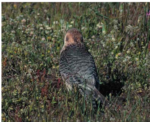
Mystery photograph II (May)

Only subscribers to Dutch Birding are eligible to enter. Excluded from entry are the editors and members of the editorial board of Dutch Birding and the members of the board of the Dutch Birding Association. Photographers whose work is used in the competition (both as mystery birds or