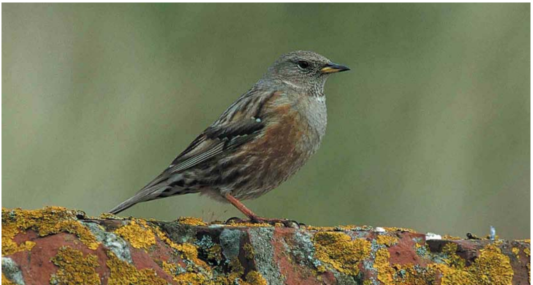
3 Alpenheggenmus / Alpine Accentor Prunella collaris , eerste-zomer, Formerum aan Zee, Terschelling, Friesland, 4 mei 2000 (Eric Koops)

De determinatie van de vogel van Terschelling leverde – na aanvankelijke problemen door de slechte waarnemingsomstandigheden – eveneens geen problemen op. Ook hier sluiten formaat, roodbruine flanken, lichte gevlekte keel, gele snavelbasis en vluchtroep andere soorten uit. Uit het feit de vogel soms zong, zou kunnen worden