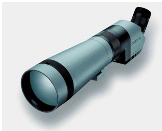
Swarovski AT80 telescope