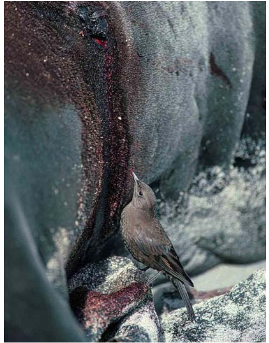
33 Blackish Cinclodes (or Tussacbird) / Zwarte Wipstaart Cinclodes antarcticus antarcticus , Sea Lion Island, Falkland Islands, February 1991

though the latter can be suspected of breeding. Photographs taken during the six-week stay of two breeding gull species, Dolphin Gull Larus scoresbii and Brown-hooded Gull L. maculipennis , were published in Sangster (1999). South American Tern Sterna hirundinacea is a common colonial breeder with an estimated population of 6000-12 000 pairs; most birds are absent during the austral winter. This species occurs widespread along both coasts of mainland South America. Three other terns, Common S. hirundo , Arctic S. paradisaea and Antarctic Tern S. vittata only occur as vagrants or non-breeding visitors.