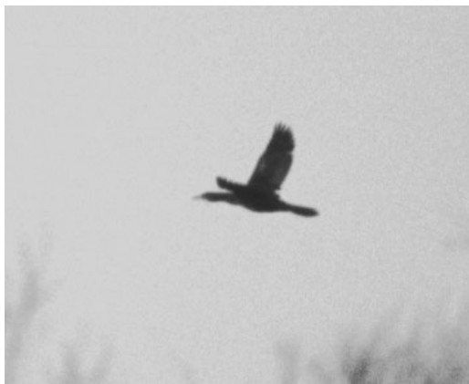
83-84 Dwergaalscholver / Pygmy Cormorant Microcarbo pygmeus , Warneton, Hainaut, 30 december 2000

recordholder Klaas Eigenhuis listed 331 species in 1998. For those interested in the total yearlist, please send a request by e-mail to: jan.wierda@12move.nl.