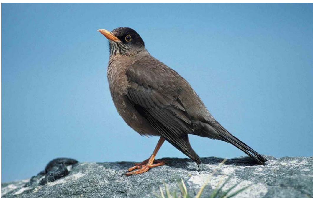
29 Falkland Thrush / Falklandlijster Turdus falcklandii falcklandii , Saunders Island, Falkland Islands, December 1990