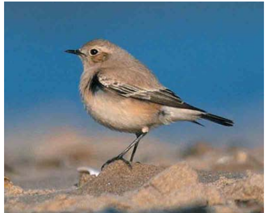
57 Forster's Tern / Forsters Stern Sterna forsteri , adult winter, Bangor, Wales, December 2000 58 Long-tailed Shrike / Langstaartklauwier Lanius schach , first-winter, Howmore, South Uist, Outer Hebrides, Scotland, November 2000 59 Red-flanked Bluetail / Blauwstaart Tarsiger cyanurus , Nova Gorica, Slovenia, 23 November 2000 60 Desert Wheatear / Woestijntapuit Oenanthe deserti , female, Holme Reserve, Norfolk, England, 4 November 2000

Koedijk and Castricum, and on 10 December at Haarlerberg, Sallandse Heuvelrug, Overijssel; some (or all) of these sightings may refer to the same individual. In Switzerland, the juvenile at La Broye remained until 11 November and probably the same individual was seen the next days flying along the Jura and elsewhere; by December, the bird wintering the past two years at Niederriedstausee, Bern, had not returned. In Spain, an adult was seen at Lucio del Lobo, Sevilla, on 25 November and a pale juvenile was at Aiguamolls de l'Empordà, Girona, on 18-21 December. Both in France and in Hungary, three were reported during November; the regular winterers in the Camargue were back in December. For the third consecutive year, one stayed at least until 20 December at Vasche di Maccharese, Roma, Italy. There were several other individuals seen in Italy. In Denmark, the second- or