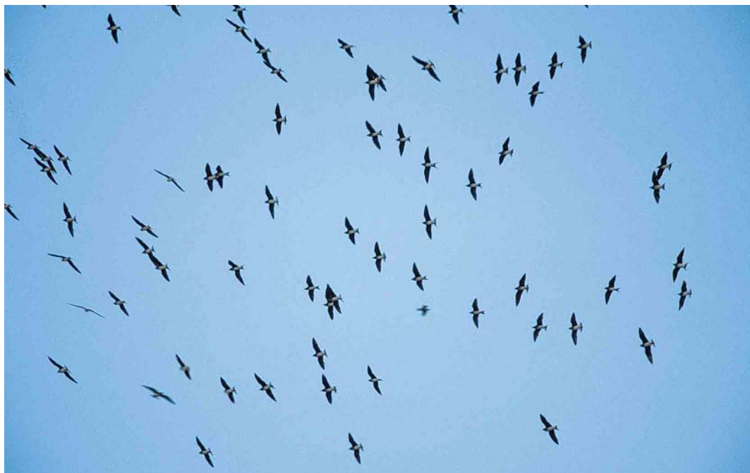
56 Black-winged Pratincoles / Steppevorkstaartplevieren Glareola nordmanni , Van Gölü, Turkey, 15 September 2000 cf Dutch Birding 22: 296, 2000

Camargue, Bouches-du-Rhône, in March 1990). In Poland, singles were seen near Lezajsk on 10 September and at Milicz fishponds on 7 October. The third of the autumn for Switzerland was at Rapperswill, Zürichsee, on 13 November and perhaps the same bird was at Mauensee, Luzern, on 3-21 December. From 22 November, two adults were at Laacher See, Rheinland-Pfalz, Germany. An individual at Lago di Lentini, Sicily, has now been present for two years. The first for Belgium was a juvenile or first-winter on the French border at Warneton and Ploegsteert, Hainaut, from 28 December to 1 January. The first Cinnamon Bittern Ixobrychus cinnamomeus for the UAE was found on Arzanah on 20 November. In Spain, the pied Indian Reef Egret Egretta gularis schistacea present at Llobregat delta, Barcelona, since August was last reported on 29 November; a dark-morph Western Reef Egret E gularis was seen at Veta la Palma, Sevilla, on 17 November. Numbers of Great Egrets Casmerodius albus in western Europe continued to increase. In November, unusual large numbers were recorded at widespread locations throughout Sardinia, Italy; for instance, 90 individuals were in the southern part of the Gulf of Oristano. It was also the best year ever for Spain with 96 individuals during November and 38 during December. It was the same story in the Netherlands where more than 100 were reported from October to early December. The first Purple Heron Ardea purpurea for Norway since 1991 was discovered at Tornesvatnet,