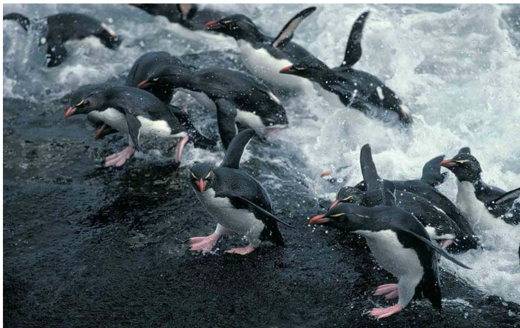
14 Rockhopper Penguins / Rotspinguïns Eudyptes chrysocome chrysocome , Saunders Island, Falkland Islands, December 1990 (René Pop)