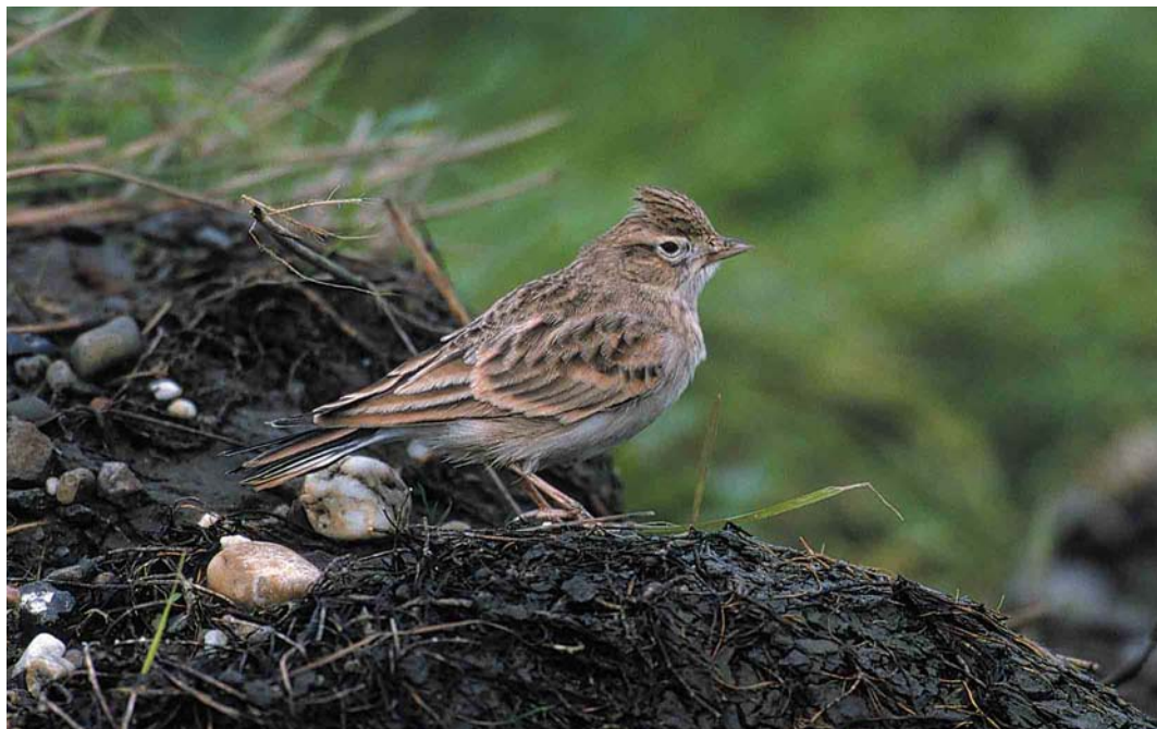
69 Kortteenleeuwerik / Greater Short-toed Lark Calandrella brachydactyla , Camperduin, Schoorl, Noord-Holland, 10 november 2000 (Do van Dijck)