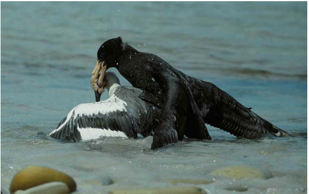
20 Southern Giant Petrel / Zuidelijke Reuzenstormvogel Macronectes giganteus , immature killing Upland Goose / Magelhaengans Chloephaga picta , New Island, Falkland Islands, January 1991