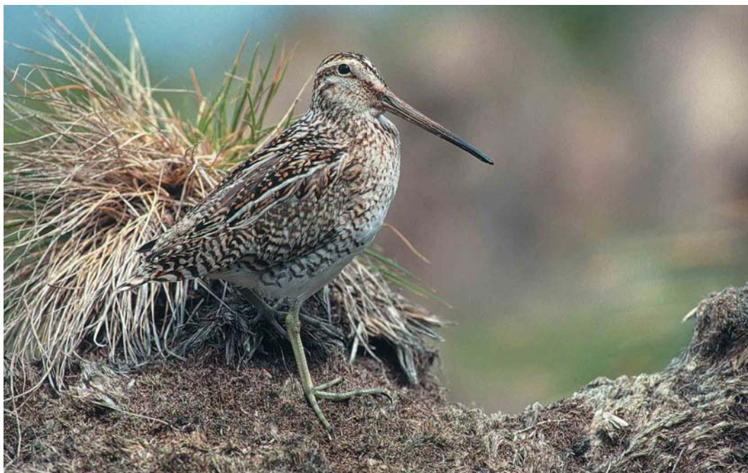
27 Magellanic Snipe / Magelhaensnip Gallinago magellanica , New Island, Falkland Islands, January 1991