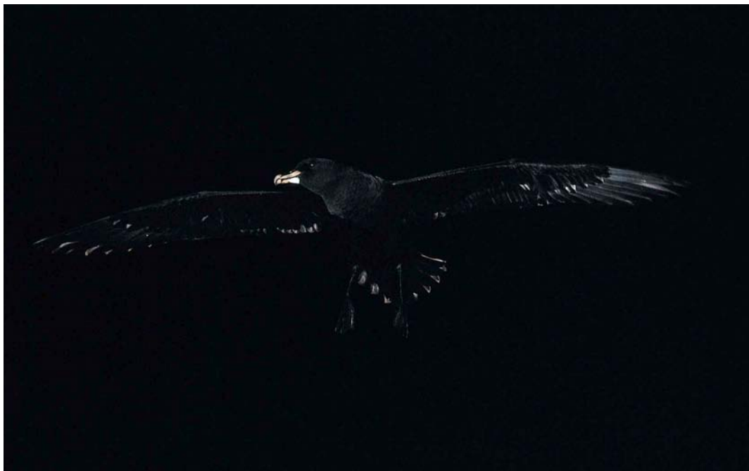
21-22 White-chinned Petrel / Witkinstormvogel Procellaria aequinoctialis , Kidney Island, Falkland Islands, January 1991