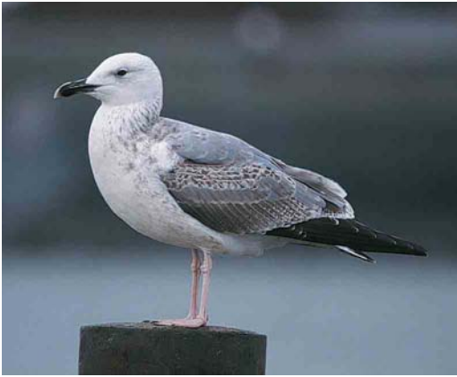
74 Pontische Meeuw / Pontic Gull Larus cachinnans cachinnans , tweede-winter, Lauwersoog, Groningen, 9 november 2000