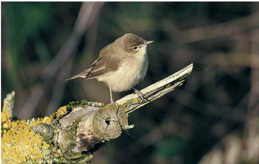
64 Booted Warbler / Kleine Spotvogel Acrocephalus caligatus , Ins, Switzerland, 18 November 2000