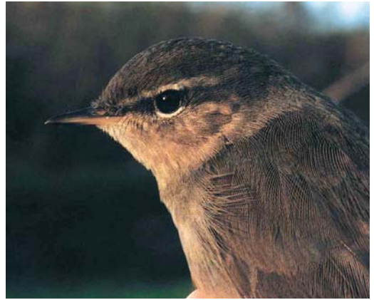
75 Bruine Boszanger / Dusky Warbler Phylloscopus fuscatus , Paradijsveld, AW-duinen, Zandvoort, Noord-Holland, 5 november 2000