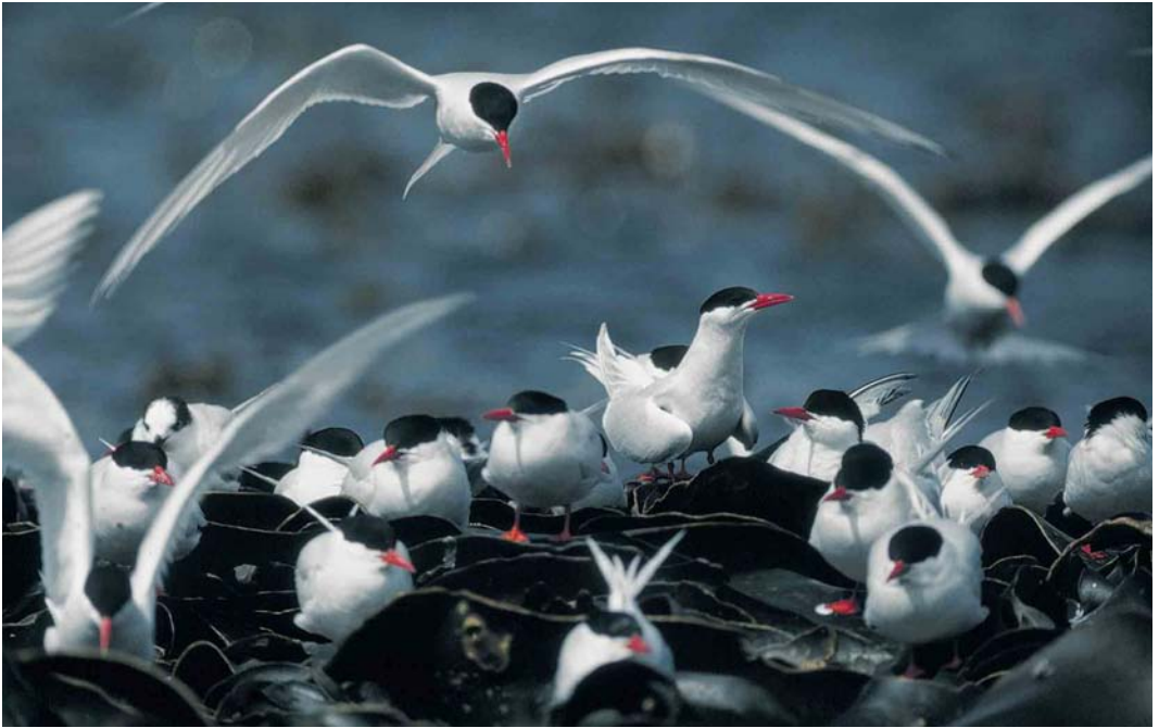
28 South American Terns / Zuid-Amerikaanse Visdieveen Sterna hirundinacea , Saunders Island, Falkland Islands, December 1990 (René Pop)