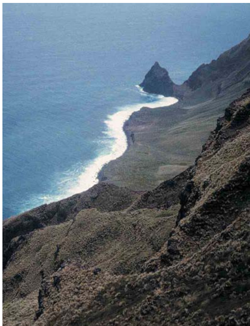
6 Amsterdam Albatross / Amsterdameilandalbatros Diomedea amsterdamensis , Amsterdam Island, Indian Ocean, 1994 (Yann Tremblay) 7 Cape d'Entrecasteaux, Amsterdam Island, Indian Ocean, 20 January 1998 (Alfred van Cleef) 8 Amsterdam Albatross / Amsterdameilandalbatros Diomedea amsterdamensis , Amsterdam Island, Indian Ocean, 5 January 1998 (Alfred van Cleef)