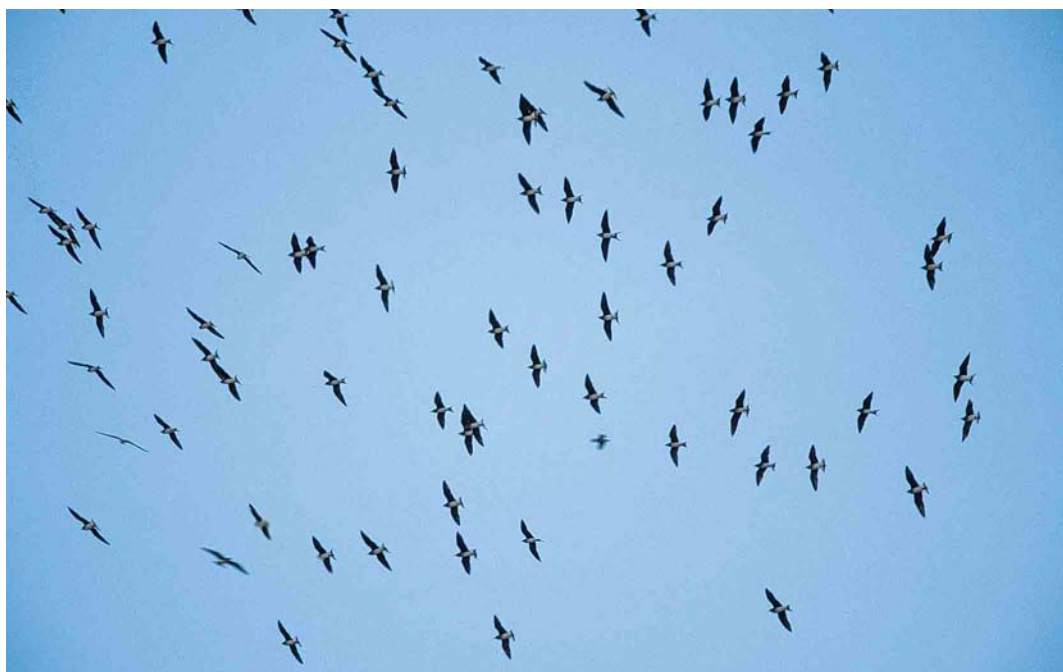
56 Black-winged Pratincoles / Steppevorkstaartplevieren Glareola nordmanni , Van Gölü, Turkey, 15 September 2000 cf Dutch Birding 22: 296, 2000

Camargue, Bouches-du-Rhône, in March 1990). In Poland, singles were seen near Lezajsk on 10 September and at Milicz fishponds on 7 October. The third of the autumn for Switzerland was at Rapperswill, Zürichsee, on 13 November and perhaps the same bird was at Mauensee, Luzern, on 3-21 December. From 22 November, two adults were at Laacher See, Rheinland-Pfalz, Germany. An individual at Lago di Lentini, Sicily, has now been present for two years. The first for Belgium was a juvenile or first-winter on the French border at Warneton and Ploegsteert, Hainaut, from 28 December to 1 January. The first Cinnamon Bittern Ixobrychus cinnamomeus for the UAE was found on Arzanah on 20 November. In Spain, the pied Indian Reef Egret Egretta gularis schistacea present at Llobregat delta, Barcelona, since August was last reported on 29 November; a dark-morph Western Reef Egret E gularis was seen at Veta la Palma, Sevilla, on 17 November. Numbers of Great Egrets Casmerodius albus in western Europe continued to increase. In November, unusual large numbers were recorded at widespread locations throughout Sardinia, Italy; for instance, 90 individuals were in the southern part of the Gulf of Oristano. It was also the best year ever for Spain with 96 individuals during November and 38 during December. It was the same story in the Netherlands where more than 100 were reported from October to early December. The first Purple Heron Ardea purpurea for Norway since 1991 was discovered at Tornesvatnet,