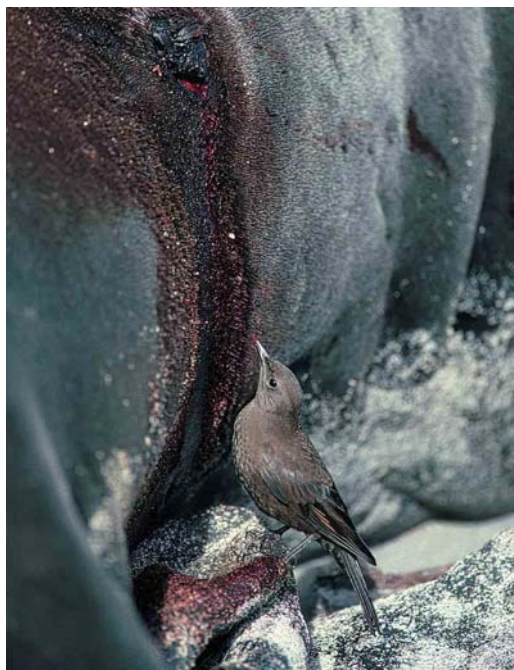
33 Blackish Cinclodes (or Tussacbird) / Zwarte Wipstaart Cinclodes antarcticus antarcticus , Sea Lion Island, Falkland Islands, February 1991 (René Pop)

though the latter can be suspected of breeding. Photographs taken during the six-week stay of two breeding gull species, Dolphin Gull Larus scoresbii and Brown-hooded Gull L. maculipennis , were published in Sangster (1999). South American Tern Sterna hirundinacea is a common colonial breeder with an estimated population of 6000-12 000 pairs; most birds are absent during the austral winter. This species occurs widespread along both coasts of mainland South America. Three other terns, Common S. hirundo , Arctic S. paradisaea and Antarctic Tern S. vittata only occur as vagrants or non-breeding visitors.