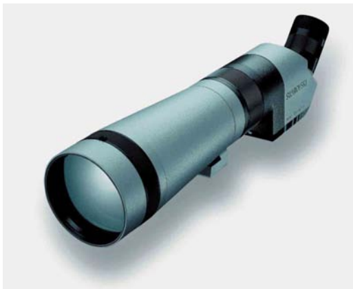
Swarovski AT80 telescope