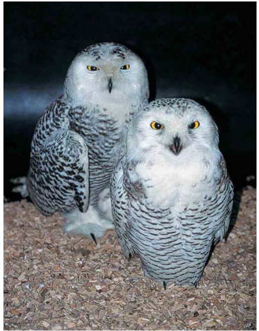
461 Sneeuwuielen / Snowy Owls Nyctea scandiaca (aan land gebracht te Eemshaven, Groningen, op 31 oktober 2001), eerste-winter vrouwtje (links) en eerste-winter mannetje (rechts), vogelopvangcentrum 'De Fûgelhelling', Ureterp, Friesland, 1 november 2001 (Petra van der Heide)

enkele pogingen worden gevangen door Jaap Poortvliet. De volgende dag is de vogel overgebracht naar het revalidatiecentrum 'De Mikke' in Middelburg, Zeeland. Een nieuwe, zeer licht besmeurde vogel werd op 29 oktober gezien in Aardenburg, Zeeland. Het is lastig na te gaan van welke schepen deze vogels afkomstig zijn. Voor de twee Nederlandse vogels zou dit de Menominee kunnen zijn, maar de mogelijkheid bestaat ook dat ze onopgemerkt zijn meegelift op de Federal Saguenay (die ook Terneuzen passeerde), of mogelijk zelfs nog een ander schip. Beide schepen hebben niet aangemeerd in Felixstowe, dus de Engelse vogel lijkt afkomstig te zijn van een ander schip.