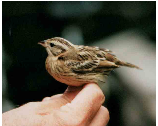
436 Vorkstaartmeeuw / Sabine's Gull Larus sabini , adult of tweede-kalenderjaar ruiend naar winterkleed, Brouwersdam, Zeeland, september 2001 ( Andy Lovering ) 437 Kleine Vliegenvanger / Red-breasted Flycatcher Ficedula parva , adult mannetje, Maasvlakte, Zuid-Holland, 29 september 2001 ( Marjolein Baijens ) 438 Noordse Boszanger / Arctic Warbler Phylloscopus borealis , Schiermonnikoog, Friesland, 13 september 2001 ( Bouke Henstra ) 439 Grauwe Fitis / Greenish Warbler Phylloscopus trochiloides , eerstejaars, Vlieland, Friesland, 1 september 2001 ( Henri Bouwmeester ) 440 Kleine Spotvogel / Booted Warbler Acrocephalus caligatus , Veldiger Buitenland, Hasselt, Overijssel, 22 september 2001 ( Jeroen Bredenbeek ) 441 Wilgengors / Yellow-breasted Bunting Emberiza aureola , juveniel, Schiermonnikoog, Friesland, 11 september 2001 ( Bouke Henstra )