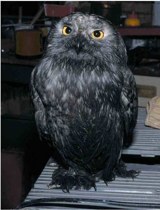
460 Sneeuwuif / Snowy Owl Nyctea scandiaca , vrouwtje, Terneuzen, Zeeland, 24 oktober 2001 (Alex Wieland)