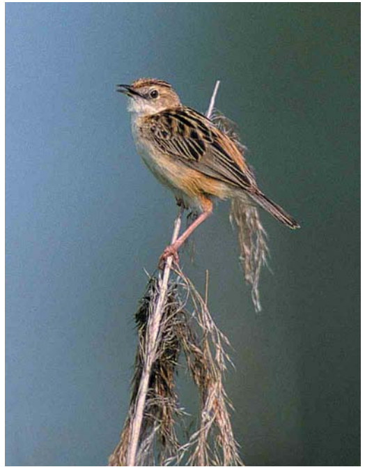
385 Dusky Warbler / Bruine Boszanger Phylloscopus fuscatus (right), with Northern Chiffchaff / Tjiftjaf P. collybita , Amsterdamse Waterleidingduinen, Zandvoort, Noord-Holland, 5 November 2000 386 Zitting Cisticola / Graszanger Cisticola juncidis , Ooltgensplaat, Zuid-Holland, 31 August 2000 387 Cetti's Warbler / Cetti's Zanger Cettia cetti , Bloemendaal, Noord-Holland, 17 September 2000