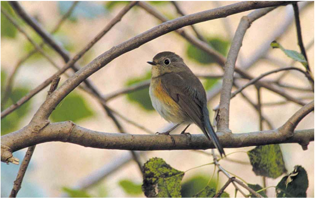
453 Blauwstaart / Red-flanked Bluetail Tarsiger cyanurus , Blankenberge, West-Vlaanderen, België, 25 september 2001 (Filip De Ruwe)