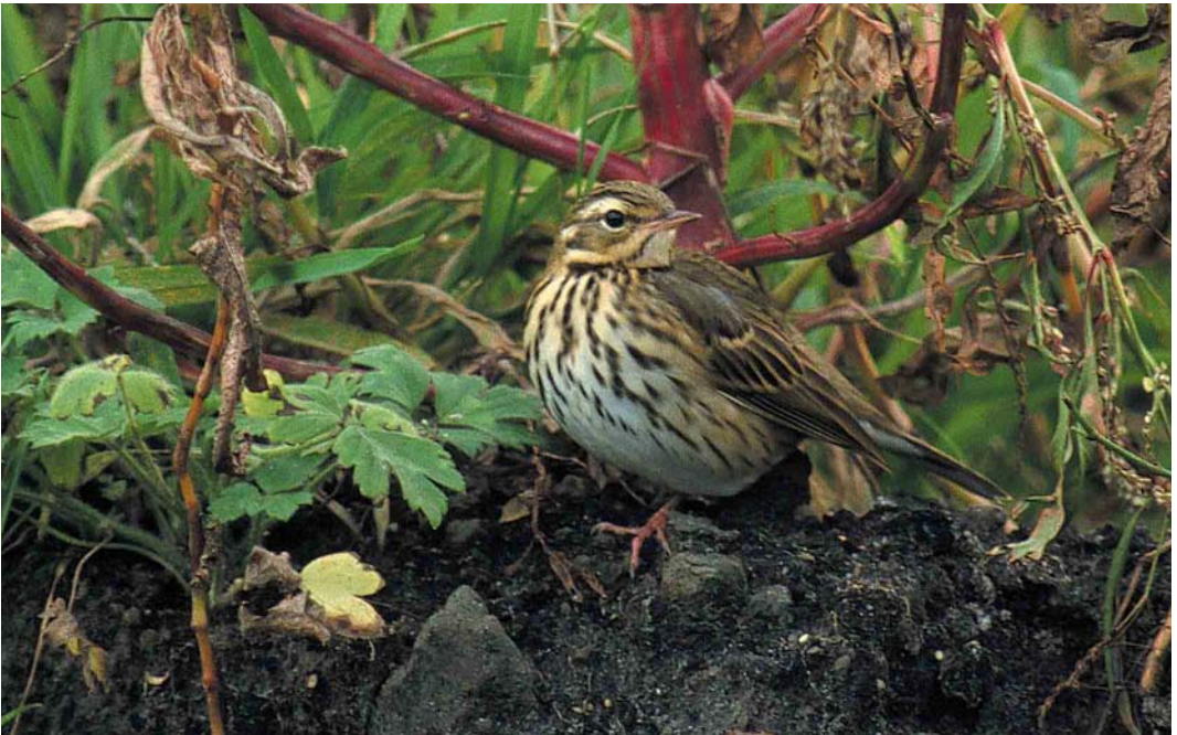
455 Siberische Boompieper / Olive-backed Pipit Anthus hodgsoni , Mariahoeve, Den Haag, Zuid-Holland, 3 oktober 2001

OLIVE-BACKED PIPIT An Olive-backed Pipit Anthus hodgsoni stayed between Den Haag and Wassenaar, Zuid-Holland, the Netherlands, on 2-5 October 2001. This was the 10th record for the Netherlands and the first to be twitchable since 1991.