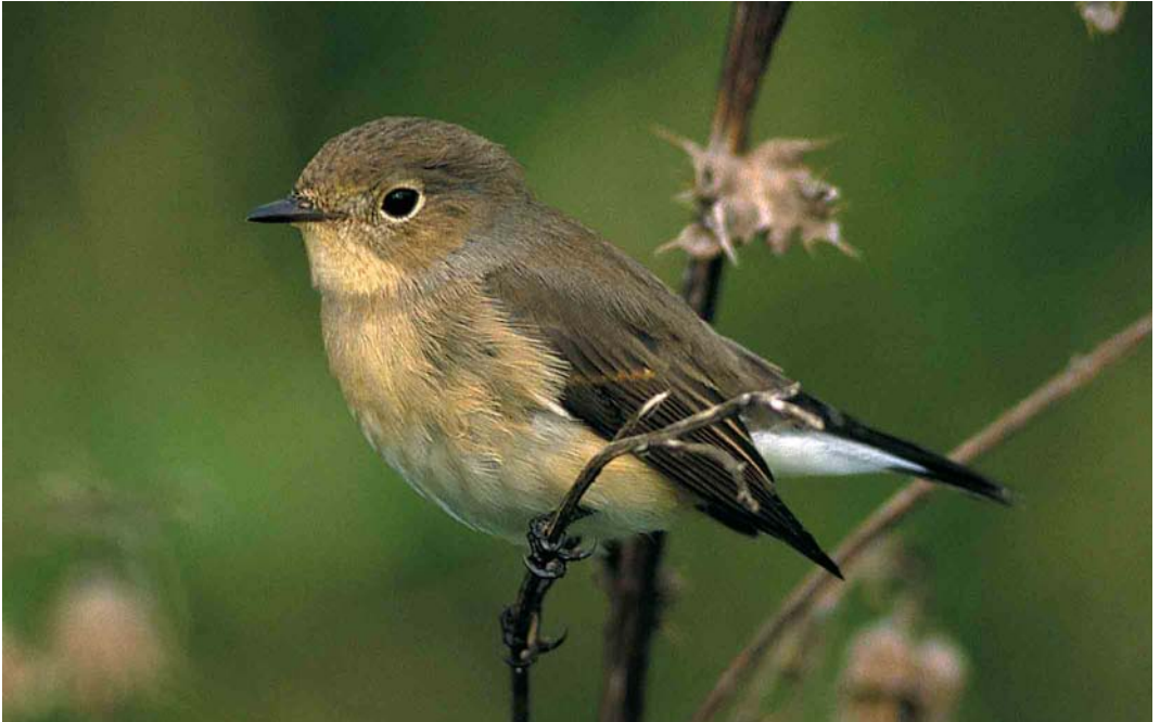
446 Kleine Vliegenvanger / Red-breasted Flycatcher Ficedula parva , eerste-winter, Maasvlakte, Zuid-Holland, 22 september 2001