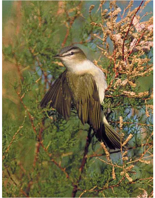
419 Red-eyed Vireo / Roodoogvireo Vireo olivaceus , Schiermonnikoog, Friesland, Netherlands, 13 October 2001 420 Red-eyed Vireo / Roodoogvireo Vireo olivaceus , Ouessant, Finistère, France, 21 October 2001 421 Red-flanked Bluetail / Blauwstaart Tarsiger cyanurus , Blankenberge, West-Vlaanderen, Belgium, 26 September 2001