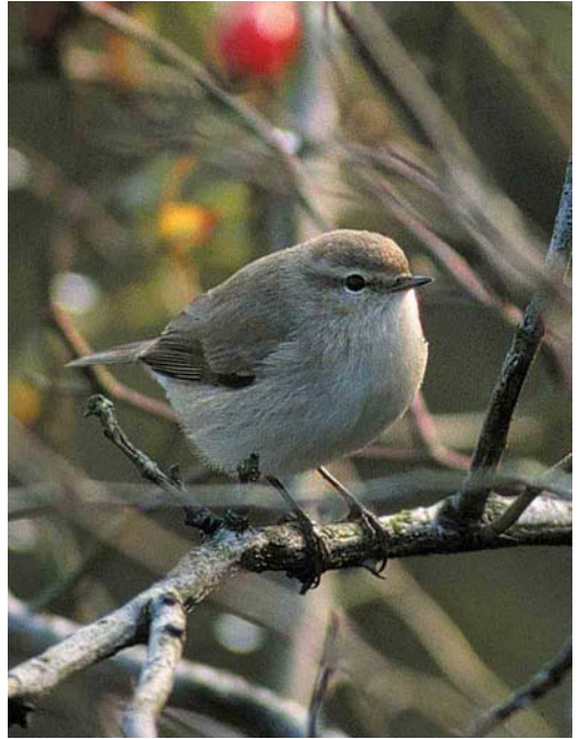
442 Pallas' Boszanger / Pallas's Leaf Warbler Phylloscopus proregulus , Eemshaven, Groningen, 24 oktober 2001 ( Eric Koops ) 443 Siberische Tjiftjaf / Siberian Chiffchaff Phylloscopus collybita tristis , De Bokkedoorns, Bloemendaal, Noord-Holland, 24 oktober 2001 ( Arnoud B van den Berg ) 444 Cetti's Zanger / Cetti's Warbler Cettia cetti , Amsterdamse Waterleidingduinen, Zandvoort, Noord-Holland, 12 oktober 2001 ( Fred J Koning ) 445 Kleine Spotvogel / Booted Warbler Acrocephalus caligatus , Amsterdamse Waterleidingduinen, Zandvoort, Noord-Holland, 21 september 2001 ( Hans Vader )