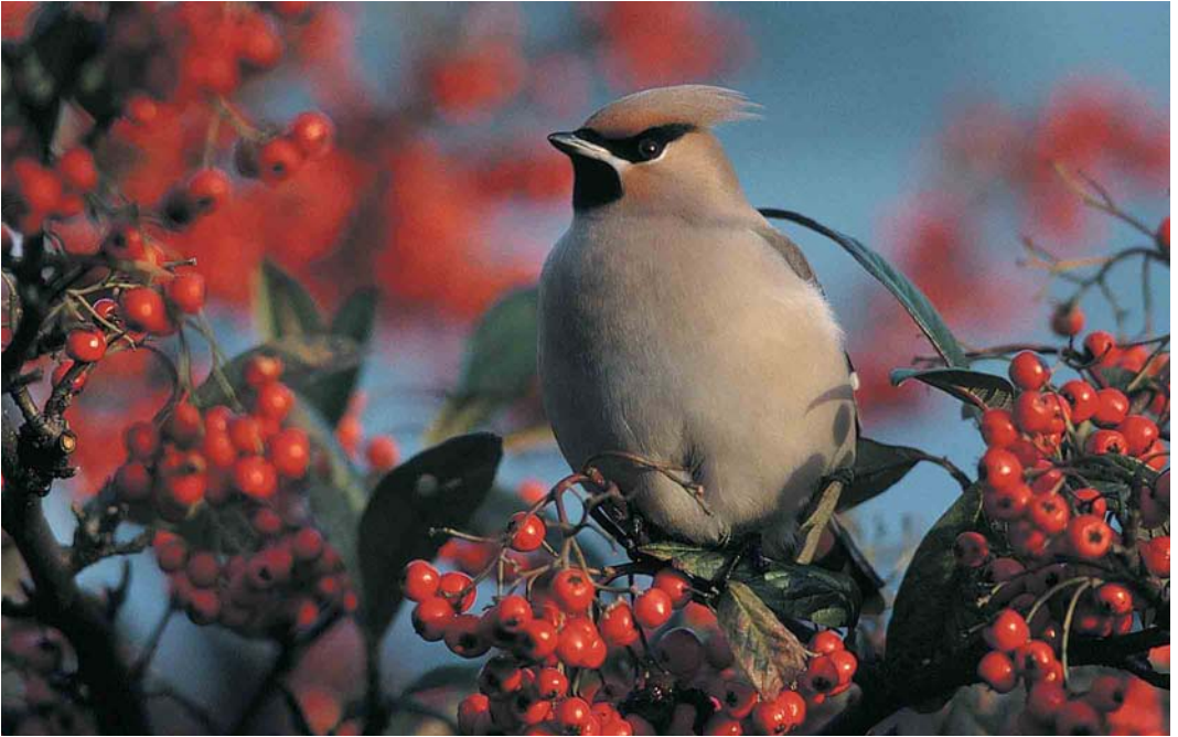
393 Waxwing: beautiful, alluring, seductive and – allegedly – homewrecker (Anthony McGeehan)

problem, but one is needed. Perhaps a wife should draw a map for her husband, showing the whereabouts of everything he might need. The difficulty here is that he would mislay the map and not be able to find it until she returned.