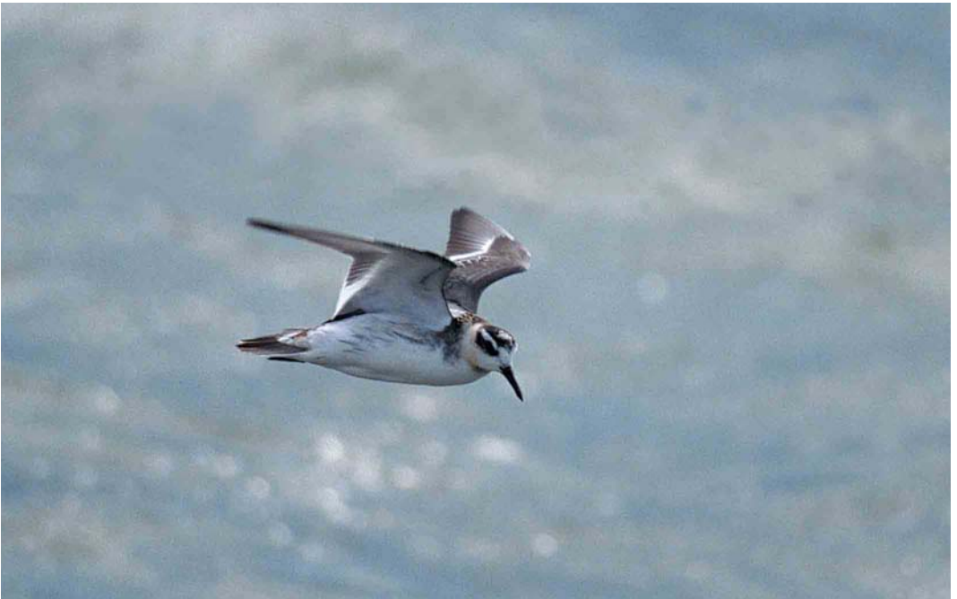
430 Rosse Franjepoot / Red Phalarope Phalaropus fulicaria , juveniel ruiend naar eerste-winter, Brouwersdam, Zeeland, 15 september 2001 (Marten van Dijk)