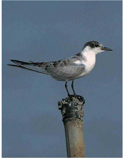
427 Witvleugelstern / White-winged Tern Chlidonias leucopterus , juveniel, Lauwersoog, Groningen, 14 oktober 2001 (Roef Mulder) 428 Witwangstern / Whiskered Tern Chlidonias hybridus , juveniel ruiend naar eerste-winter, Lauwersoog, Groningen, 14 oktober 2001 (Roef Mulder) 429 Vorkstaartmeeuw / Sabine's Gull Larus sabini , adult of tweede-kalenderjaar ruiend naar winterkleed, Brouwersdam, Zeeland, september 2001 (Mars Muusse)