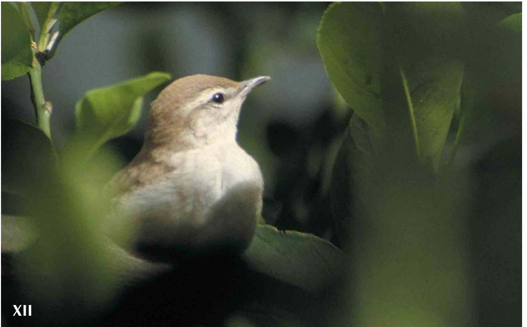
Mystery photograph XII (July)