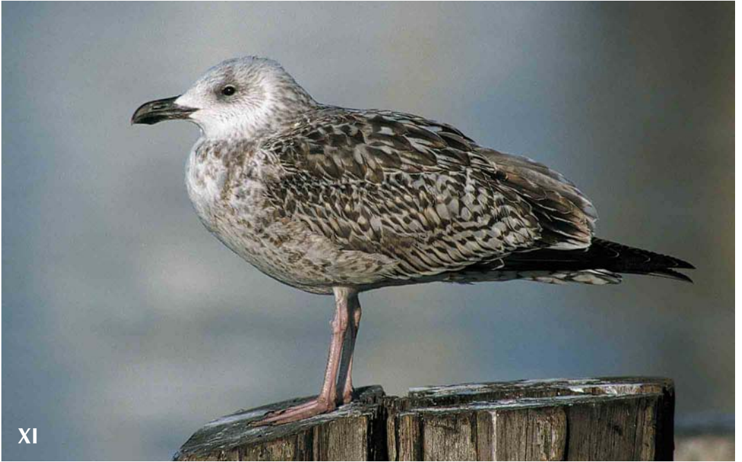
Mystery photograph XI (March)