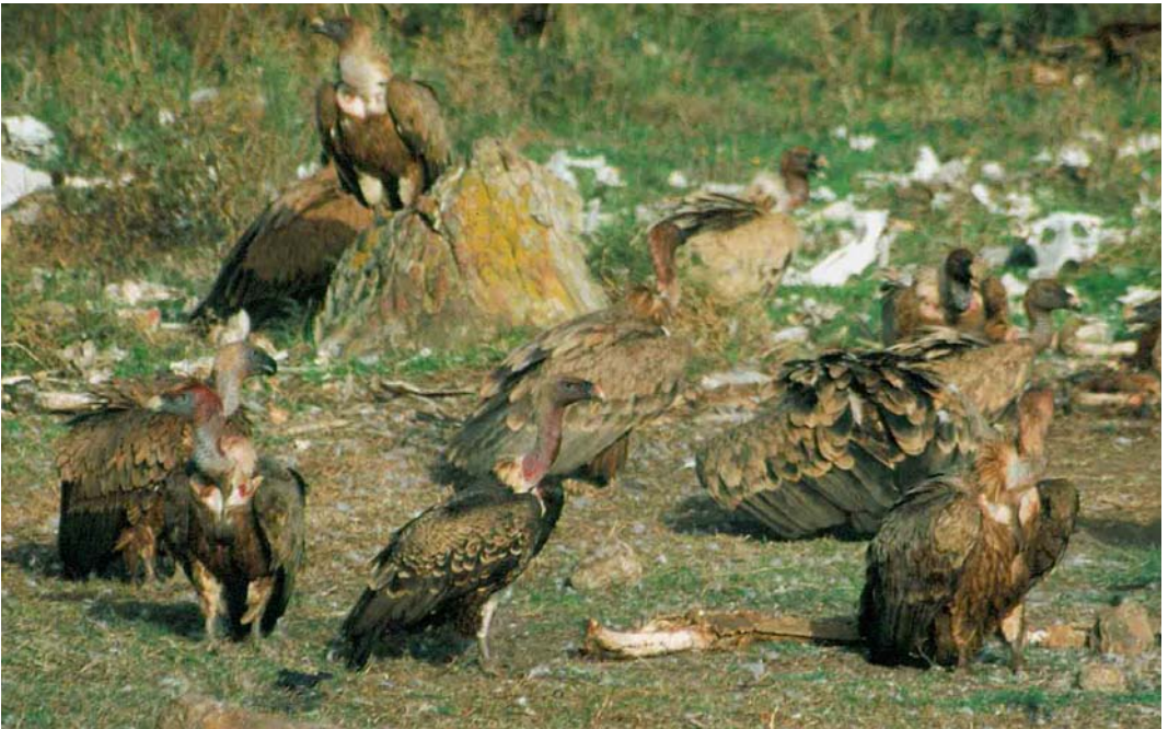
398 Rüppell's Griffon Vulture / Rüppells Gier Gyps rueppellii , immature (front centre), with Eurasian Griffon Vultures / Vale Gieren G fulvus , Tarifa, Spain, October 2001

WADERS The first Oriental Pratincole Glareola maldivarum for Sweden was a second calendar-year moulting from summer to winter plumage at Ängsnäset, Falsterbo, Skåne, from 2 July to 6 October (cf Dutch Birding 23: 224-225, 2001). The third Black-winged Pratincole G nordmanni for France this year was at Loon-Plage, Nord, from 21 August to 20 September and possibly a fourth was at Audighen, Pas-de-Calais, on 25-29 October. From 31 October to at least 1 November, an adult Red-wattled Lapwing Vanellus indicus was present in a flock of Spur-winged Lapwings V spinosus at the largest sewage pond at km 19 in Eilat, Israel. Juvenile Sociable Lapwings V gregarius were at Gülper See, Brandenburg, Germany, on 21 September and in East Sussex, England, from 29 September to 3 October. In the Netherlands, one flew over Houthem, Valkenburg aan de Geul, Limburg, on 7 October. A White-tailed Lapwing V leucurus was at Polgar fishponds, Hungary, on 8 October. On 18 September, an adult Semipalmated Plover Charadrius semipalmatus , a juvenile Semipalmated Sandpiper Calidris pusilla , up to two Pectoral Sandpipers C melanotos and a juvenile Buff-breasted Sandpiper Tryngites subruficollis were seen at Cabo da Praia, Terceira, Azores. On 28-30 September, an adult and two juvenile Semipalmated Plovers were seen here. At the same site, an adult and a juvenile Semipalmated Plover, a flock of 25(!) White-rumped Sandpipers C fuscicollis (mostly adults), two