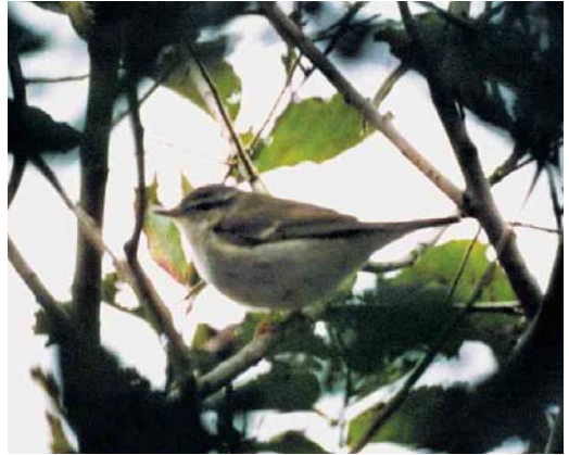
452 Noordse Boszanger / Arctic Warbler Phylloscopus borealis , Petten, Noord-Holland, 29 september 2001 (Jan den Hertog)

Wilgengors te Zeebrugge Op maandag 18 september 2001 deed de oostenwind mij besluiten om na een 'seawatch' met matig succes te Dunkerque, Nord, Frankrijk, samen met Bruno Portier voor het eerst dit najaar naar Zeebrugge, West-Vlaanderen, België, af te zakken. Het werd al snel duidelijk dat er vogels in overvloed zaten, voornamelijk Witte Kwikstaarten Motacilla alba , Roodborsten Erithacus rubecula , Gekraagde Roodstaarten Phoenicurus phoenicurus , Tapuiten Oenanthe oenanthe en Fitissen Phylloscopus trochilus . Op de vlakte links van de kiezelweg vloog plotseling een vrij forse zangvogel met relatief korte staart voor mijn voeten op, ongeveer zo groot als een Rietgors Emberiza schoeniclus en met een zeer opvallende crèmekleurige wenkbrauwstreep. Aanvankelijk twijfelde ik nog tussen een Bobolink Dolichonyx oryzivorus en een Wilgengors E aureola . Nadat ik BP verwittigd had, vloog de vogel een tweede keer op waarbij we opnieuw een brede wenkbrauwstreep zagen en vooral een gele buik. Er was nu geen twijfel meer, dit moest een Wilgengors zijn. Toch plaatste ik hem op de pieper