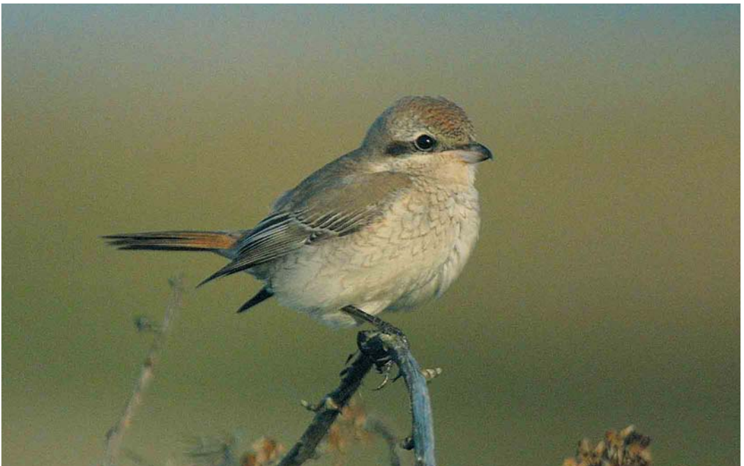
418 Turkestan Shrike / Turkestaanse Klauwier Lanius phoenicuroides , first-winter, Dungeness, Kent, England, October 2001