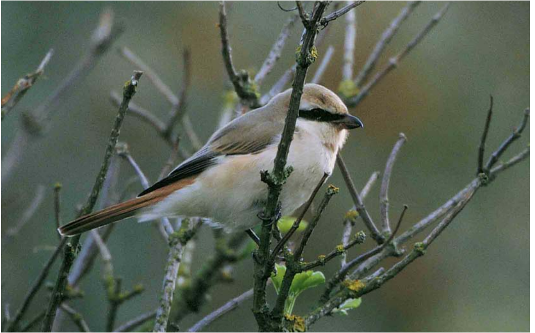
389 Turkestan Shrike / Turkestaanse Klauwier Lanius phoenicuroides , adult male, De Cocksdorp, Texel, Noord-Holland, 2 October 2000 (Jan van Holten)