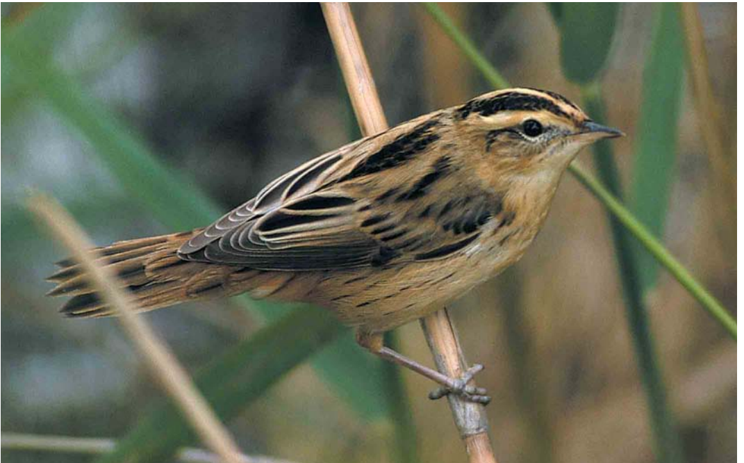
433 Waterrietzanger / Aquatic Warbler Acrocephalus paludicola , eerstejaars, Prunjepolder, Zeeland, 5 augustus 2001