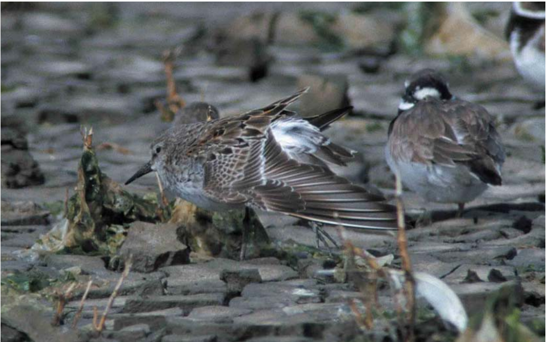
365 White-rumped Sandpiper / Bonapartes Strandloper Calidris fuscicollis , adult summer, Zwarte Haan, Friesland, 20 August 2000