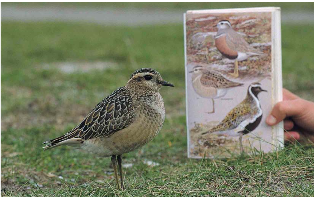
431 Morinelplevieren / Eurasian Dotterels Charadrius morinellus , met Goudplevier / Eurasian Golden Plover Pluvialis apricaria (rechtsonder), Hargen, Noord-Holland, 30 september 2001 (Roef Mulder)