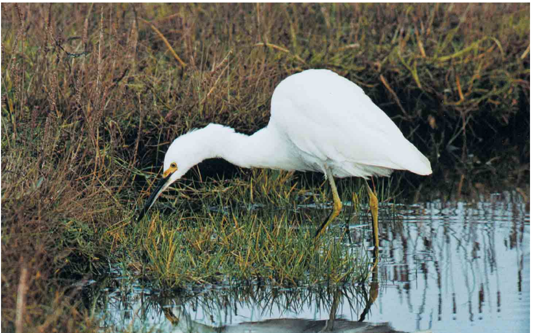
397 Snowy Egret / Amerikaanse Kleine Zilverreiger Egretta thula , first-winter, Balvicar, Seil Island, Argyll, Scotland, November 2001