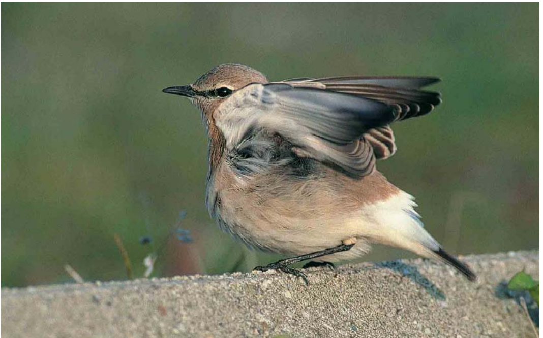
378 Izabeltapuit / Isabelline Wheater Oenanthe isabellina , IJmuiden, Noord-Holland, 23 September 2000 (Marten van Dijl)