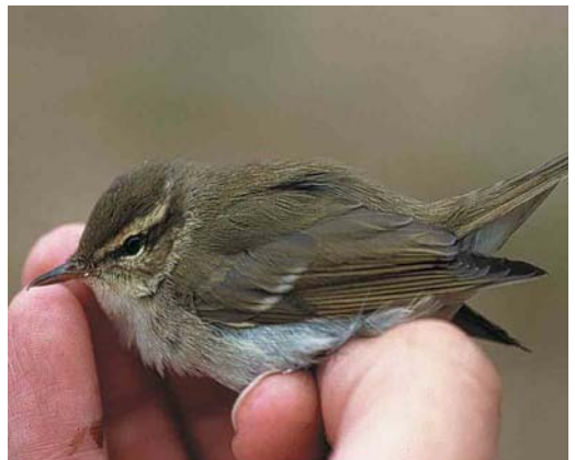
379 Pied Wheatear / Bonte Tapuit Oenanthe pleschanka , male, Formerum, Terschelling, Friesland, 27 June 2000 380 Black-throated Thrush / Zwartkeellijster Turdus ruficollis atrogularis , first-winter female, Groningen, Groningen, November 2000 381 Subalpine Warbler / Baardgrasmus Sylvia cantillans , male, Vlieland, Friesland, 7 May 2000 382 Zitting Cisticola / Graszanger Cisticola juncidis , Loozerheide, Weert, Limburg, 9 September 2000 383 Hume's Leaf Warbler / Humes Bladkoning Phylloscopus humei , Oudemirdum, Friesland, November 1999 384 Arctic Warbler / Noordse Boszanger Phylloscopus borealis , first-year, Vlieland, Friesland, 1 September 1998