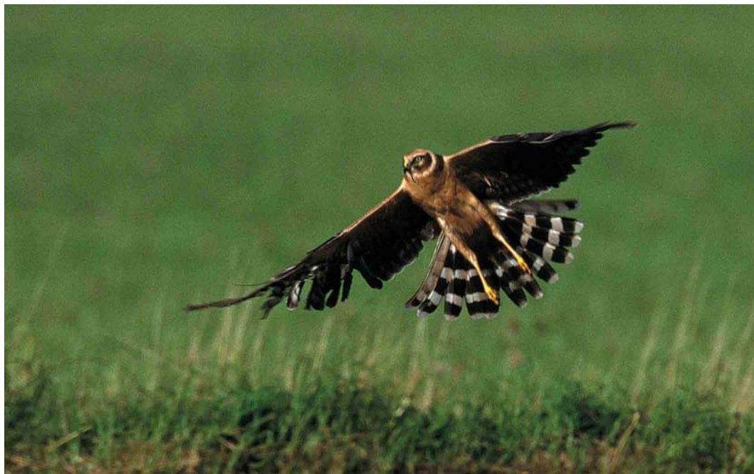
395 Pallid Harrier / Steppekiekendief Circus macrourus , juvenile male, Öland, Sweden, 14 September 2001

Argyll, Scotland, on 27 October. A first-year female Surf Scoter Melanitta perspicillata was found dead at Cap Ferret, Gironde, France, on 6 October. In Denmark, single adult males were watched at Thisted, Nordjylland, on 11 October and up to two were at Grønningen, Esbjerg, Vestjylland, on 19-21 October. An adult female Blue-winged Teal Anas discors was at Sidi Bou Rhaba, Morocco, in the third week of September. In the Azores, females or first-winters were seen on Flores (one on 30-31 October), Terceira (one on 28 October) and at Lagoa Azul, São Miguel (two on 1-3 November). On Flores, Azores, 13 American Black Ducks A rubripes , including a number of hybrids, were seen at Lagoa Seca (or Lagoa Branca) during October. Several long-staying males remained into late October in south-western Iceland (since 1993), at Barrow Harbour, Kerry, Ireland, and in Cornwall (two singles) and Devon, England. Three Marbled Ducks Marmaronetta angustirostris were at Bagnas, Hérault, France, on 7 September. As usual in such cases, the origin of two at Minsmere, Suffolk, England, on 13-16 October was much debated. At Pantano Leone in western Sicily, the species' only breeding site in Italy (one or two pairs since 1999), three were present until at least 20 October.