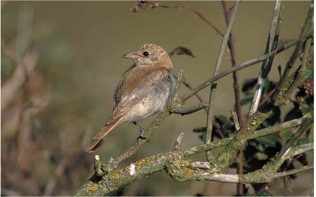
391 Woodchat Shrike / Roodkopklauwier Lanius senator , first-winter, De Nederlanden, Texel, Noord-Holland, 3 October 2000