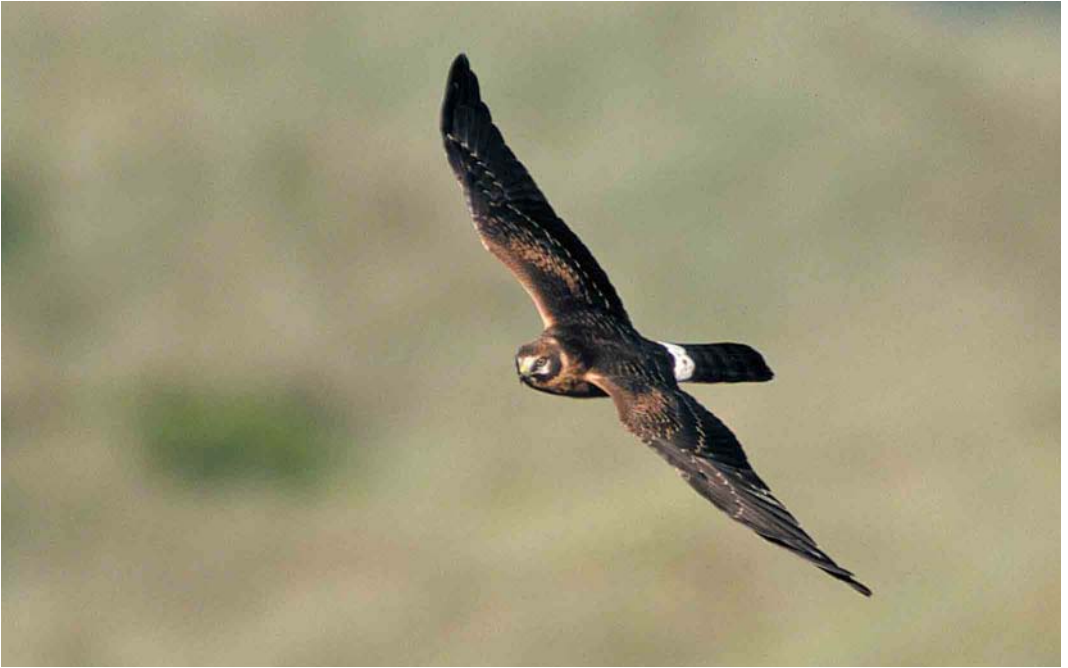
422 Steppekiekendief / Pallid Harrier Circus macrourus , juveniel mannetje, Vlieland, Friesland, 30 september 2001 (Roef Mulder)