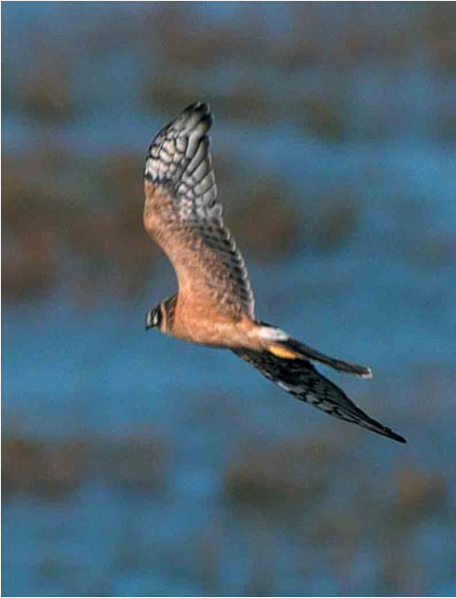
425 Steppekiekendief / Pallid Harrier Circus macrourus , juveniel mannetje, Vlieland, Friesland, 30 september 2001