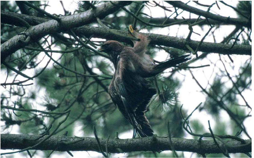
361 Booted Eagle / Dwergarend Hieraetus pennatus , juvenile, dark morph, Vlieland, Friesland, 14 October 2000 362 Booted Eagle / Dwergarend Hieraetus pennatus , juvenile, dark morph, Hoge Veluwe, Gelderland, 24 October 2000. Same bird as in plate 361, before release 363 Black-winged Kite / Grijze Wouw Elanus caeruleus , adult, Meerstalbok, Drenthe, 28 July 2000