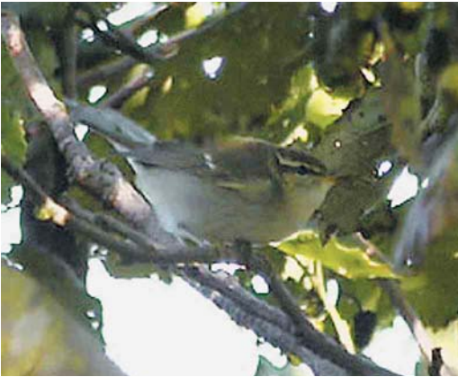
451 Noordse Boszanger / Arctic Warbler Phylloscopus borealis , Petten, Noord-Holland, 30 september 2001

Deze Noordse Boszanger betreft – wanneer de drie exemplaren die dit najaar werden gevangen op 13 september op Schiermonnikoog, Friesland, en op 17 en 20 september op Vlieland, Friesland, alle worden aanvaard – het 16e geval voor Nederland en pas de tweede veldwaarneming (de enige andere veldwaarneming was op de Maasvlakte, Zuid-Holland, op 28 september 1997). Alle andere gevallen betroffen eendags-vogels. RUUD E BROUWER