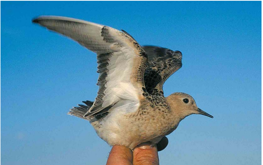
456 Blonde Ruiters / Buff-breasted Sandpiper Tryngites subruficollis , juveniel, Opmeer, Noord-Holland, 5 oktober 2001

Eerste vangst van Blonde Ruiters in Nederland Op 5 oktober 2001 werd ik door Arie Slijkerman gebeld; hij had tijdens het wilsterflappen in een weiland bij Opmeer, Noord-Holland, een steltloper gevangen die hij niet direct kon thuisbrengen. De vogel vloog samen met enkele Kieviten Vanellus vanellus . Opvallend waren de ronde, relatief kleine kop zonder wenkbrauwstreep en de warm bruingele ongestreepte zijkop, borst, keel en nek. Een vleugelstreep ontbrak en de vogel vertoonde ook geen opvallende witte zijden aan stuit en bovenstaart. De snavel was kort, dun en vrijwel recht. De onderkant van de vleugels was witachtig met een opvallend donkere polsvlek en een fijn gespikkelde donkere vleugelboeg. Met deze kenmerken werd duidelijk dat AS een Blonde Ruiters Tryngites subruficollis in zijn netten had gekregen. Bij Blonde Ruiters vormt de bovengenoemde sterk contrasterende tekening op de ondervleugel een belangrijke rol tijdens de balts, waarbij de mannetjes met uitgespreide vleugels de onderkant van hun vleugels tonen.