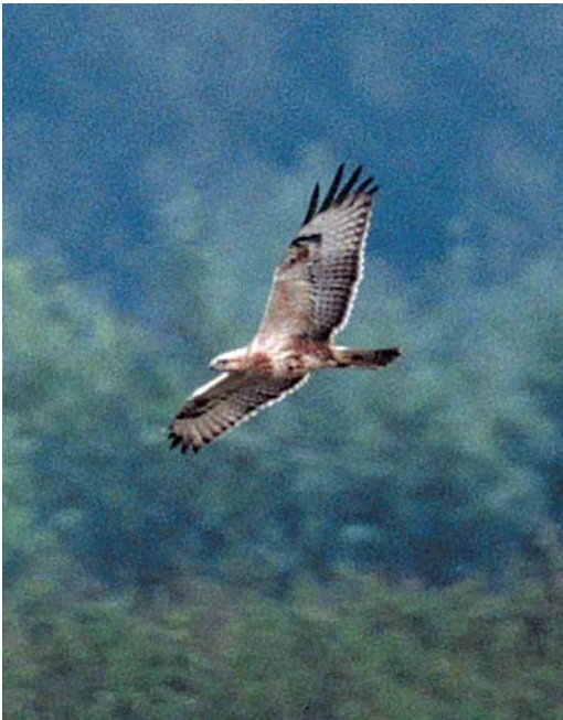
359 Long-legged Buzzard / Arendbuizerd Buteo rufinus , juvenile, Praamweg, Flevoland, 9 September 2000

and Tzummarum, Franekeradeel , Friesland; 25-26 July, Den Oever, Wieringen , Noord-Holland; 26 July, Wieringermeer , Noord-Holland, and Camperduin, Bergen , Noord-Holland; 29 July, Bloemendaal aan Zee, Bloemendaal , Noord-Holland; 29-30 July, IJmuiden, Velsen , Noord-Holland; 30 July to 4 August, Texel , Noord-Holland; 5 August, Vlieland , Friesland; 5-9 August, De Boschplaat, Terschelling , Friesland; 9-11 August, Ameland , Friesland; 11 August, Terschelling , Friesland; 11-12 August, Vlieland , Friesland; 12 August, Texel , Het Zwanenwater and Petten, Zijpe , and Castrium , Noord-Holland; 13 August, Katwijk aan Zee, Katwijk , Meyendel, Wassenaar , Den Haag , Monster and Hoek van Holland, Rotterdam , Zuid-Holland; and 13-18 August, Maasvlakte, Rotterdam , Zuid-Holland, second- or third-year, photographed, videoed (J Feddema, A B van den Berg, R J J Vlek et al; van den Berg & Feddema 2000; Birding World 13: 268, 311, 314, 2000, Dutch Birding 22: 186, plate 163, 236, plate 230, 241, plates 236-237, 2000).