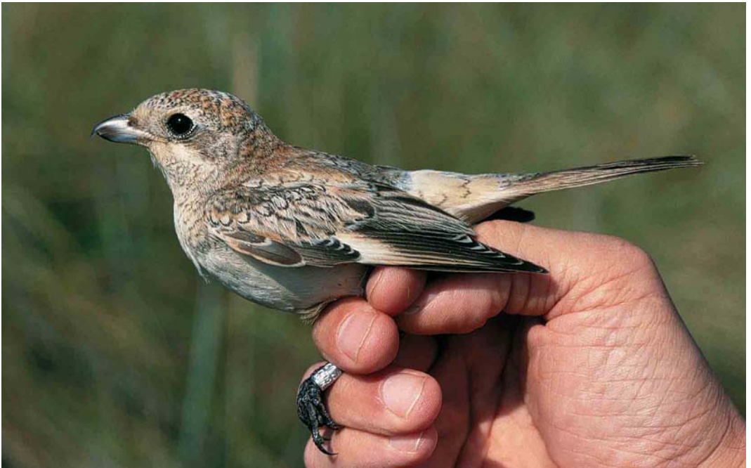
392 Woodchat Shrike / Roodkopklauwier Lanius senator , juvenile, Castricum, Noord-Holland, 20 August 2000 (Arnold Wijker)