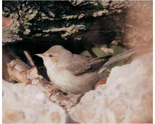
449 Sperwergrasmus / Barred Warbler Sylvia nisoria , eerstejaars, Zeebrugge, West-Vlaanderen, 19 september 2001