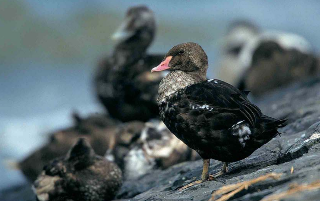
355 King Eider / Koningseider Somateria spectabilis , second calendar-year male, Oudeschild, Texel, Noord-Holland, 3 September 2000 ( Jan van Holten )