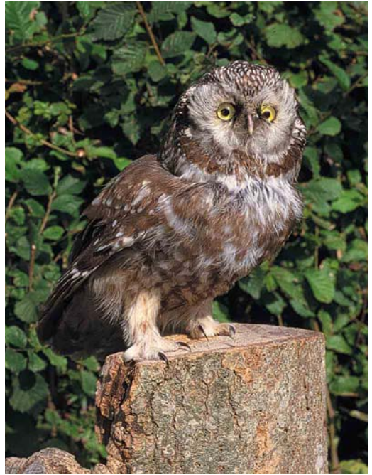
372 White-tailed Lapwing / Witstaartkievit Vanellus leucurus , adult, Polder Maltha, Werkendam, Noord-Brabant, 9 August 2000 ( René van Rossum ) 373 Tengmalm's Owl / Ruigpootuil Aegolius funereus (found dead on Schiermonnikoog, Friesland, on 1 February 2000), Schiermonnikoog, Friesland, 1 August 2000 ( André J van Loon ) 374 Buff-breasted Sandpiper / Blonde Ruiters Tryngites subruficollis , juvenile, Maasvlakte, Zuid-Holland, 25 September 2000 ( Marten van Dijl )