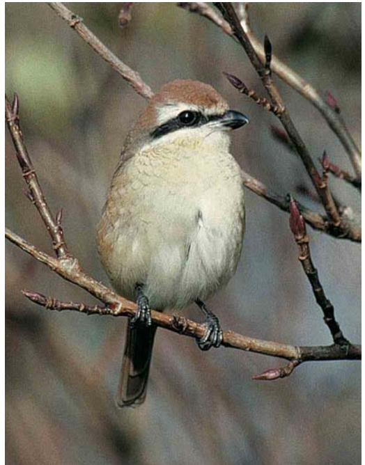
416-417 Brown Shrike / Bruine Klauwier Lanius cristatus , probably adult female, Helgoland, Schleswig-Holstein, Germany, 15 October 2001 (Thomas Sacher)