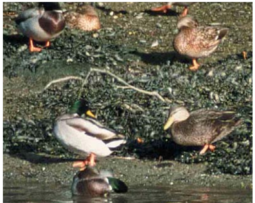
404 Rough-legged Buzzard / Ruigpootbuizerd Buteo lagopus , juvenile, Porto Pim, Faial, Azores, October 2001 (Mark Bolton) 405 Long-legged Buzzard / Arendbuizerd Buteo rufinus , second calendar-year, Noerdlinger Ries, Bavaria, Germany, 7 September 2001 (Markus Röhnild) 406 Semipalmated Plover / Amerikaanse Bontbekplevier Charadrius semipalmatus , juvenile, Cabo da Praia, Terceira, Azores, 28 September 2001 (Mark Bolton) 407 Green Heron / Groene Reiger Butorides virescens , first-winter, Messingham Sand Quarry, Lincolnshire, England, September 2001 (Steve Blain) 408 Belted Kingfisher / Bandijsvogel Ceryle alcyon , Porto Pim, Faial, Azores, October 2001 (Mark Bolton) 409 Black Duck / Zwarte Eend Anas rubripes , adult male (lower right), with Mallards / Wilde Eenden A platyrhynchos , Bowcombe Creek, Devon, England, October 2001 (Laurens B Steijn)