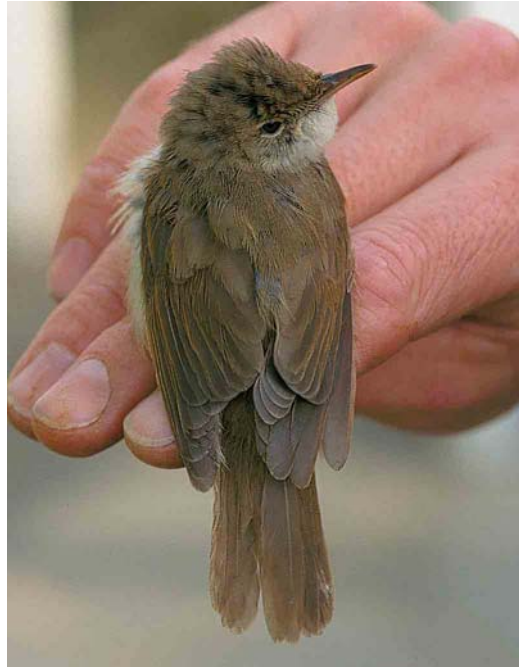
457-458 Struikrietzanger / Blyth's Reed Warbler Acrocephalus dumetorum , eerste-winter, Kennemerduinen, Noord-Holland, 17 oktober 2001

Tussenbroek. De volgende maten werden genoteerd: vleugellengte 64 mm, staartlengte 52 mm, snavelpunt tot schedel 17.7 mm, snavelbreedte (ter hoogte van achterrand van neusgat) 4.7 mm, versmalling van binnenvlag ('notch') van p2 18.5 mm (handpennen van buiten naar binnen genummerd), gewicht 10.2 g en vetgraad 0. Verder hadden alleen p3 en p4 een duidelijke versmalling van de buitenvlag. De tenen en nagels waren korter en kleiner dan bij een Kleine Karekiet of Bosrietzanger A palustris . De vogel werd op basis van deze gegevens en de afwijkende 'strogrijze' kleur door de aanwezigheid als valse spotvogel A (pallidus) elaeicus/opacus gedetermineerd, waarna hij opnieuw werd gemeten en gefotografeerd door CvD. Na een vergeefse poging om Arnoud van den Berg te waarschuwen werd de vogel weer losgelaten. De volgende dagen kwamen de foto's van CvD onder ogen van achtereenvolgens AvdB, André van Loon en Lars Svensson. Bij pogingen om de vogel op naam te brengen werd Struikrietzanger aanvankelijk buiten beschouwing gelaten omdat de versmalling van de binnenvlag van p2 te lang was (deze zou maximaal 14 mm mogen zijn; LS heeft ooit 15.5 mm gemeten). Vanwege de vleugellengte en het aantal handpenversmallingen was ook duidelijk dat het geen afwijkend getinte 'gewone' Acrocephalus -soort kon zijn. Afgezien van het ontbreken van een buitenvlagversmalling van p5 kwam de biometrie redelijk overeen met valse spotvogel. De foto's lieten echter