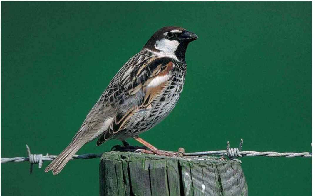
390 Spanish Sparrow / Spaanse Mus Passer hispaniolensis , adult male, Camperduin, Noord-Holland, 13 May 2000