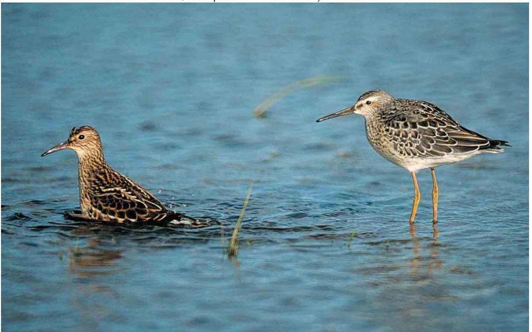
403 Stilt Sandpiper / Steltstrandloper Micropalama himantopus , juvenile moulting to first-winter (right), and Pectoral Sandpiper / Gestreepte Strandloper Calidris melanotos , juvenile, Lough Beg, Londonderry, Northern Ireland, 16 September 2001 (Anthony McGeehan)