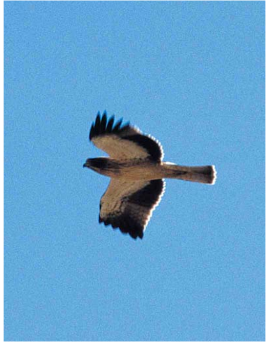
426 Dwergarend / Booted Eagle Hieraetus pennatus , juveniel, lichte vorm, Groene Pollen, Terschelling, Friesland, 30 september 2000

en op 12 oktober bij de Bandpolder. Een Steppekievit Vanellus gregarius vloog op 7 oktober over bij Houthem, Limburg. Bonapartes Strandlopers Calidris fuscicollis bleven gezien worden in het Lauwersmeergebied: tot 13 september één in de Ezumakeeg, Friesland, op 5 september twee aldaar en op 4 september mogelijk weer een andere aan de oostkant van de Lauwersmeer, Groningen, en op 4 en 5 november (weer) één – ditmaal een juveniel – bij het Jaap Deensgat in de het Groningse deel. Een Bairds Strandloper C bairdii werd gemeld op 22 september kort ter plaatse op de Maasvlakte. Gestreepte Strandlopers C melanotos verbleven tot 6 september in de Ezumakeeg, op 2 september bij Alkmaar, Noord-Holland, op 12 september in het Oude Robbengat in de Lauwersmeer, en op 16 september bij Ulrum, Groningen. Het exemplaar dat in de voorgaande periode in de Ezumakeeg als juveniele werd gemeld, blijkt toch een adulte te zijn geweest. Op 2 september werd een Blonde Ruiter Tryngites subruficollis ontdekt bij Paesens, Friesland, en later die dag verscheen deze vogel in de Ezumakeeg. Daarnaast was er een melding van deze soort op 30 september bij Petten. Op 5 oktober werd er één gevangen en geringd bij Opmeer, Noord-Holland. Langsvliegende Poelsnippen Gallinago media werden gezien op 29 september op Vlieland en op 2 oktober op Texel. De Grote Grije Snip Limnodromus scolopaceus verscheen tussen 8 en 10 september weer op