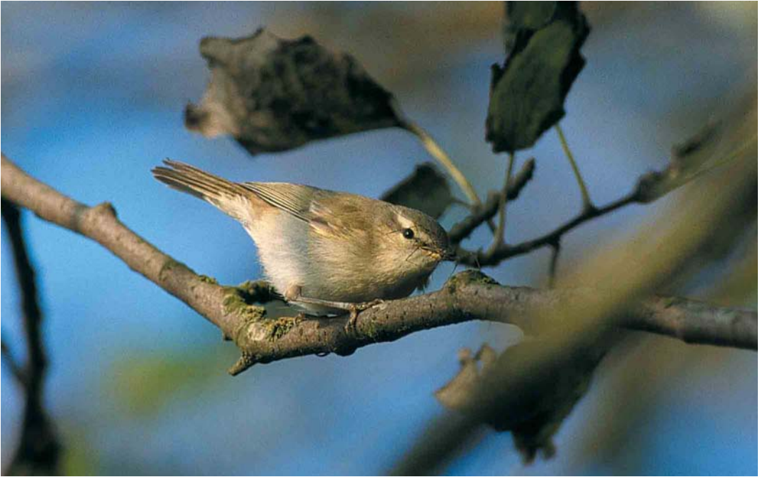
432 Grauwe Fitis / Greenish Warbler Phylloscopus trochiloides , Lauwersoog, Groningen, 23 september 2001