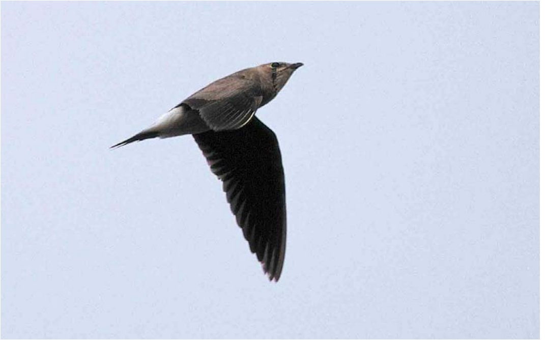
400-401 Oriental Pratincole / Oosterse Vorkstaartplevier Glareola maldivarum , second calendar-year, Falsterbo, Skåne, Sweden, 21 September 2001 (Arie Ouwerkerk)