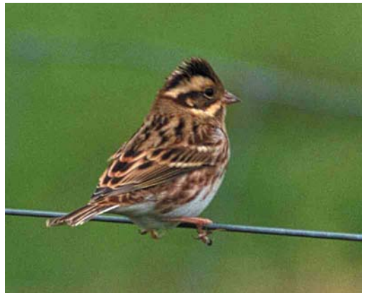
366 White-tailed Lapwing / Witstaartkievit Vanellus leucurus , adult, Polder Maltha, Werkendam, Noord-Brabant, 9 August 2000 ( Arie Ouwerkerk ) 367 Alpine Swift / Alpengierzwaluw Apus melba , Zoetermeer, Zuid-Holland, 17 April 2000 ( Wesley Overman ) 368 Broad-billed Sandpiper / Breedbekstrandloper Limicola falcinellus , adult summer, Den Oever, Noord-Holland, 5 May 2000 ( Daniel Benders ) 369 Laughing Gull / Lachmeeuw Larus atricilla , adult, Arnhem, Gelderland, August 2000 ( Teus J.C. Luijendijk ) 370 Citrine Wagtail / Citroenkwikstaart Motacilla cinerea , adult male, Jaap Deensgat, Lauwersmeer, Groningen, 9 May 1999 ( Roef Mulder ) 371 Rustic Bunting / Bosgors Emberiza rustica , Oosterend, Terschelling, 5 October 2000 ( Arie Ouwerkerk )