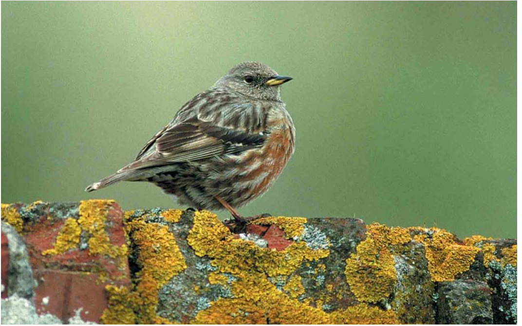
375 Alpine Accentor / Alpenheggenmus Prunella collaris , first-summer, Terschelling, Friesland, 3 May 2000