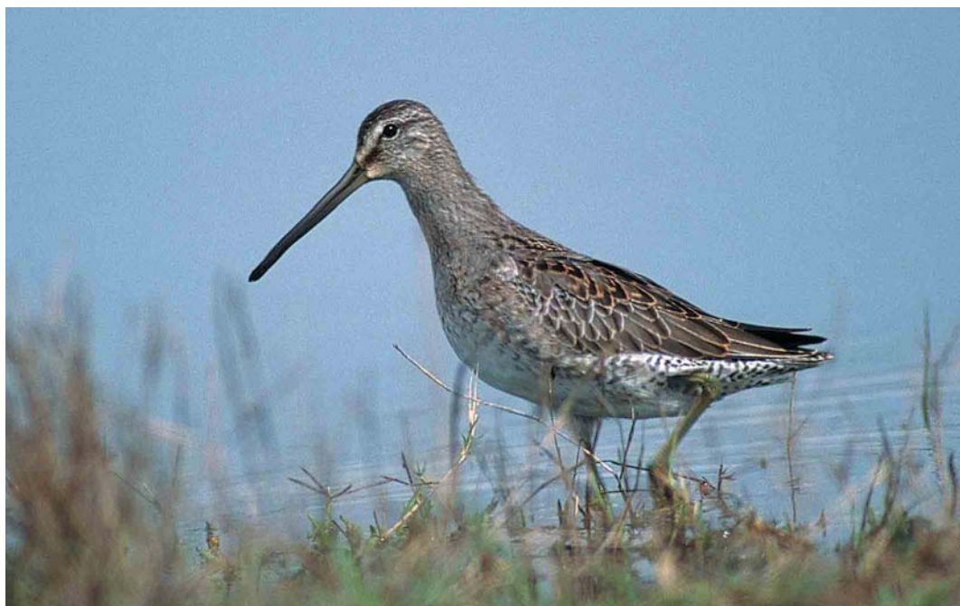
399 Long-billed Dowitcher / Grote Griijze Snip Limnodromus scolopaceus , juvenile, Pêra marsh, Algarve, Portugal, October 2001 (Ray Tipper)