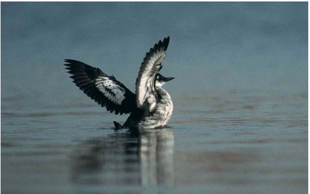
448 Zwarte Zeekoet / Black Guillemot Cephus grylle , eerste-winter, Oostende, West-Vlaanderen, 27 september 2001 (Peter Boesman)

soorten weinig overeenkomst tussen de tellingen van Oostende en De Panne. Van de 38 Vorkstaartmeeuwen Larus sabini vlogen er 33 langs Oostende met maximaal 10 op 16 september. Vooral de pleisterende adulte vogel in zomerkleed op 10 september kreeg bijzondere waardering. De eerste Pontische Meeuwen L cachinnans cachinnans doken op te Pommeroeul, Hainaut (een adulte en een eerste-zomer tot 23 september); en te Heist (een eerste-winter op 20 oktober). Op 16 september trok een adulte Grote Burgemeester L hyperboreus langs Oostende en het vaste overwinterende exemplaar keerde vanaf 25 september voor de vijfde opeenvolgende winter terug naar de haven van Oostende. Op 27 oktober was daar bovendien een eerstejaars aanwezig. Op 4 september trok een Lachstern Gelochelidon nilotica langs De Panne. Een adulte Reuzenster Sterna caspia werd op 1 september gezien op de Werf van het Kluisendok bij Gent en op 12 oktober trokken er twee over de Spuikom van Oostende. Op 22 september werd in de Voorhaven van Zeebrugge een juveniele Witvleugelstern Chlidonias leucopterus geringd. Op 15 september werd te Oostende een adulte Zwarte Zeekoet Cephus grylle in zomerkleed ontdekt. De vogel foerageerde later op de dag tussen Oostende en De Haan, West-Vlaanderen, en trok daarna verder in zuidwestelijke richting. Het betreft het eerste twitchbare geval voor België. Minder dan een week later, op 20 september,