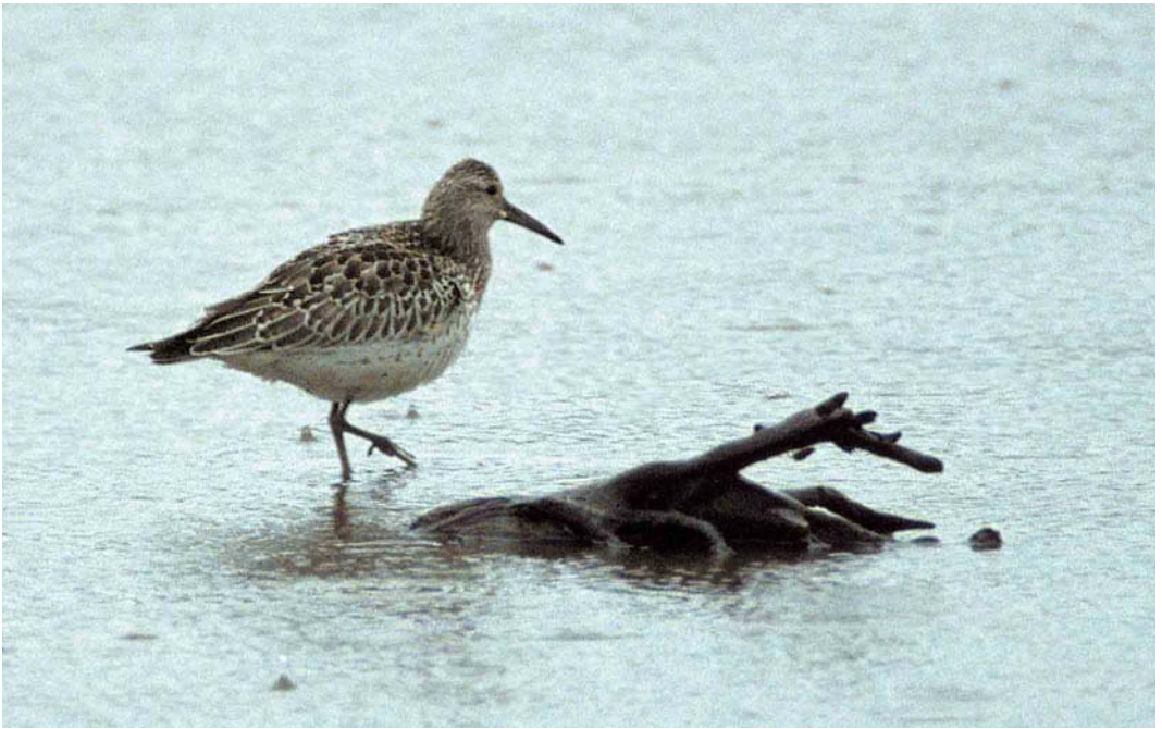
402 Great Knot / Grote Kanoet Calidris tenuirostris , juvenile, Turawski reservoir, Silesia, Poland, September 2001 (Tadeusz Stawarczyk)