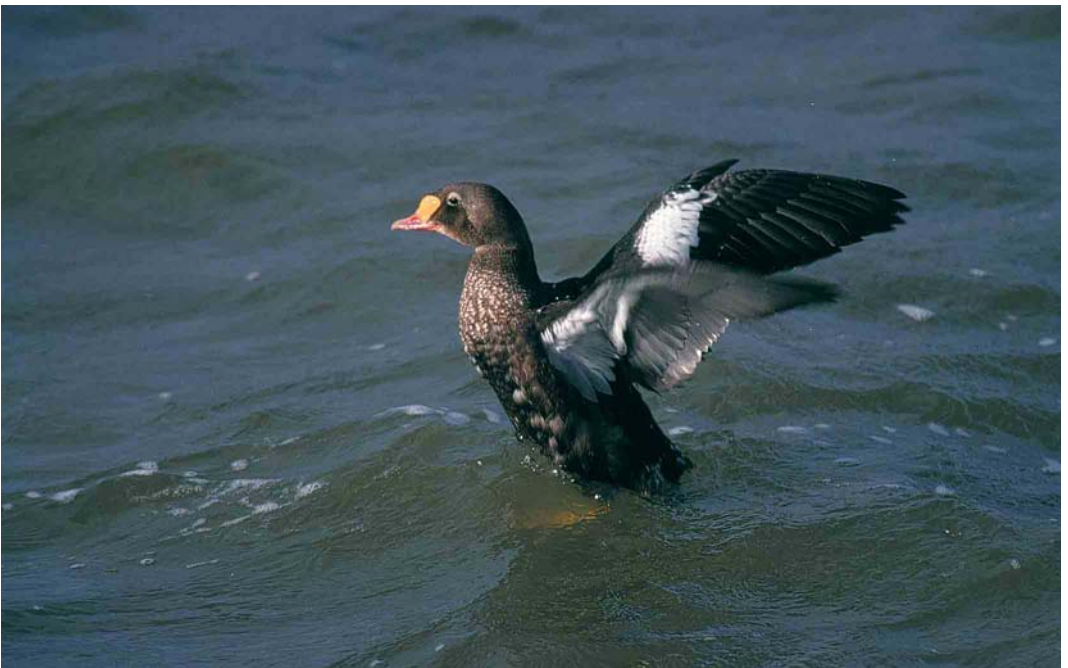
356 King Eider / Koningseider Somateria spectabilis , adult male eclipse, Oudeschild, Texel, Noord-Holland, 3 October 2000