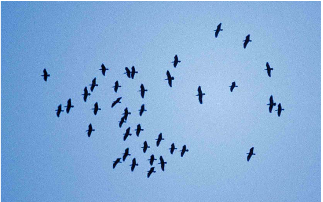
396 Northern Bald Ibises / Kaalkopibissen Geronticus eremita , flock of 38, Tamri, Morocco, 20 September 2001