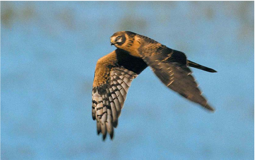
423 Steppekiekendief / Pallid Harrier Circus macrourus , juveniel mannetje, Vlieland, Friesland, 30 september 2001