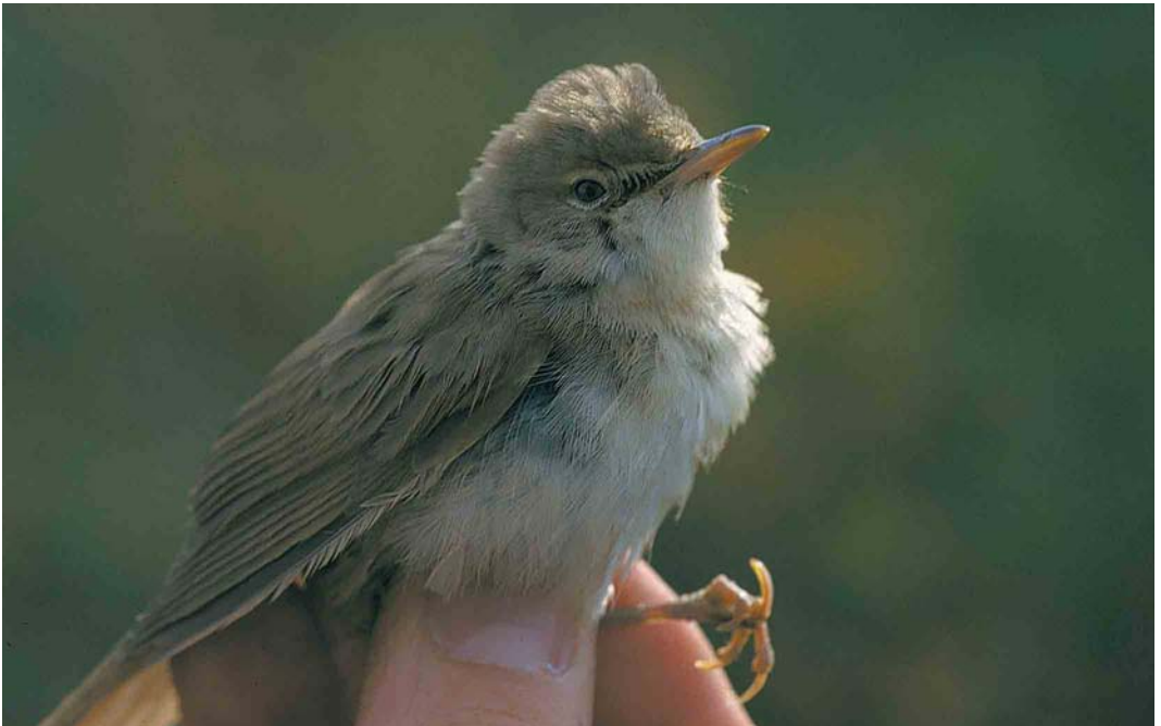
459 Struikrietzanger / Blyth's Reed Warbler Acrocephalus dumetorum , eerste-winter, Kennemerduinen, Noord-Holland, 17 oktober 2001

kenmerken zien die niet bij een valse spotvogel zijn te verwachten: een egale bovenzijde zonder contrasterende donkere tertialcentra, geen lichte baan ('paneel') op de gesloten armvleugel, geen lichte randen aan buitenste staartpennen en een iris die duidelijk lichter was dan de pupil; bovendien had RG gezien dat de staart rond was. Al deze kenmerken pasten wel op Struikrietzanger; de ondiepe versmallingen en ongesleten handpennen duiden op een eerste-kalenderjaar. AvL en LS achtten het zeer wel mogelijk dat de voor Struikrietzanger te lange versmalling van de binnenvlag van p2 betrekking had op een afleesfout. Indien aanvaard, betrof dit het vierde geval van Struikrietzanger voor Nederland en het eerste in het najaar. Eerder dit najaar werden tussen 22 september en 13 oktober acht vangsten bekend van Schotland en Wales. RIENK GEENE, CHRIS VAN DEURSEN & ARNOUD VAN DEN BERG