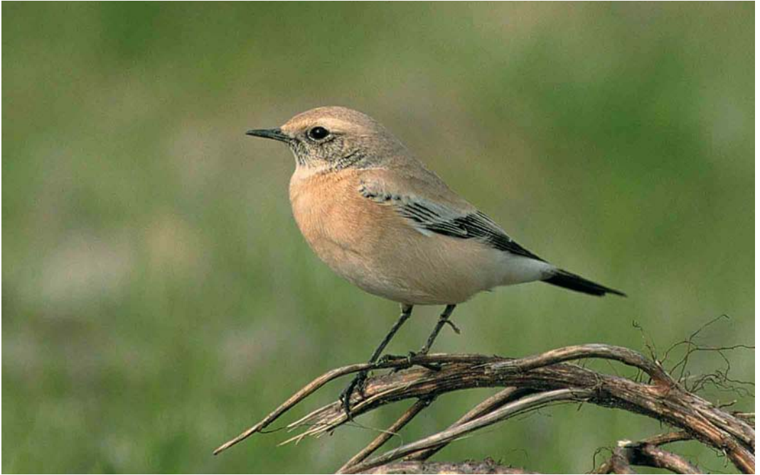
434 Woestijntapuit / Desert Wheatear Oenanthe deserti , eerste-winter mannetje, Eemshaven, Groningen, 13 oktober 2001