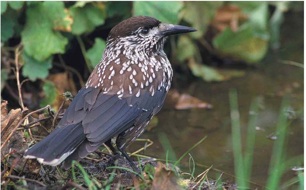
447 Notenkraker / Spotted Nuthatch Nucifraga caryocatactes , Zuidhorn, Groningen, 27 oktober 2001