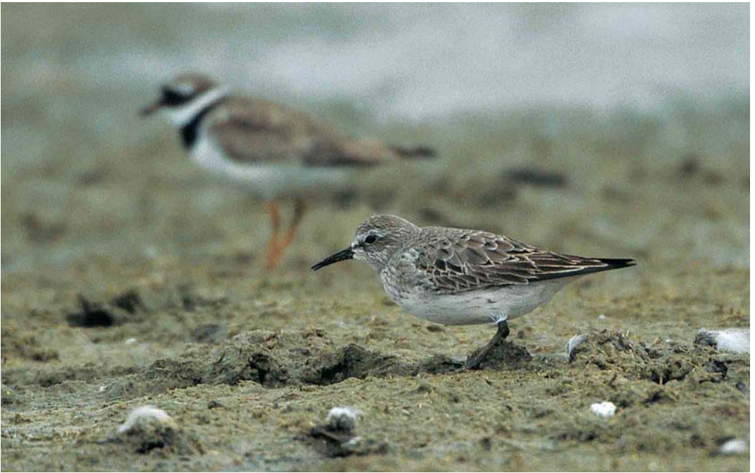
364 White-rumped Sandpiper / Bonapartes Strandloper Calidris fuscicollis , adult summer moulting to winter plumage, Pompevlak, De Geul, Texel, Noord-Holland, 3 September 2000