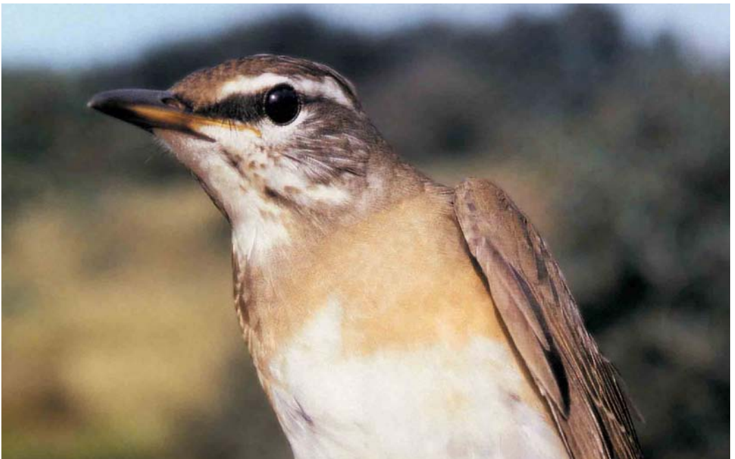
435 Vale Lijster / Eyebrowed Thrush Turdus obscurus , eerste-winter, Oranjezon, Walcheren, Zeeland, 25 september 2001 ( Adri Joosse )