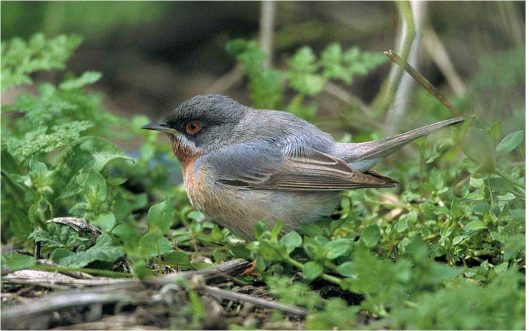
377 Subalpine Warbler / Bardgrasmus Sylvia cantillans , first-summer male, Maasvlakte, Zuid-Holland, 30 April 2000 (Jan van Holten)