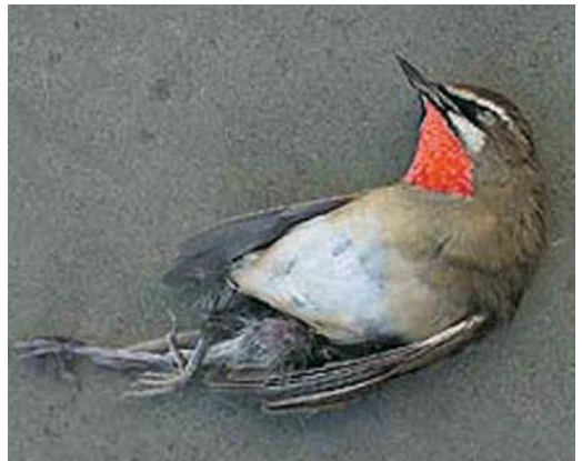
410 Bobolink / Bobolink Dolichonyx oryzivorus , Prawle Point, Devon, England, 11 October 2001 ( Laurens B Steijn ) 411 Subalpine Warbler / Beardgrasmus Sylvia cantillans , first-winter, St Mary's, Scilly, England, October 2001 ( Steve Young/Birdwatch ) 412 Thick-billed Warbler / Diksnavelrietzanger Acrocephalus aedon , first-winter, Out Skerries, Shetland, Scotland, 14 September 2001 ( Roger Riddington ) 413 Paddyfield Warbler / Veldrietzanger Acrocephalus agricola , St Mary's, Scilly, England, October 2001 ( Steve Young/Birdwatch ) 414 Yellow-breasted Bunting / Wilgengors Emberiza aureola , juvenile, St Agnes, Scilly, England, October 2001 ( Steve Young/Birdwatch ) 415 Siberian Rubythroat / Roodkeelnachttegaal Luscinia calliope , male, Hulma Lees, Mainland Shetland, Scotland, 25 October 2001 ( John Coutts )