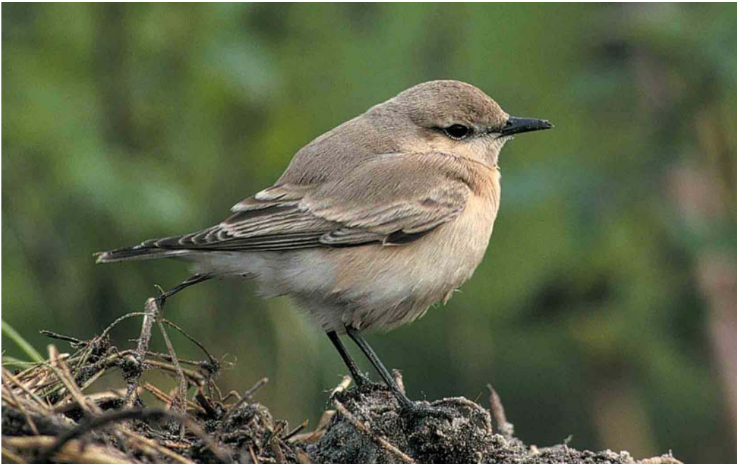
376 Isabelline Wheatear / Izabeltapuit Oenanthe isabellina , first-year, Schiermonnikoog, Friesland, 16 October 2000