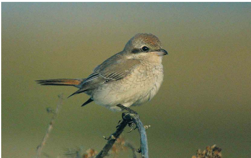
418 Turkestan Shrike / Turkestaanse Klauwier Lanius phoenicuroides , first-winter, Dungeness, Kent, England, October 2001 (Nigel Blake)