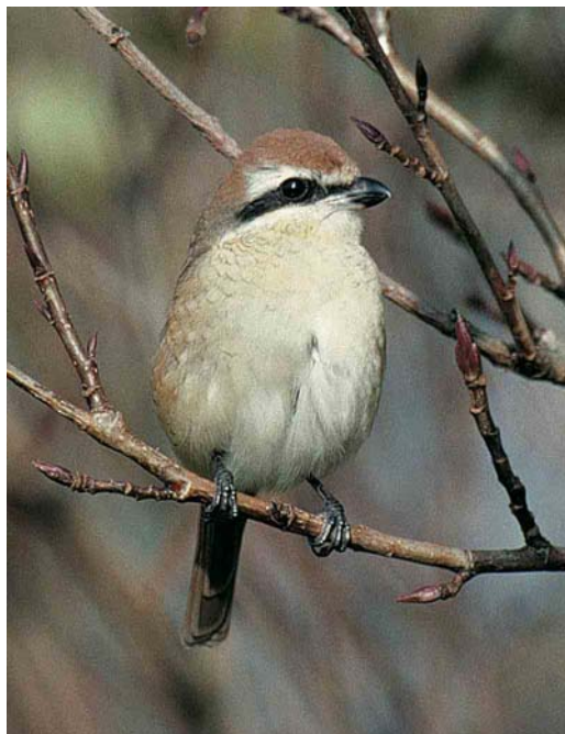
416-417 Brown Shrike / Bruine Klauwier Lanius cristatus , probably adult female, Helgoland, Schleswig-Holstein, Germany, 15 October 2001