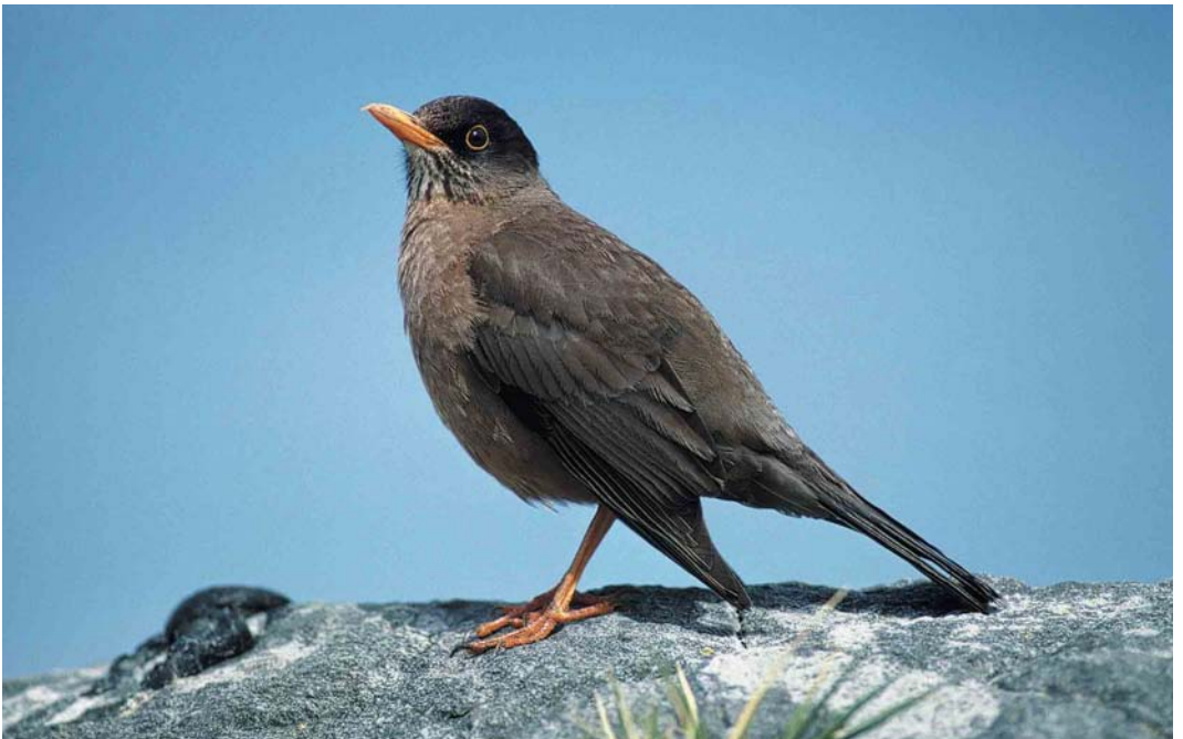
29 Falkland Thrush / Falklandlijster Turdus falcklandii falcklandii , Saunders Island, Falkland Islands, December 1990 (René Pop)