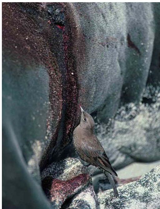
33 Blackish Cinclodes (or Tussacbird) / Zwarte Wipstaart Cinclodes antarcticus antarcticus , Sea Lion Island, Falkland Islands, February 1991 (René Pop)

though the latter can be suspected of breeding. Photographs taken during the six-week stay of two breeding gull species, Dolphin Gull Larus scoresbii and Brown-hooded Gull L. maculipennis , were published in Sangster (1999). South American Tern Sterna hirundinacea is a common colonial breeder with an estimated population of 6000-12 000 pairs; most birds are absent during the austral winter. This species occurs widespread along both coasts of mainland South America. Three other terns, Common S. hirundo , Arctic S. paradisaea and Antarctic Tern S. vittata only occur as vagrants or non-breeding visitors.