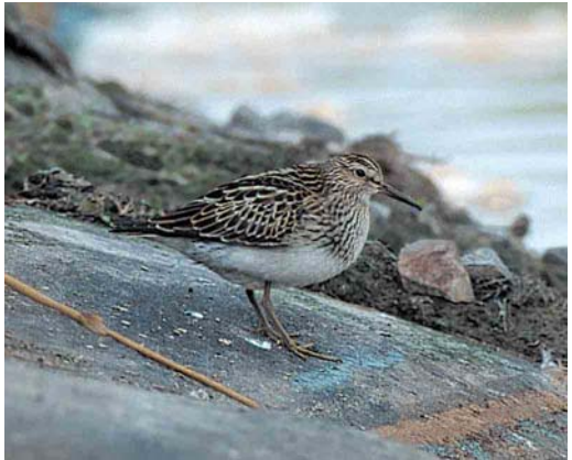
255 Golden Eagle / Steenarend Aquila chrysaetos , first-winter, Terschelling, Friesland, 19 October 1999 ( Arie Ouwerkerk ) 256 Forster's Tern / Forsters Stern Sterna forsteri , adult winter, De Boschplaat, Terschelling, Friesland, 14 November 1999 ( Arie Ouwerkerk ) 257 Lesser Yellowlegs / Kleine Geelpootruiter Tringa flavipes , adult, Jaap Deensgat, Lauwersmeer, Groningen, August 1999 ( Eric Koops ) 258 Pectoral Sandpiper / Gestreepte Strandloper Calidris melanotos , juvenile, Hoogkerk, Groningen, 18 September 1999 ( Lucien Davids )