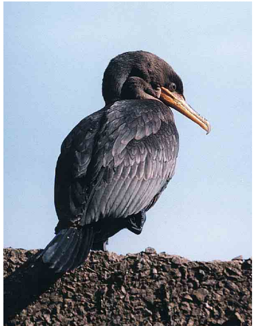
286 Double-crested Cormorant / Geoorde Aalscholver Hypoleucos auritus , juvenile, Ouessant, Finistère, France, 6 October 2000 (Alain De Broyer)

1993) in Iceland, at Miðnes and Garður, were still present. The Pied-billed Grebe Podilymbus podiceps at Saint-Denis-d'Orques, Sarthe, France, was observed from 24 June to at least 31 October. One off St Agnes, Scilly, on 26 October was taken by a Peregrine Falcon Falco peregrinus . In Norway, the one present from 7 May at Herøysund, Nordland, remained through September. A Fea's Petrel Pterodroma feae was seen off Old Head of Kinsale, Cork, Ireland, on 23 September. A record 456 Sooty Shearwaters Puffinus griseus for Utsira, Rogaland, Norway, were counted on 9 September. It now appears that the first Swinhoe's Storm-petrel Oceanodroma monorhis for Norway trapped at Revekaia, Klepp, Rogaland, on 9 August 1997 was retrapped twice at the same site this year, on 27 July and 16 August (cf Dutch Birding 22: 232-233, 2000). On 5 August, one was trapped at Cove, Aberdeen, Scotland (on 1 July, one was trapped in Kerry, Ireland). If accepted, a Markham's Storm-petrel O. markhami reported on a pelagic trip off northern California, USA, on 12 August will be the first for North America. On 5-7 October, the first Double-crested Cormorant Hypoleucos auritus for France was a moribund juvenile on Ouessant, Finistère; it was found dead on 8 October. On 9 and 17 October, one was present at Angre de Heroismo, Canary Islands. Several Pygmy Cormorants Microcarbo pygmeus were seen in Germany, including one at Unterer Knappensee, Hessen, on 19 September,