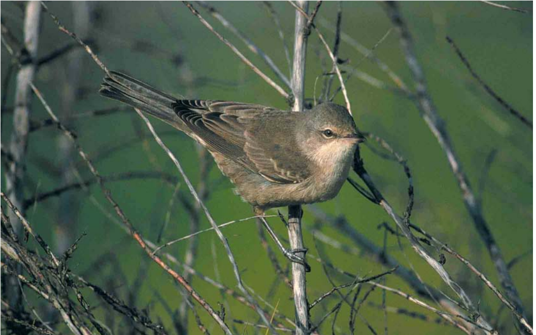
312 Sperwergrasmus / Barred Warbler Sylvia nisoria , eerstejaars, Maasvlakte, Zuid-Holland, 17 september 2000 (Peter van Rij)

Meer, Zuid-Holland, werd nog op 18 september daar waargenomen. Op 17 september was er een vangst in de Kennemerduinen, Noord-Holland. Graszangers Cisticola juncidis waren er op 9 september (vangst) bij Budel-Dorplein, Noord-Brabant, op 27 september in het Markiezaat bij Bergen op Zoom, Noord-Brabant, en op 31 oktober nog twee bij de Hellegatsplaten, Zuid-Holland. Waterrietzangers Acrocephalus paludicola werden nog opgemerkt op 10 en 17 september op de Maasvlakte. Een Kleine Spotvogel A caligatus was op 5 september aanwezig bij Oosterend op Terschelling. Sperwergrasmussen Sylvia nisoria pleisterden op 5 en 17 september op de Maasvlakte, op 9 september op Vlieland, op 10 september bij Hoek van Holland, Zuid-Holland, op 12 september op Breezanddijk, Noord-Holland, en op 23 september bij Egmond aan Zee, Noord-Holland, en bij Oostvoorne, Zuid-Holland. Het verhaal van de Grauwe Fitissen Phylloscopus trochiloides staat al in DB Actueel in het vorige nummer vermeld maar voor de volledigheid volgen hier de waarnemingen: van 1 tot 5 september op Terschelling, van 4 tot 11 september op Schiermonnikoog, van 5 tot 10 september maximaal twee en van 23 tot 25 september (nog steeds?) één op de Maasvlakte, van 5 tot 9 september bij IJmuiden en op 9 september op Texel. Er waren vangsten van Noordse Boszangers P borealis op 21 (eerste-winter) én 22 september (adult) op Vlieland. Pallas' Boszangers P proregulus waren aanwezig op 15