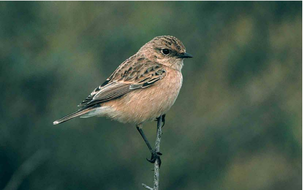
311 Aziatische Roodborsttapuit / Siberian Stonechat Saxicola maura , Maasvlakte, Zuid-Holland, 15 oktober 2000