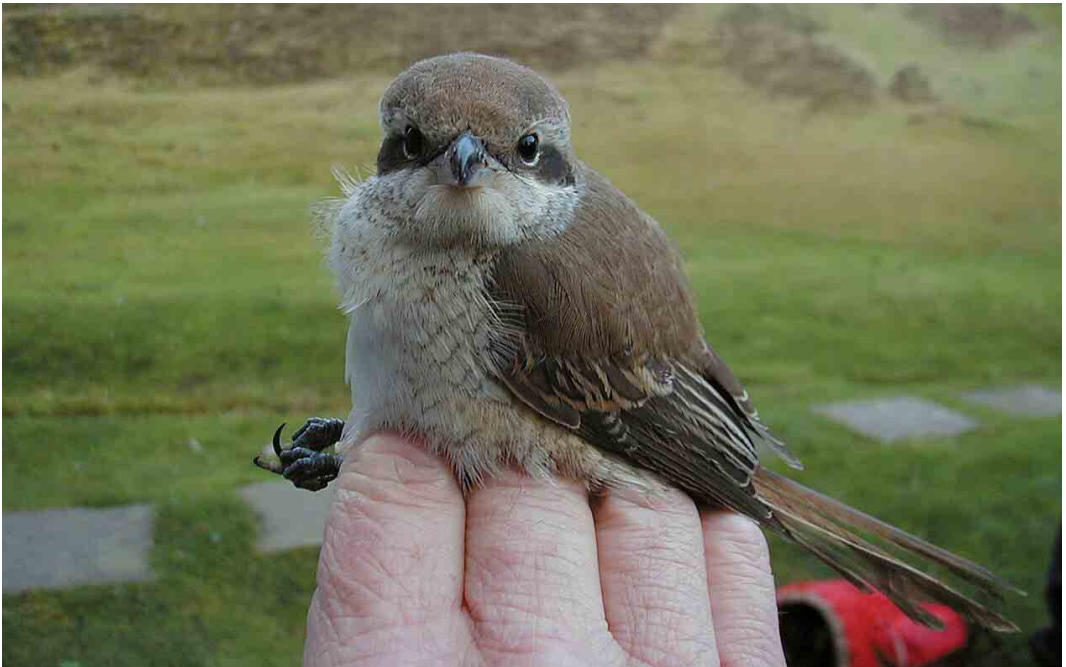
296 Brown Shrike / Bruine Klauwier Lanius cristatus , first-winter, Fair Isle, Shetland, Scotland, 21 October 2000

Skerries, Scotland, on 15-21 September. In Belgium, a female was trapped at Oud-Turnhout, Antwerpen, on 24 September. Also on Out Skerries, a Bobolink Dolichonyx oryzivorus was present on 21-22 September.