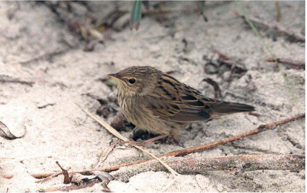
314 Kleine Sprinkhaanzanger / Lanceolated Warbler Locustella lanceolata , Heist, West-Vlaanderen, 1 oktober 2000 (Alain De Broyer)