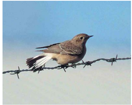
281-282 Bonte Tapuit / Pied Wheatear Oenanthe pleschanka , eerste-winter vrouwtje, Nederweert, Limburg, 10 november 1999

bovenzijde van oog. Kin en keel licht, lichtgrijs tot vuilwit.