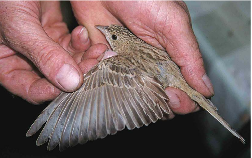
315 Zwartkopgors / Black-headed Bunting Emberiza melanocephala , adult vrouwtje, Oud-Turnhout, Antwerpen, 24 september 2000 (Tom Goossens)