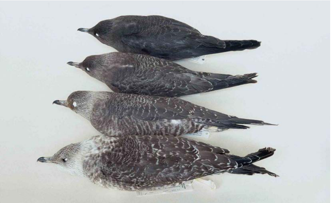
274-275 Long-tailed Jaegers / Kleinste Jagers Stercorarius longicaudus , juveniles showing variation in upperparts (plate 274) and underparts (plate 275). From bottom to top: pale morph, ZMA 15441, male, beach between IJmuiden and Zandvoort, Noord-Holland, Netherlands, 25 September 1960; paler variant of barred morph, ZMA 31490, male, Houtribdijk, Enkhuizen, Noord-Holland, 9 September 1976; darker variant of barred morph, ZMA 37359, female, Zundert, Noord-Brabant, Netherlands, 15 August 1987; dark morph, ZMA 54027, female, Vlieland, Friesland, Netherlands, 13 September 1991