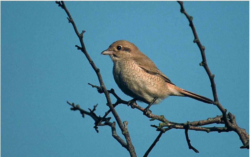
309 Izabelklauwier / isabelline shrike Lanius speculigerus/phoenicuroides , eestejaars, Castricum, Noord-Holland 2 oktober 2000 (Harm Niesen)