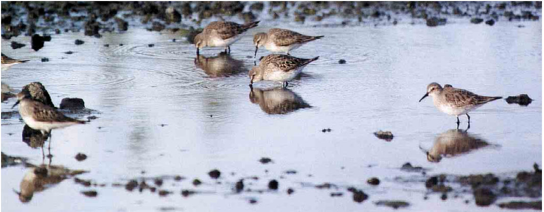
287 African Spoonbill / Afrikaanse Lepelaar Platalea alba , Azud de Riobobos, Salamanca, Spain, 27 September 2000 288 African Long-legged Buzzard / Afrikaanse Arendbuiserz Buteo rufinus circensis , Tarifa, Cadíz, Spain, September 2000 289 White-rumped Sandpipers / Bonapartes Strandlopers Calidris fuscicollis , Cabo da Praia quarry, Terceira, Azores, 22 September 2000

15: 85, 1993, Sandgrouse 22: 67-68, 2000). In the Azores, between 16 and 23 September, two juvenile Semipalmated Sandpipers C pusilla , 11 adult White-rumped Sandpipers C fuscicollis (including 10 at Cabo da Praia quarry, Terceira, on 21-22 September), one juvenile Pectoral Sandpiper C melanotos , four juvenile Lesser Yellowlegs T flavipes and two juvenile Spotted Sandpipers Actitis macularia were seen. On 23 August, an adult Sharp-tailed Sandpiper C acuminata was found at the Cabo da Praia quarry. In Norway, one was seen at Revtangen, Rogaland, on 26 September. During September, four juvenile Semipalmated Sandpipers were found in Britain and one in Ireland. At Les Attaques, Pas-de-Calais, France, one was reported from 20 October. In England and Scotland, seven White-rumped Sandpipers were seen during September. In Ireland, two adults were seen in late September and an amazing influx occurred on 8 October when at least