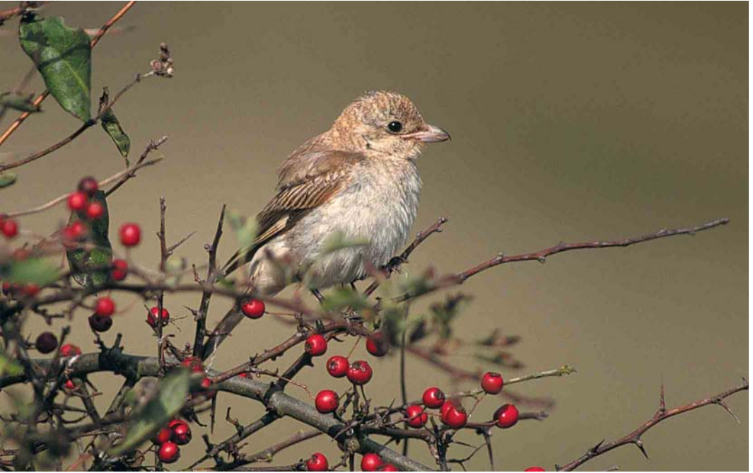
310 Roodkopklauwier / Woodchat Shrike Lanius senator , juveniel, De Nederlanden, Texel, Noord-Holland, 1 oktober 2000