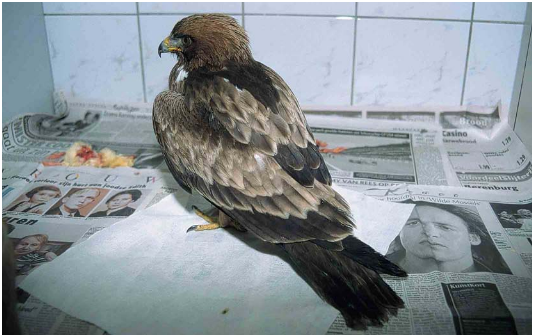
299 Dwergarend / Booted Eagle Hieraetus pennatus , juveniel, donkere vorm (verzwakte vogel gevangen op Vlieland, Friesland, op 14 oktober 2000), in vogelasiel te Ureterp, Friesland, 14 oktober 2000 (Roef Mulder)

over Westenschouwen, Zeeland, en waarschijnlijk dezelfde over de Oosterscheldekering, vanaf 22 september tot ver in oktober in de kop van Noord-Holland, op 22 en 23 september in de Engbertsdijkvenen, Overijssel, en op 23 september langs Spijk, Gelderland. Op 12 september werd een juveniele Steppiekiekendief Circus macrourus gemeld van de Maasvlakte, Zuid-Holland. Slechts één Grauwe Kiekendief C. pygargus werd doorgegeven, en wel op 24 september uit de HW-duinen, Zuid-Holland. De tweede Arendbuizerd Buteo rufinus voor Nederland werd op 5 september ontdekt langs de Praamweg, Flevoland, en op 9 en 10 september door vele waarnemers gezien. In deze omgeving werd op 7 oktober wéér een Arendbuizerd gemeld, die daar ook op 29 september gezien zou zijn. Zoekacties leverden helaas niets op. Na de melding van een 'kleinere arend' Aquila op 18 oktober ten zuiden van Maastricht, Limburg, vloog op 20 oktober een Schreeuwarend A. pomarina over bij Spijk. Een waarschijnlijke Bastaardarend A. clanga werd op 30 september gezien in de Lauwersmeer, Groningen. Een Dwergarend Hieraetus pennatus kwam op 13 oktober uit zee vliegen en landde op Vlieland. De dag erna werd de vogel in verzwakte toestand gevangen en naar een vogelasiel gebracht. Op 24 oktober werd hij in goede conditie losgelaten op de Hoge Veluwe, Gelderland, alwaar hij ook de volgende dag nog werd gezien. Op 31 oktober werd een