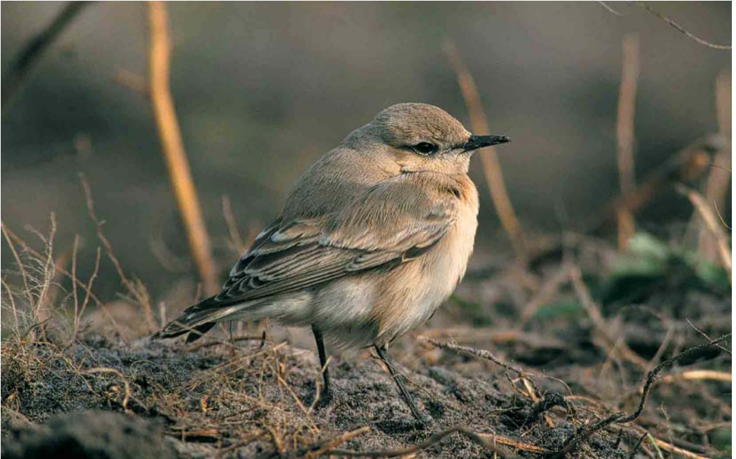
307 Izabeltapuit / Isabelline Wheater Oenanthe isabellina , eerstejaars, Schiermonnikoog, Friesland, 16 oktober 2000