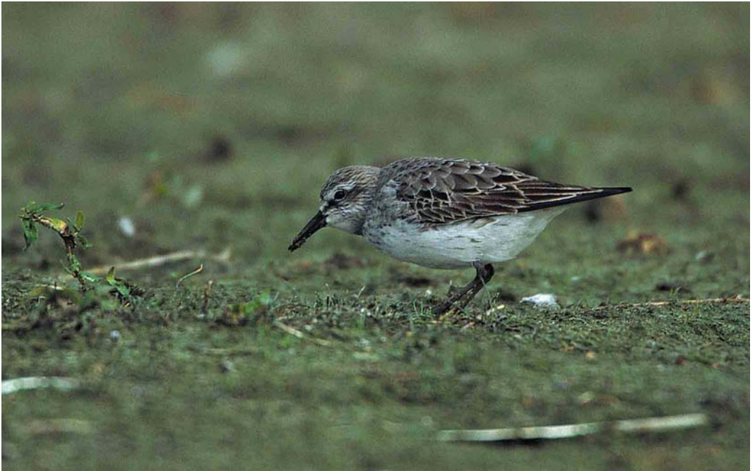
298 Bonapartes Strandloper / White-rumped Sandpiper Calidris fuscicollis , De Geul, Texel, Noord-Holland, 3 september 2000