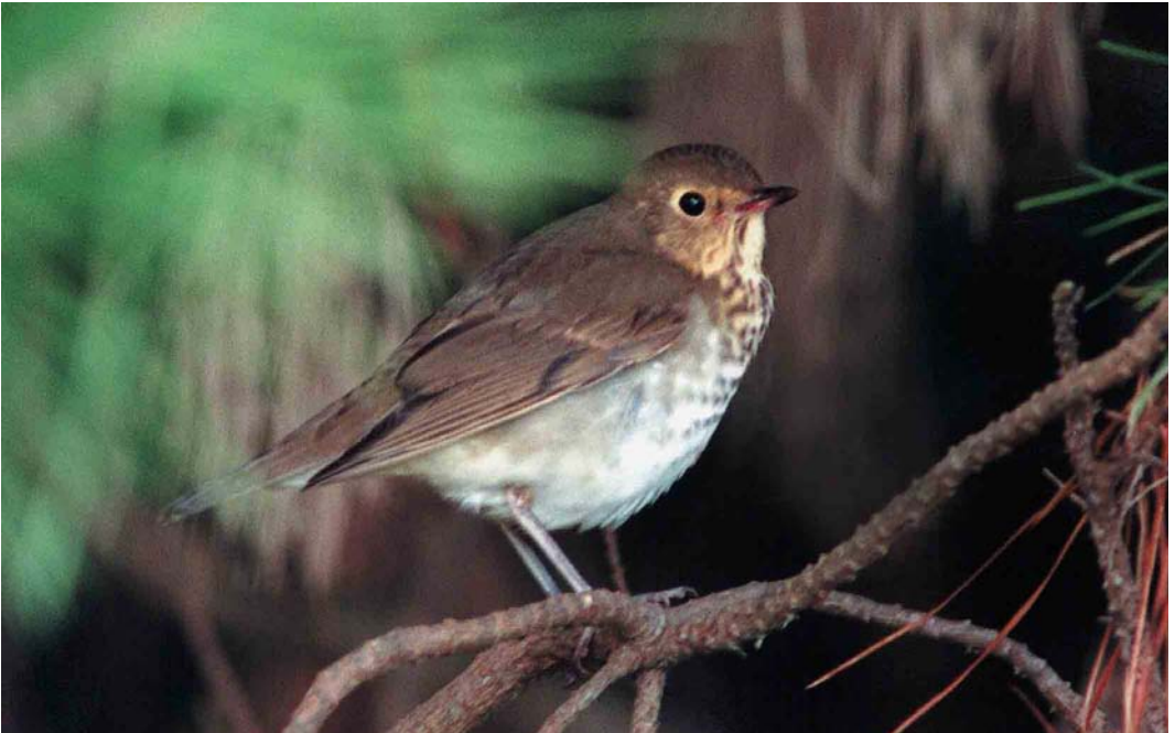
295 Swainson's Thrush / Dwerglijster Catharus ustulatus , St Mary's, Scilly, England, October 2000