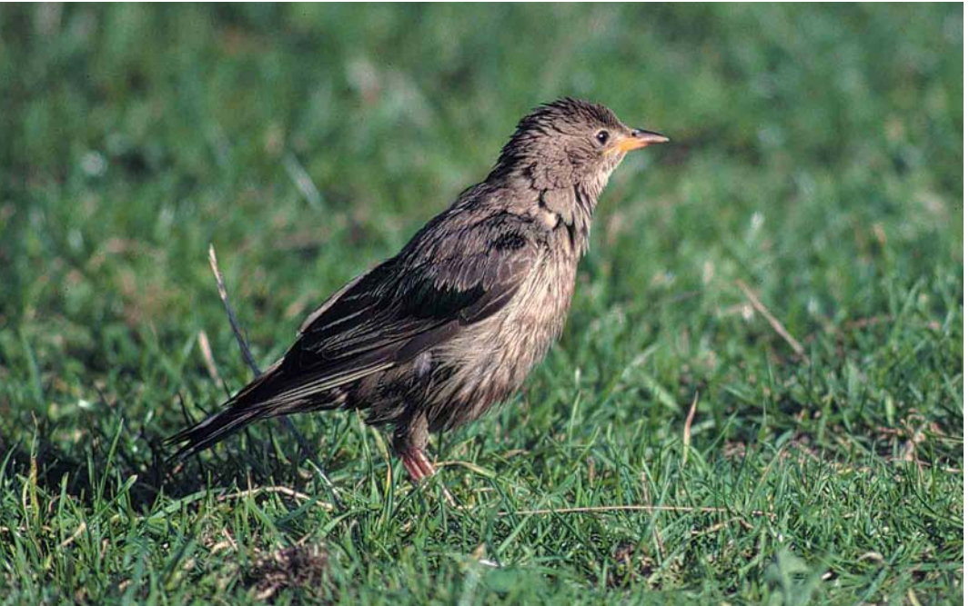
271 Rose-coloured Starling / Roze Spreeuw Sturnus roseus , juvenile moulting to first-winter, Camperduin, Noord-Holland, 12 November 1999