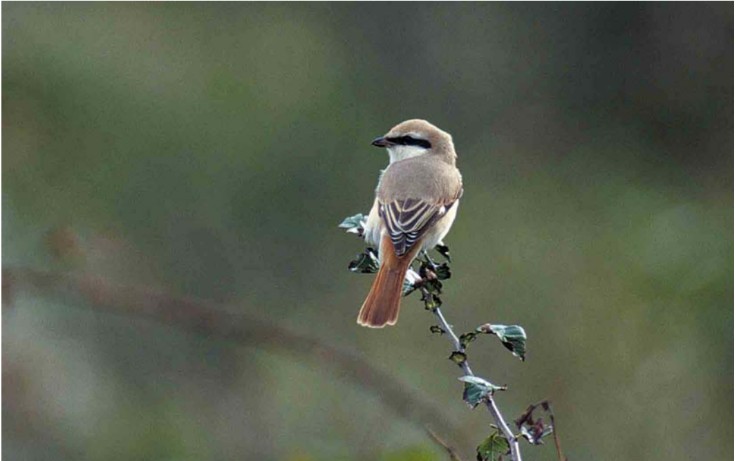
308 Vermoedelijke Turkestaanse Klauwier / presumed Turkestan Shrike Lanius phoenicuroides , adult mannetje, Eierlandse Duinen, Texel, Noord-Holland, 2 oktober 2000 (Marten van Dijl)