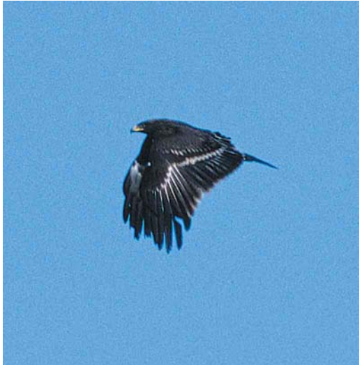
317-318 Bastaardarend / Greater Spotted Eagle Aquila clanga , juveniel, Dokkum, Friesland, 4 november 2000

verspreid en kwamen 10-tallen vogelaars de tamme en op zijn gemak foeragerende meeuw bekijken; tot zeker 12 november bleef hij op dezelfde akker aanwezig. Hoewel er wel waarnemingen van deze soort bekend zijn uit het IJsselmeergebied (waaronder de bekende vogel van de Oostvaardersdijk, Flevoland, in september 1990, cf Dutch Birding 12: 220, plaat 161, 1990) ging het hier voor zover bekend om het eerste onweerlegbare binnenlandgeval van Nederland. Het stormachtige weer van eind oktober heeft daarbij naar verwachting mag worden een rol gespeeld.