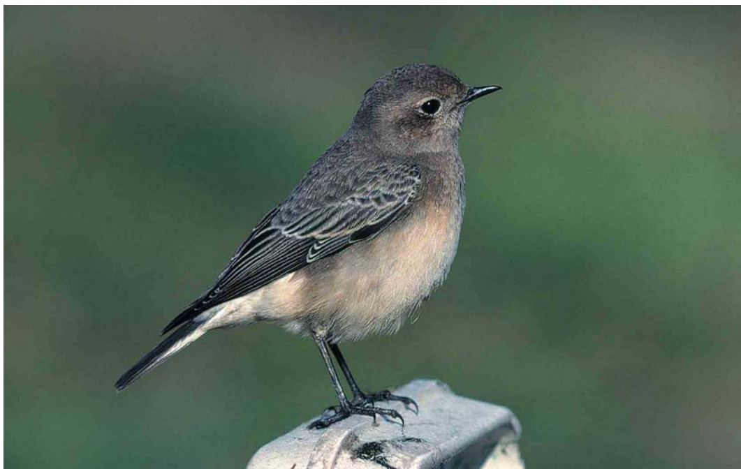
280 Bonte Tapuit / Pied Wheatear Oenanthe pleschanka , eerste-winter vrouwtje, Nederweert, Limburg, 10 november 1999

KOP Overwegend bruingrijs, zonder 'warme' roodbruine kleur. Wenkbrauwstreep onduidelijk en vaag, voornamelijk achter het oog zichtbaar. Oorstreek donkerder, contrasterend met iets lichtere wenkbrauwstreep, achter- en zijhals. Smalle oogring, vooral duidelijk aan