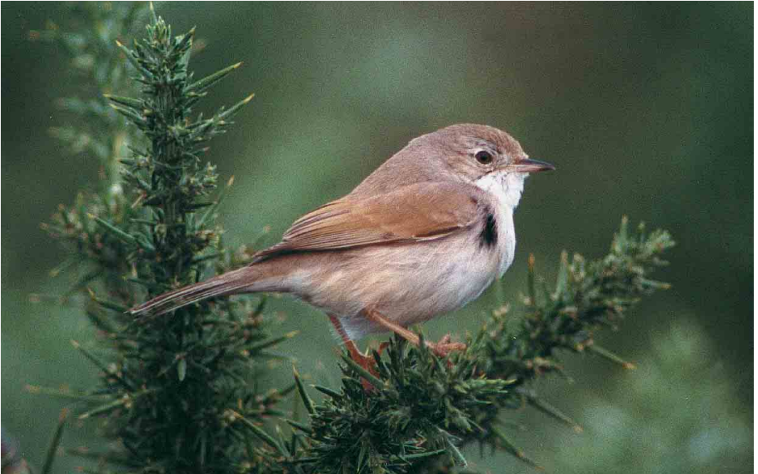
294 Spectacled Warbler / Brilgrasmus Sylvia conspicillata , Tresco, Scilly, England, October 2000