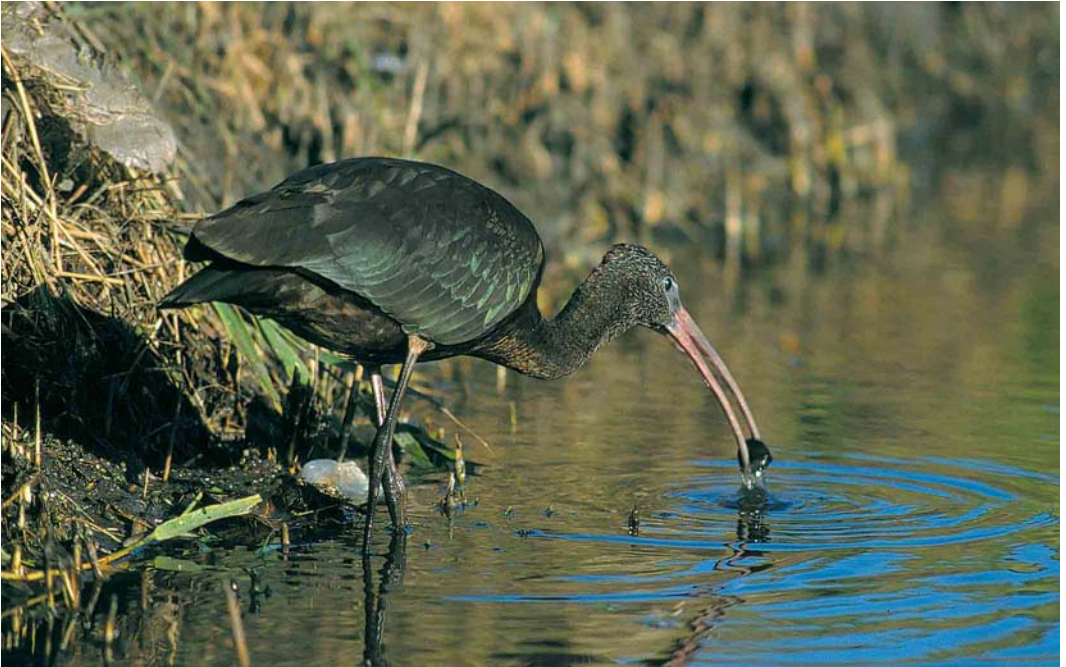
254 Glossy Ibis / Zwarte Ibis Plegadis falcinellus , Burgervlotbrug, Noord-Holland, 12 November 1999