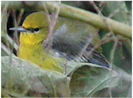
290 Eastern Common Redstart Phoenicurus phoenicurus samamisticus , male, Helgoland, Schleswig-Holstein, Germany, 4 September 2000 ( Daniel Kratzer ) 291 American Cliff Swallow / Amerikaanse Klifzwaluw Hirundo pyrrhonota , juvenile, Hugh, St Mary's, Scilly, England, 28 September 2000 ( Arnoud B van den Berg ) 292 Red-eyed Vireo / Roodoogvireo Vireo olivaceus , St Mary's, Scilly, England, October 2000 ( Steve Young/Birdwatch ) 293 Blue-winged Warbler / Blauwvleugelzanger Vermivora pinus , Cape Clear Island, Ireland, October 2000 ( Alan Horan )

during September and, on 11-30 September, at least 19 were in France. In June-August, during a survey in coastal southern Chukotka, north-eastern Siberia, it was found that Spoon-billed Sandpipers Eurynorhynchus pygmeus were almost totally absent in four locations formerly known as breeding sites. The species is known to be site-faithful and, therefore, it is now feared that it is rapidly heading for extinction. In the 1970s, the population was estimated at c 2000 pairs and the largest-ever flock was 257 in Bangladesh in January 1989 (cf Dutch Birding 14: 37-41, 1992). In Turkey, 16 Broad-billed Sandpipers Limicola falcinellus were found at Erçek Gölü on 14 September. During September, 25 Buff-breasted Sandpipers Tryngites subruficollis (all juveniles) were seen in Britain and 12 in Ireland (including up to seven in a day at Tacumshin, Wexford). In France, there was a total of 10 for September and at least two more in October. A Long-billed Dowitcher Limnodromus scolopaceus was observed at Belfast Harbour, Down, Northern Ireland, until 24 September, and one occurred at St-Come-du-Mont,