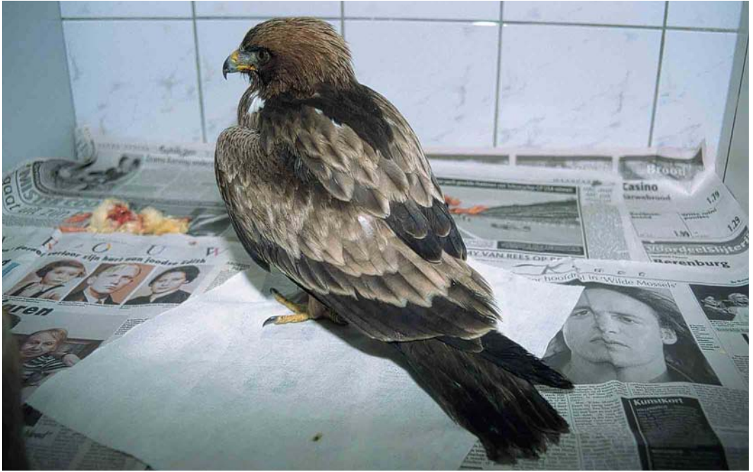
299 Dwergarend / Booted Eagle Hieraetus pennatus , juveniel, donkere vorm (verzwakte vogel gevangen op Vlieland, Friesland, op 14 oktober 2000), in vogelasiel te Ureterp, Friesland, 14 oktober 2000

over Westenschouwen, Zeeland, en waarschijnlijk dezelfde over de Oosterscheldekering, vanaf 22 september tot ver in oktober in de kop van Noord-Holland, op 22 en 23 september in de Engbertsdijkvenen, Overijssel, en op 23 september langs Spijk, Gelderland. Op 12 september werd een juveniele Steppiekiekendief Circus macrourus gemeld van de Maasvlakte, Zuid-Holland. Slechts één Grauwe Kiekendief C. pygargus werd doorgegeven, en wel op 24 september uit de HW-duinen, Zuid-Holland. De tweede Arendbuizerd Buteo rufinus voor Nederland werd op 5 september ontdekt langs de Praamweg, Flevoland, en op 9 en 10 september door vele waarnemers gezien. In deze omgeving werd op 7 oktober wéér een Arendbuizerd gemeld, die daar ook op 29 september gezien zou zijn. Zoekacties leverden helaas niets op. Na de melding van een 'kleinere arend' Aquila op 18 oktober ten zuiden van Maastricht, Limburg, vloog op 20 oktober een Schreeuwarend A. pomarina over bij Spijk. Een waarschijnlijke Bastaardarend A. clanga werd op 30 september gezien in de Lauwersmeer, Groningen. Een Dwergarend Hieraetus pennatus kwam op 13 oktober uit zee vliegen en landde op Vlieland. De dag erna werd de vogel in verzwakte toestand gevangen en naar een vogelasiel gebracht. Op 24 oktober werd hij in goede conditie losgelaten op de Hoge Veluwe, Gelderland, alwaar hij ook de volgende dag nog werd gezien. Op 31 oktober werd een