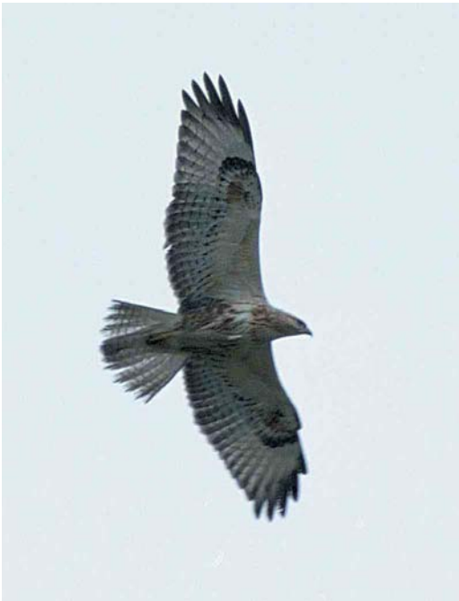
285 Long-legged Buzzard / Arendbuizerd Buteo rufinus , juvenile, Praamweg, Flevoland, Netherlands, 9 September 2000