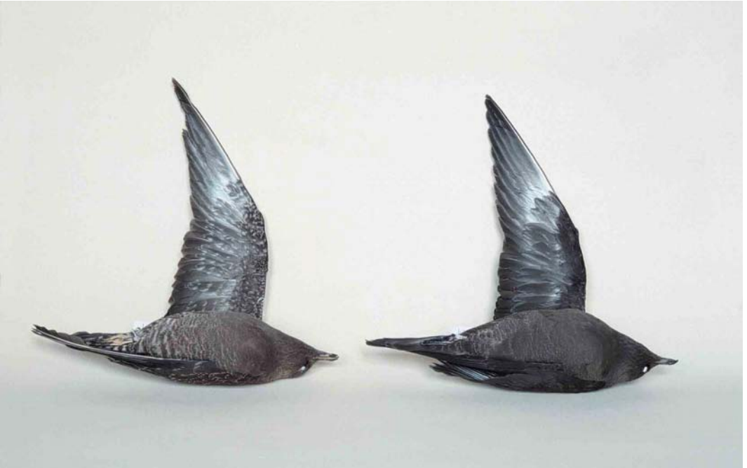
273 Long-tailed Jaegers / Kleinste Jagers Stercorarius longicaudus , darker variants of juvenile barred and juvenile dark morphs: barred morph (left), ZMA 37359, female, Zundert, Noord-Brabant, Netherlands, 15 August 1987; dark morph (right), ZMA 54027, female, Vlieland, Friesland, Netherlands, 13 September 1991

301 mm (wing), 45.4 mm (tarsus) and 27.2 mm (bill), apparently due to desiccation; the central rectrices then measured 141 mm (to the point of insertion in the skin) and the nail of the bill 15.1 mm. It is preserved as study skin with spread wing detached as ZMA 54027.