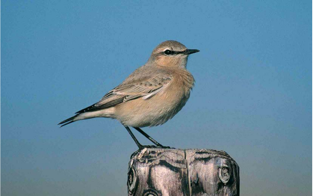
306 Izabeltapuit / Isabelline Wheater Oenanthe isabellina , eerstejaars, IJmuiden, Noord-Holland, 23 september 2000