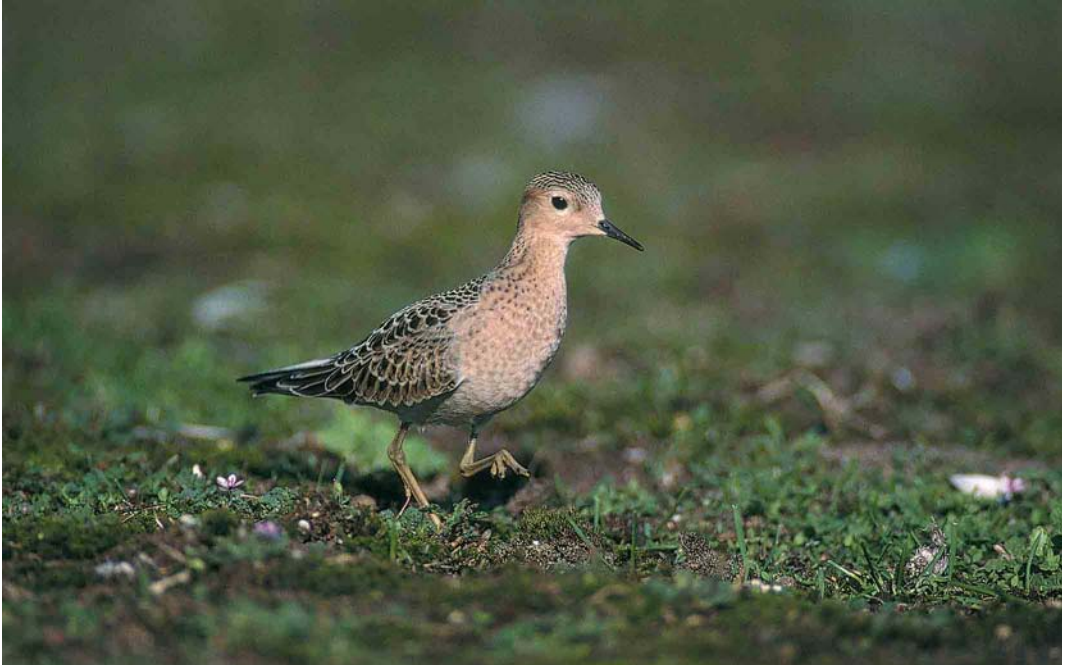
297 Blonde Ruiters / Buff-breasted Sandpiper Tryngites subruficollis , juveniel, Dintelhaven, Zuid-Holland, 25 september 2000 (Marten van Dijl)