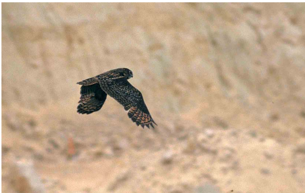
260 Eurasian Eagle Owl / Oehoe Bubo bubo , St Pietersberg, Maastricht, Limburg, 5 June 1999

'intermedius'-type birds is an identification pitfall, and future investigations may well lead to the conclusion that autumn adults can not be safely identified in the field. In that case, all records of adults need to be reviewed.