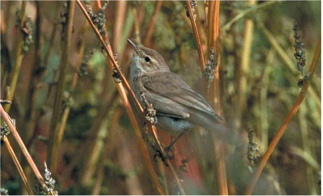
316 Kleine Spotvogel / Booted Warbler Acrocephalus caligatus , Zeebrugge, West-Vlaanderen, 18 september 2000 (Erik van Bogaert)