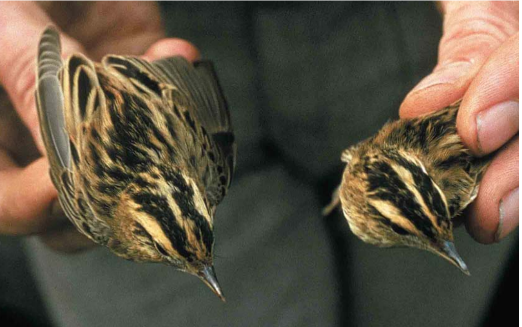
270 Aquatic Warblers / Waterrietzangers Acrocephalus paludicola , first-winter, Verdrongen Land van Saeftinge, Zeeland, 24 August 1977