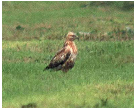
300 Grauwe Fitis / Greenish Warbler Phylloscopus trochiloides , Robbenjager, Texel, Noord-Holland, 9 september 2000 ( Erik Menkveld ) 301 Raddes Boszanger / Radde's Warbler Phylloscopus schwarzi , Maasvlakte, Zuid-Holland, 30 september 2000 ( Chris van Rijswijk ) 302 Kleine Vliegenvanger / Red-breasted Flycatcher Ficedula parva , Kornwerderzand, Friesland, 16 september 2000 ( Harm Niesen ) 303 Vaal Stormvogeltje / Leach's Storm-petrel Oceanodroma leucorhoa , Paal, Zeeland, oktober 2000 ( Jan van der Stelt ) 304-305 Arendbuiserd / Long-legged Buzzard Buteo rufinus , juveniel, Praamweg, Flevoland, 9 september 2000 ( Harm Niesen )