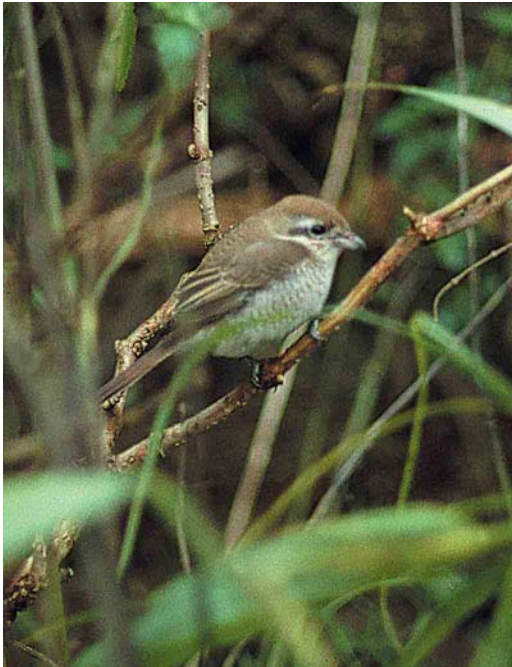
277-278 Brown Shrike / Bruine Klauwier Lanius cristatus of subspecies L c cristatus , first-winter plumage (or partial first-winter plumage), Kroghage, Gedser, Falster, Denmark, 15 October 1988 (Kasper Thorup)

In the hand, the bird appeared smaller and lighter than Red-backed Shrike. As it was very much attracted to food (the Dunnock), it may be assumed that it was a hungry (and probably lean) bird (unfortunately it was not weighed). Brown Shrike has the same (or longer) total length as Red-backed Shrike but a longer tail and therefore an absolute smaller (or similar) body size. The relatively large head and bill, though, did make the bird look large in the field. The bill was rather small for Brown Shrike. It still appeared quite strong for this type of shrike and, together