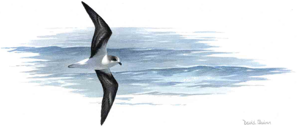
FIGURE 1 Fea's Petrel Pterodroma feae , at 55:27 N, 9:16 W, 59 km west of Donegal, Ireland, 18 August 2000 (David Quinn)

ed on the weather. In reality, it depended more on his wife. She was to be the final arbiter for, while he is at sea, she listens to the upcoming marine forecasts and would give me the all-important yes or no. Well, no harm to Mrs Gallagher, but I reckon the only forecast she pays any attention to is for her star sign in women's magazines. The uncertainty of the woman nearly drove me to Valium. My own wife, who reads this stuff in draft to keep me out of court, says my comments are 'Just like a man,' and points out that, in truth, Mrs Gallagher was concerned because I was proposing to take our young son into the bowels of the North Atlantic (you know what women are like).