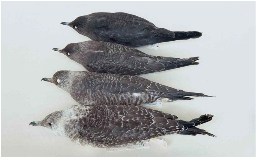
274-275 Long-tailed Jaegers / Kleinste Jagers Stercorarius longicaudus , juveniles showing variation in upperparts (plate 274) and underparts (plate 275). From bottom to top: pale morph, ZMA 15441, male, beach between IJmuiden and Zandvoort, Noord-Holland, Netherlands, 25 September 1960; paler variant of barred morph, ZMA 31490, male, Houtribdijk, Enkhuizen, Noord-Holland, 9 September 1976; darker variant of barred morph, ZMA 37359, female, Zundert, Noord-Brabant, Netherlands, 15 August 1987; dark morph, ZMA 54027, female, Vlieland, Friesland, Netherlands, 13 September 1991