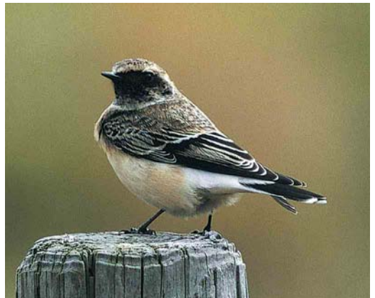
264 Radde's Warbler / Raddes Boszanger Phylloscopus schwarzi , Korverskooi, Texel, Noord-Holland, 8 October 1999 265 Western Bonelli's Warbler / Bergfluitsier Phylloscopus bonelli , Snoekebos, Kennemerduinen, Noord-Holland, 2 May 1999 266 Citrine Wagtail / Citroenkwikstaart Motacilla citreola , female, Katwijk aan Zee, Zuid-Holland, 7 May 1999 267 Greater Short-toed Lark / Kortteenleeuwerik Calandrella brachydactyla , Uitdam, Waterland, Noord-Holland, 12 September 1999 268 Pied Wheatear / Bonte Tapuit Oenanthe pleschanka , first-winter female, Nederweert, Limburg, 10 November 1999 269 Pied Wheatear / Bonte Tapuit Oenanthe pleschanka , first-winter male, De Slufter, Texel, Noord-Holland, October 1999