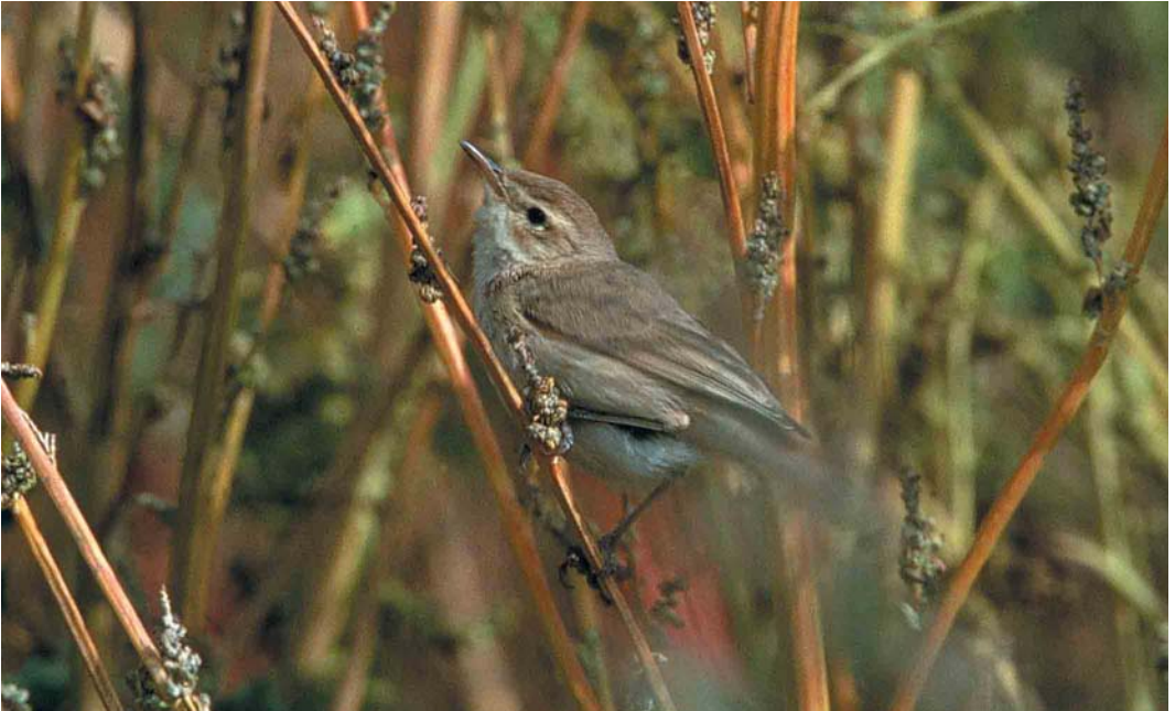
316 Kleine Spotvogel / Booted Warbler Acrocephalus caligatus , Zeebrugge, West-Vlaanderen, 18 september 2000