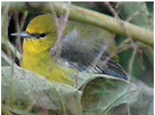
290 Eastern Common Redstart Phoenicurus phoenicurus samamisticus , male, Helgoland, Schleswig-Holstein, Germany, 4 September 2000 ( Daniel Kratzer ) 291 American Cliff Swallow / Amerikaanse Klifzwaluw Hirundo pyrrhonota , juvenile, Hugh, St Mary's, Scilly, England, 28 September 2000 ( Arnoud B van den Berg ) 292 Red-eyed Vireo / Roodoogvireo Vireo olivaceus , St Mary's, Scilly, England, October 2000 ( Steve Young/Birdwatch ) 293 Blue-winged Warbler / Blauwvleugelzanger Vermivora pinus , Cape Clear Island, Ireland, October 2000 ( Alan Horan )

during September and, on 11-30 September, at least 19 were in France. In June-August, during a survey in coastal southern Chukotka, north-eastern Siberia, it was found that Spoon-billed Sandpipers Eurynorhynchus pygmeus were almost totally absent in four locations formerly known as breeding sites. The species is known to be site-faithful and, therefore, it is now feared that it is rapidly heading for extinction. In the 1970s, the population was estimated at c 2000 pairs and the largest-ever flock was 257 in Bangladesh in January 1989 (cf Dutch Birding 14: 37-41, 1992). In Turkey, 16 Broad-billed Sandpipers Limicola falcinellus were found at Erçek Gölü on 14 September. During September, 25 Buff-breasted Sandpipers Tryngites subruficollis (all juveniles) were seen in Britain and 12 in Ireland (including up to seven in a day at Tacumshin, Wexford). In France, there was a total of 10 for September and at least two more in October. A Long-billed Dowitcher Limnodromus scolopaceus was observed at Belfast Harbour, Down, Northern Ireland, until 24 September, and one occurred at St-Come-du-Mont,