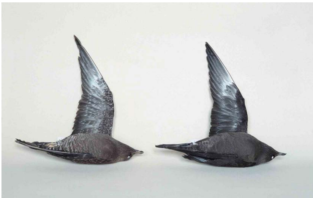
273 Long-tailed Jaegers / Kleinste Jagers Stercorarius longicaudus , darker variants of juvenile barred and juvenile dark morphs: barred morph (left), ZMA 37359, female, Zundert, Noord-Brabant, Netherlands, 15 August 1987; dark morph (right), ZMA 54027, female, Vlieland, Friesland, Netherlands, 13 September 1991

301 mm (wing), 45.4 mm (tarsus) and 27.2 mm (bill), apparently due to desiccation; the central rectrices then measured 141 mm (to the point of insertion in the skin) and the nail of the bill 15.1 mm. It is preserved as study skin with spread wing detached as ZMA 54027.