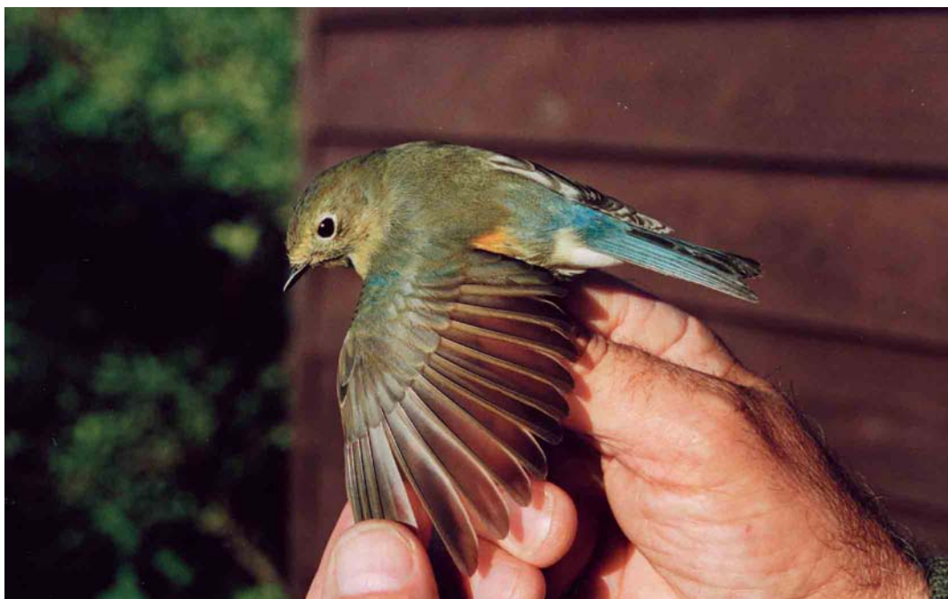
261 Red-flanked Bluetail / Blauwstaart Tarsiger cyanurus , first-winter male, Kroonspolders, Vlieland, Friesland, 11 October 1999 ( Gerrit Bochem ) 262 Red-spotted Bluethroat / Roodsterblauwborst Luscinia svecica svecica , Veendam, Groningen, 27 June 1999 ( Arnoud B van den Berg ) 263 Pine Bunting / Witkopgors Emberiza leucocephalos , first-winter female, Castricum, Noord-Holland, 8 November 1999 ( André J van Loon )