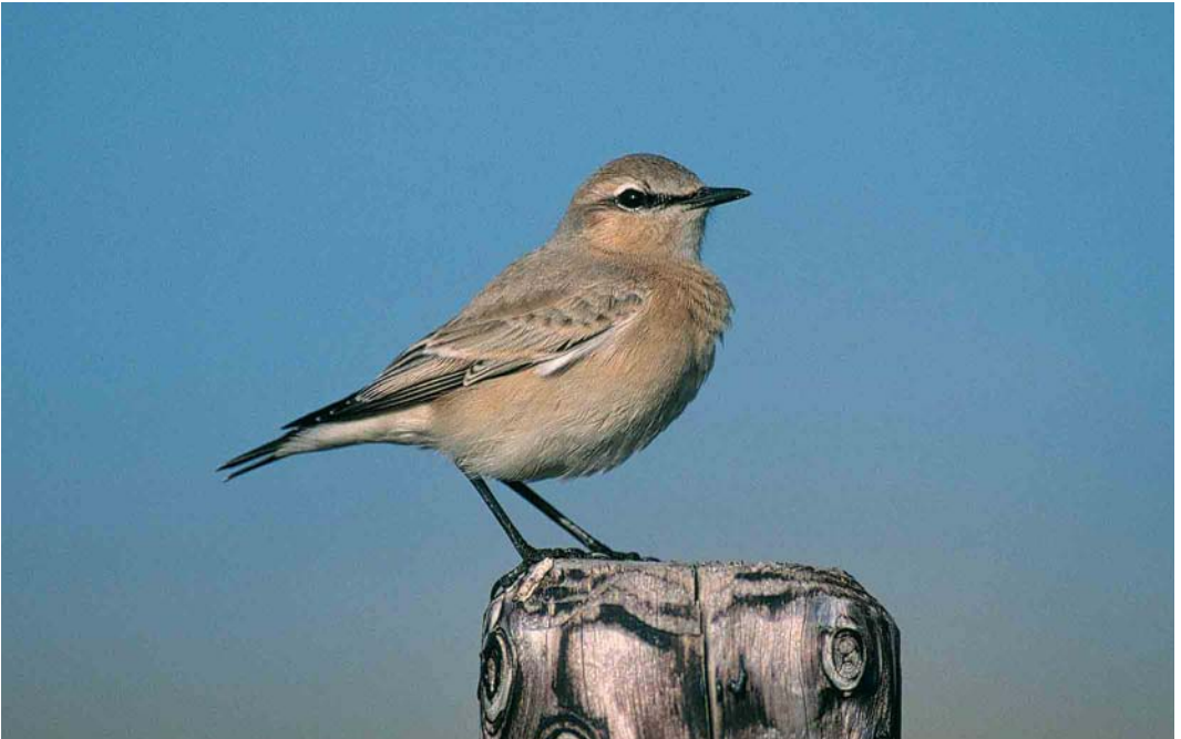
306 Izabeltapuit / Isabelline Wheater Oenanthe isabellina , eerstejaars, IJmuiden, Noord-Holland, 23 september 2000 (Marten van Dijl)