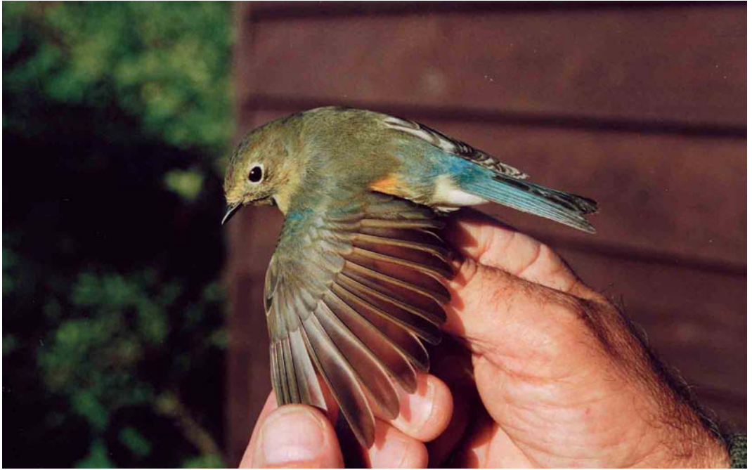
261 Red-flanked Bluetail / Blauwstaart Tarsiger cyanurus , first-winter male, Kroonspolders, Vlieland, Friesland, 11 October 1999 ( Gerrit Bochem ) 262 Red-spotted Bluethroat / Roodsterblauwborst Luscinia svecica svecica , Veendam, Groningen, 27 June 1999 ( Arnoud B van den Berg ) 263 Pine Bunting / Witkopgors Emberiza leucocephalos , first-winter female, Castricum, Noord-Holland, 8 November 1999 ( André J van Loon )