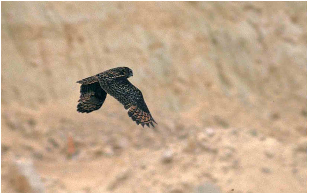
260 Eurasian Eagle Owl / Oehoe Bubo bubo , St Pietersberg, Maastricht, Limburg, 5 June 1999 (Arnoud B van den Berg)

'intermedius'-type birds is an identification pitfall, and future investigations may well lead to the conclusion that autumn adults can not be safely identified in the field. In that case, all records of adults need to be reviewed.