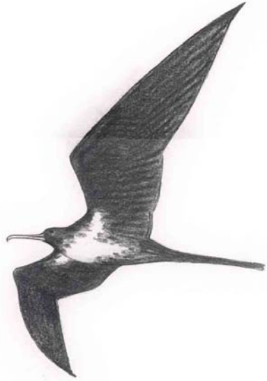
FIGURE 1 Lesser Frigatebird / Kleine Fregatvogel Fregata ariel , North Beach, Eilat, Israel, 6 May 1999

The next day, I went to the International Birdwatching Center at Eilat, where Henk Smit was involved in ringing birds. It appeared that he