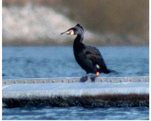
21 Grote Aalscholver / Atlantic Great Cormorant Phalacrocorax carbo carbo , mannetje (links / left) en Continentale Aalscholver / Continental Great Cormorant P c sinensis , Heel, Limburg, 4 februari 2000 (Arnoud B van den Berg)