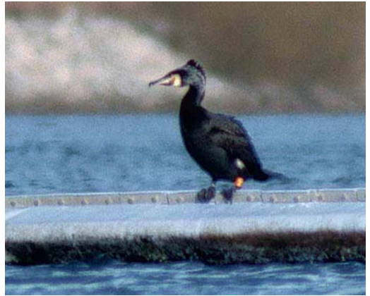
21 Grote Aalscholver / Atlantic Great Cormorant Phalacrocorax carbo carbo , mannetje (links / left) en Continentale Aalscholver / Continental Great Cormorant P c sinensis , Heel, Limburg, 4 februari 2000 (Arnoud B van den Berg)