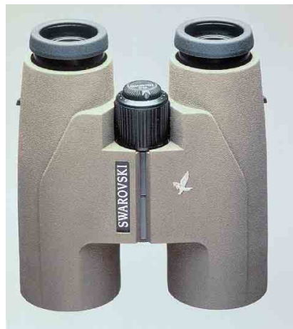
Swarovski SLC 10x42 WB binoculars

Only subscribers to Dutch Birding are eligible to enter. Excluded from entry are the editors and members of the editorial board of Dutch Birding and the members of the board of the Dutch Birding Association. Photographers whose work is used in the competition (both as mystery birds or as photographs accompanying the solutions)