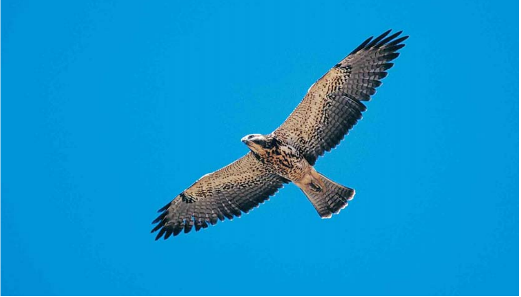
32 Swainson's Hawk / Prairiebuizerd Buteo swainsoni , juvenile, Davis, California, USA, 16 August 1997 ( Ned Harris ). Note two-toned wing and typical wing-shape with long p8 and p7 33 Swainson's Hawk / Prairiebuizerd Buteo swainsoni , (sub)adult, Antelope Valley, California, USA, 8 August 1998 ( Ned Harris ). Intermediate bird with rather dark underwing-coverts but flight-feathers still darker. Bases of outer primaries slightly paler than rest of flight-feathers. Pale markings on head in combination with otherwise largely adult-like plumage suggest subadult bird 34 Swainson's Hawk / Prairiebuizerd Buteo swainsoni , juvenile, Antelope Valley, California, USA, 8 August 1998 ( Ned Harris ). Wing-tip nearly reaches tail-tip. Aged by pale feather-fringes and -tips, pale head and not completely dark iris