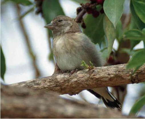
36 European Goldfinch / Putter Carduelis carduelis, juvenile, Luz, Algarve, Portugal, 16 July 1999