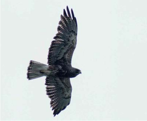
27 Swainson's Hawk / Prairiebuzierd Buteo swainsoni , adult dark morph, Benton Lake National Wildlife Refuge, Montana, USA, July 1997 (Brian E Small). Same individual as original mystery bird. Note wing shape, contrasting white vent and undertail-coverts and well-demarcated dark trailing edge to wings and tail