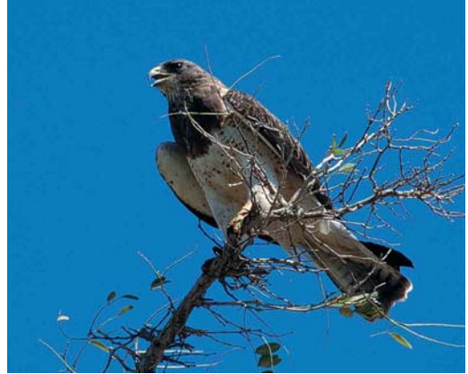
28 Swainson's Hawk / Prairiebuzierd Buteo swainsoni , adult light morph, Antelope Valley, California, USA, 8 August 1998 (Ned Harris). Classic bird with dark head and breast and virtually unmarked belly and underwing-coverts

subterminal band. This adult dark-morph Swainson's Hawk was photographed at Benton Lake National Wildlife Refuge, Montana, USA, in July 1997 by Brian E Small. Another photograph of the same bird in flight appears as plate 27. This bird was identified correctly by 23% of the entrants. The most mentioned incorrect answers were Long-legged Buzzard (33%), Common Buzzard (25%, including Steppe Buzzard) and Booted Eagle (8%).