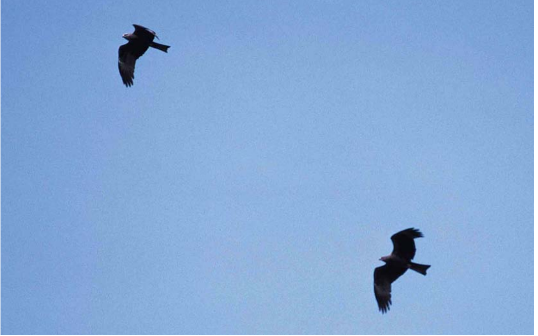
146 Zwarte Wouwen / Black Kites Milvus migrans , Breskens, Zeeland, 16 mei 2000 ( Norman D van Swelm ) 147 Morinelplevier / Eurasian Dotterel Charadrius morinellus , Hargen, Noord-Holland, 7 mei 2000 ( Sander Lagerveld ) 148 Grijskopspecht / Grey-headed Woodpecker Picus canus , mannetje, Oosterbeek, Gelderland, 15 mei 2000 ( Arnoud B van den Berg )