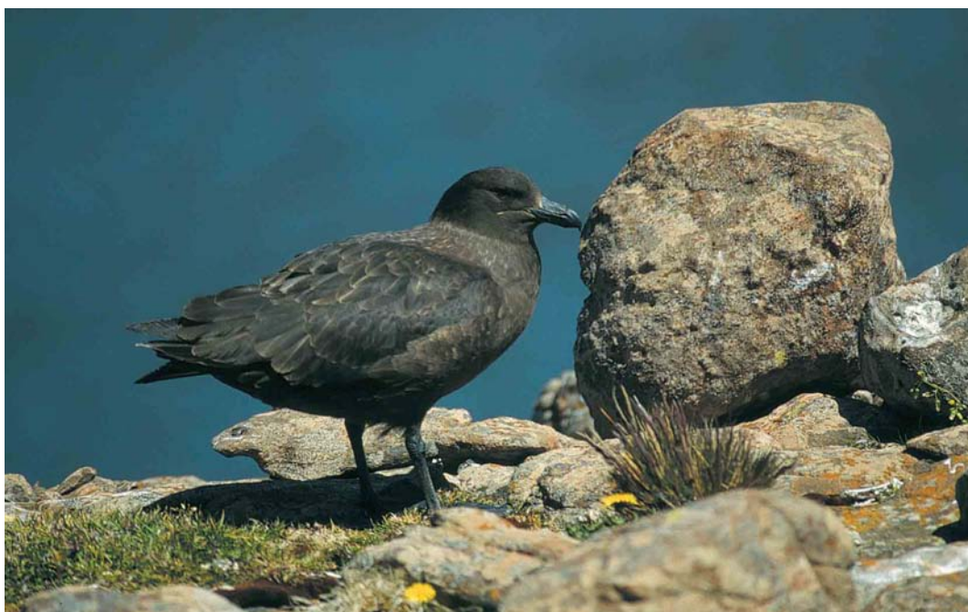
121 Subantarctic Skua / Lönnsberg's Grote Jager Stercorarius antarcticus lonnbergi , immature female, Kerguelen Archipelago, January 1997 (Frédéric Jiguet). Pale nose-band is visible on this bird