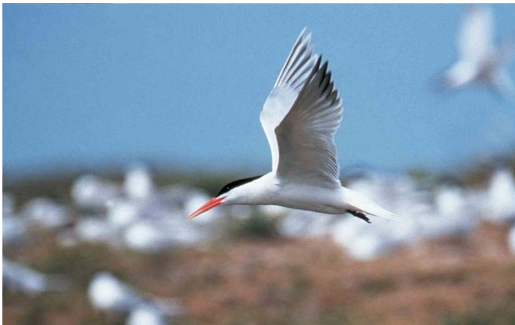
129-130 Elegant Tern / Sierlijke Stern Sterna elegans with Sandwich Terns / Grote Sterns S. sandvicensis , Langli, Vestjylland, Denmark, June 2000 (Jens Ryge Petersen)