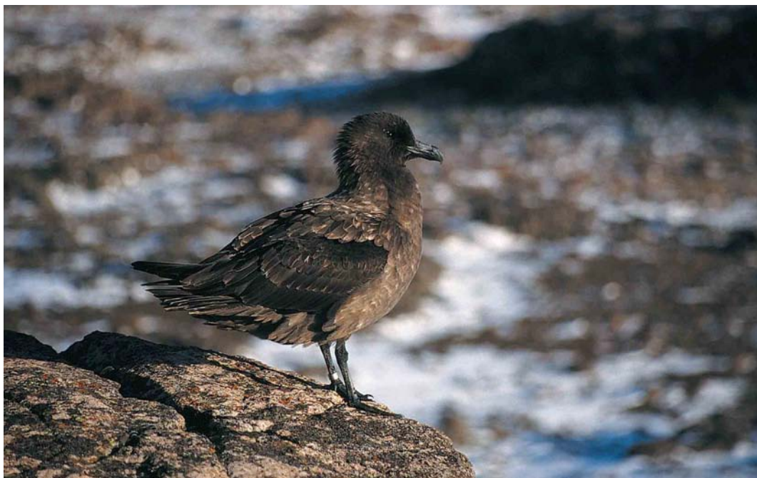
120 Subantarctic Skua / Lönnsberg's Grote Jager Stercorarius antarcticus lonnbergi , male, Kerguelen Archipelago, September 1996 (Frédéric Jiguet). Compare bill of this male with that of female in plate 119