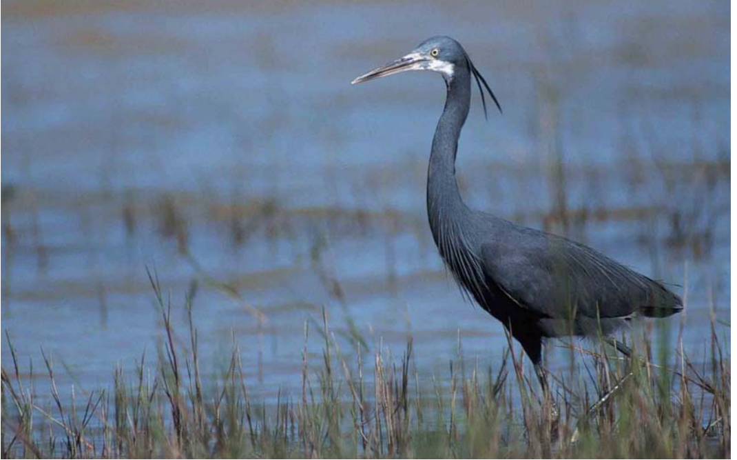
127 Western Reef Egret / Westelijke Rifeiger Egretta gularis , Carrapateira, Cabo de São Vicente, Algarve, Portugal, May 2000