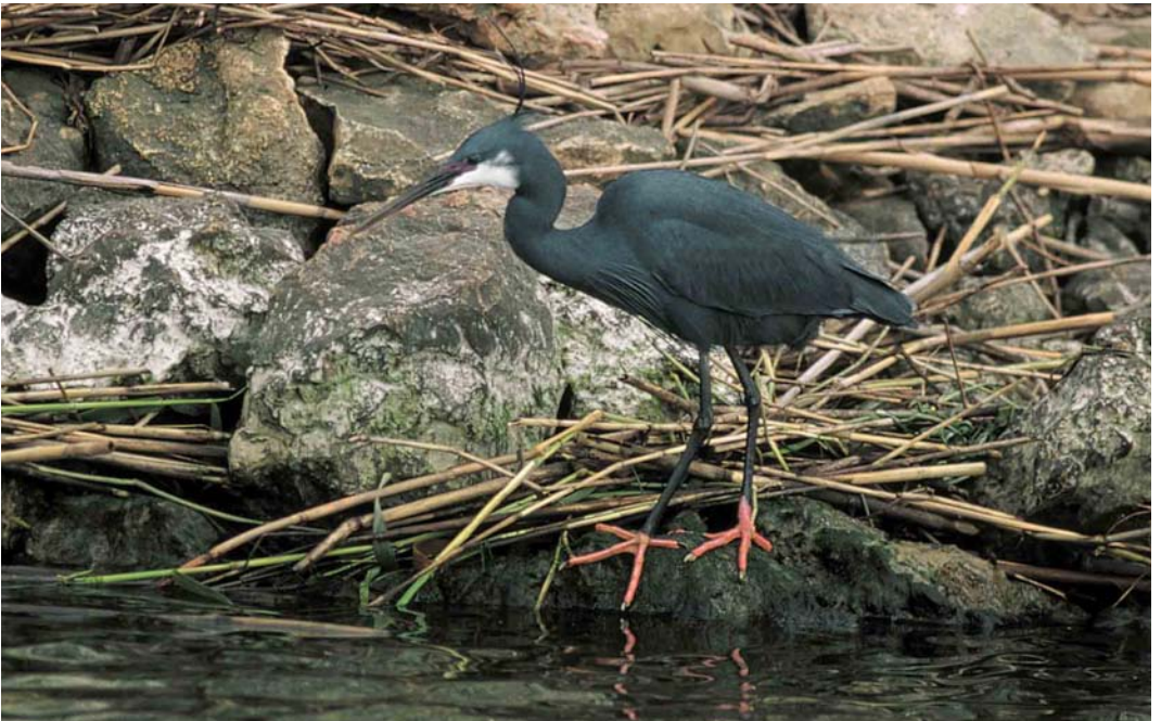
128 Western Reef Egret / Westelijke Rifeiger Egretta gularis , Ebro delta, Spain, 19 May 2000 (Mariano Cebolla Borrell)