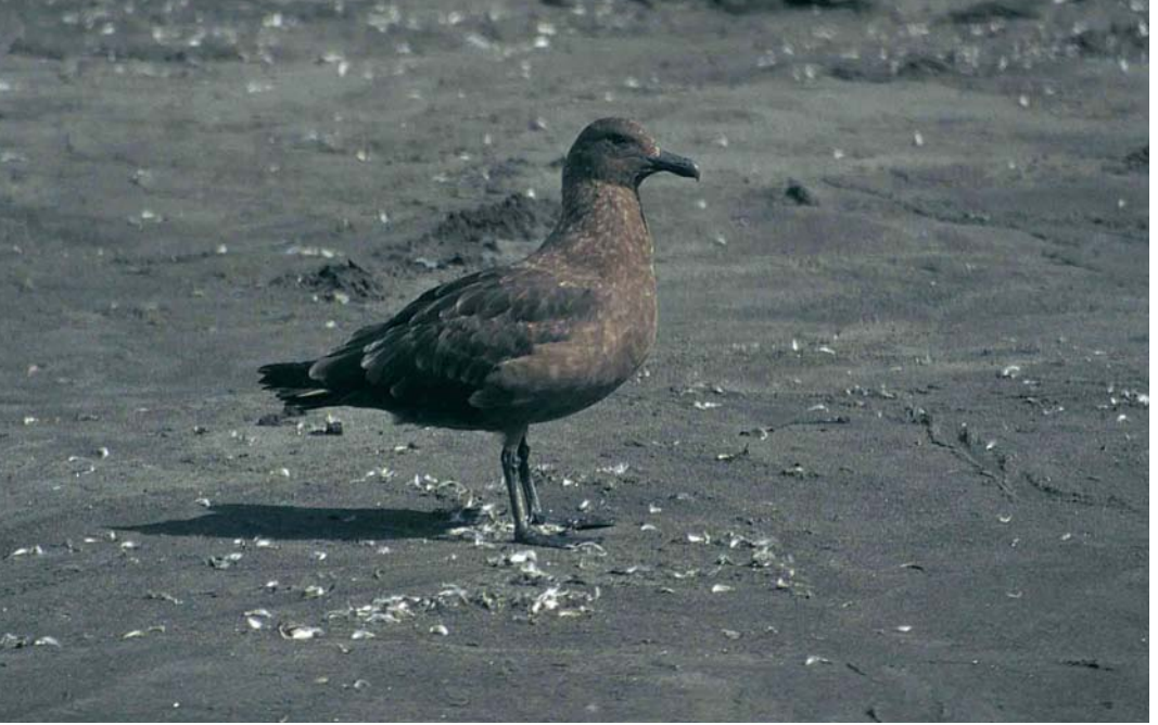
122 Subantarctic Skua / Lönneberg's Grote Jager Stercorarius antarcticus lonnbergi , immature female, Kerguelen Archipelago, October 1996 (Frédéric Jiguet). Plain brown immature with pale nose-band