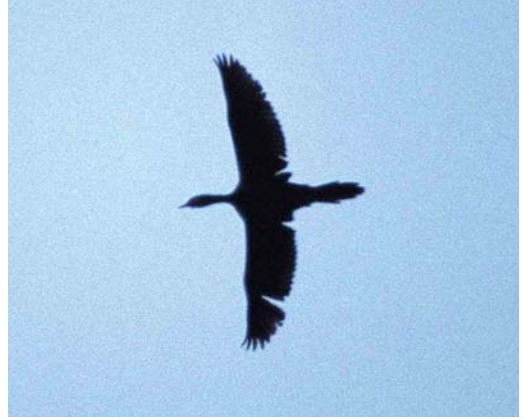
107 Dwergaalscholver / Pygmy Cormorant Microcarbo pygmeus , Montfoort, Utrecht, 24 januari 1999 (Rudy Offereins)

50 m. Overwegend solitair maar af en toe tussen eenden rustend.