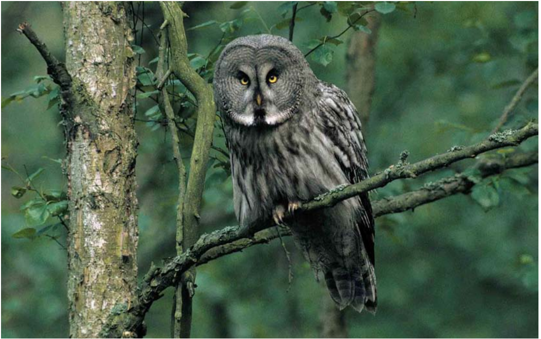
133 Great Grey Owl / Laplanduil Strix nebulosa , Skummeslövstrand, Halland, Sweden, June 2000 (Felix Heintzenberg)

seen on 4 June. If accepted, a Little Swift A. affinis in Gironde on 3 May will be the first for France. The second White-throated Kingfisher Halcyon smyrnensis for Azraq, Jordan, was seen on 26 April (the first was in 1922). In Vestjylland, Denmark, a flock of 12 European Bee-eaters Merops apiaster migrated north past Blåvands Huk on 5 June and past Vesterlund Kro on 6 June. Possibly, this was the same flock (originally 13, one being killed by a car) seen from 31 May to 3 June at Oudeschip and Nooitgedacht, Groningen, the Netherlands. The fourth Grey-headed Woodpecker Picus canus for the Netherlands was an adult male drumming and calling from at least 8 May to 11 June at Oosterbeek, Renkum, Gelderland.