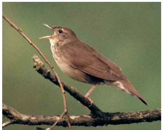
149 Dwergarend / Booted Eagle Hieraaetus pennatus , adult, donkere vorm, Rhenen, Gelderland, 24 juni 2000 (Jan Wierda) 150 Grijszwart / Black-winged Kite Elanus caeruleus , Meerstalblok, Drenthe, 12 juni 2000 (Dirk Moerbeek) 151 Amerikaanse Wintertaling / Green-winged Teal Anas carolinensis , mannetje, Spaarndam, Noord-Holland, 5 mei 2000 (Arnoud B van den Berg) 152 Griel / Stone-curlew Burhinus oedicnemus , Maasvlakte, Zuid-Holland, 13 mei 2000 (Marten van Dijl) 153 Baltische Mantelmeeuw / Baltic Gull Larus fuscus , subadult, Steenwaard, Houten, Utrecht, 30 april 2000 (Marc Plomp) 154 Krezelzanger / River Warbler Locustella fluviatilis , Australiëhaven, Amsterdam, Noord-Holland, juni 2000 (Jan den Hertog)