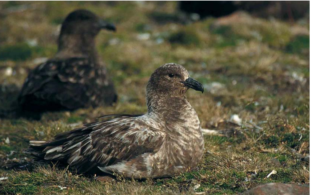
123 Subantarctic Skua / Lönneberg's Grote Jager Stercorarius antarcticus lonnbergi , Kerguelen Archipelago, January 1997 (Frédéric Jiguet). Bird with very worn and abraded plumage, showing obvious pale blaze at base of bill