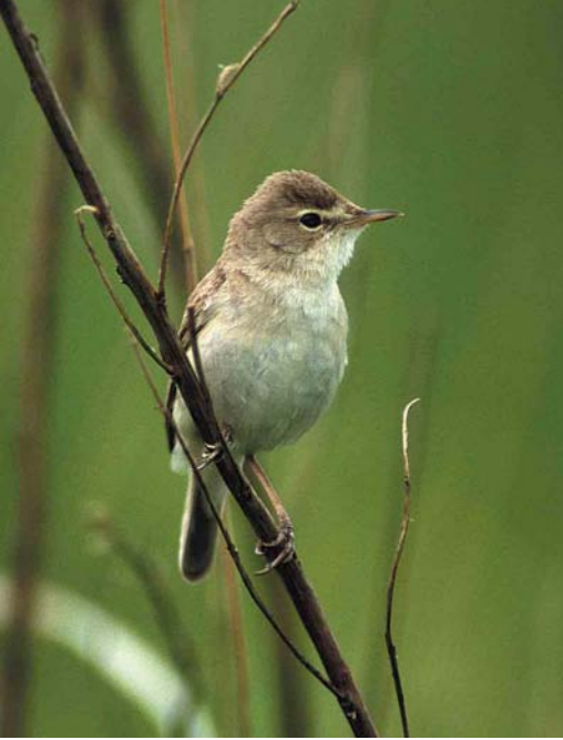
134 Booted Warbler / Kleine Spotvogel Acrocephalus caligatus , Värtsilä, Finland, June 2000 (Pekka Komi)