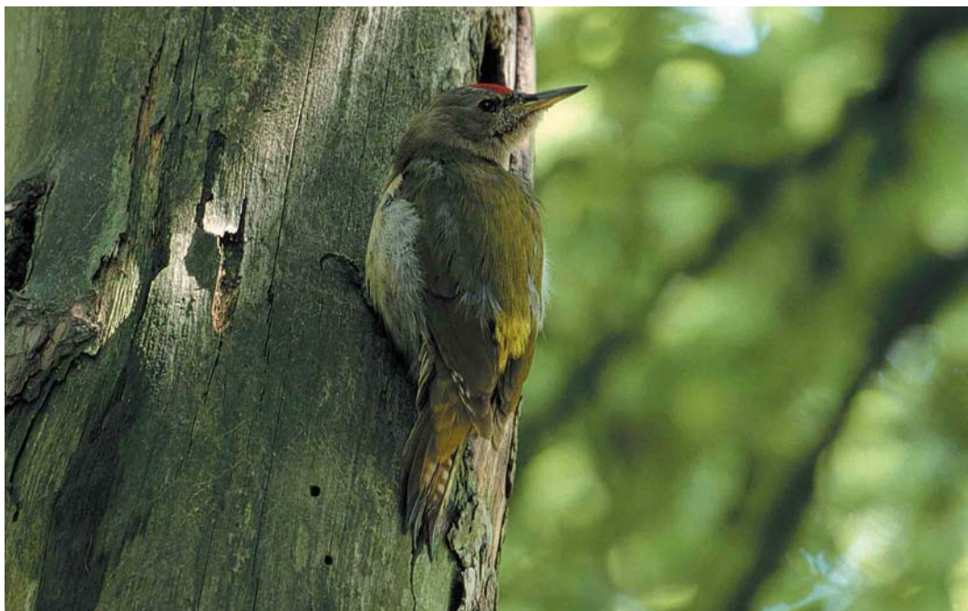
144 Grijskopspecht / Grey-headed Woodpecker Picus canus , mannetje, Oosterbeek, Gelderland, 31 mei 2000