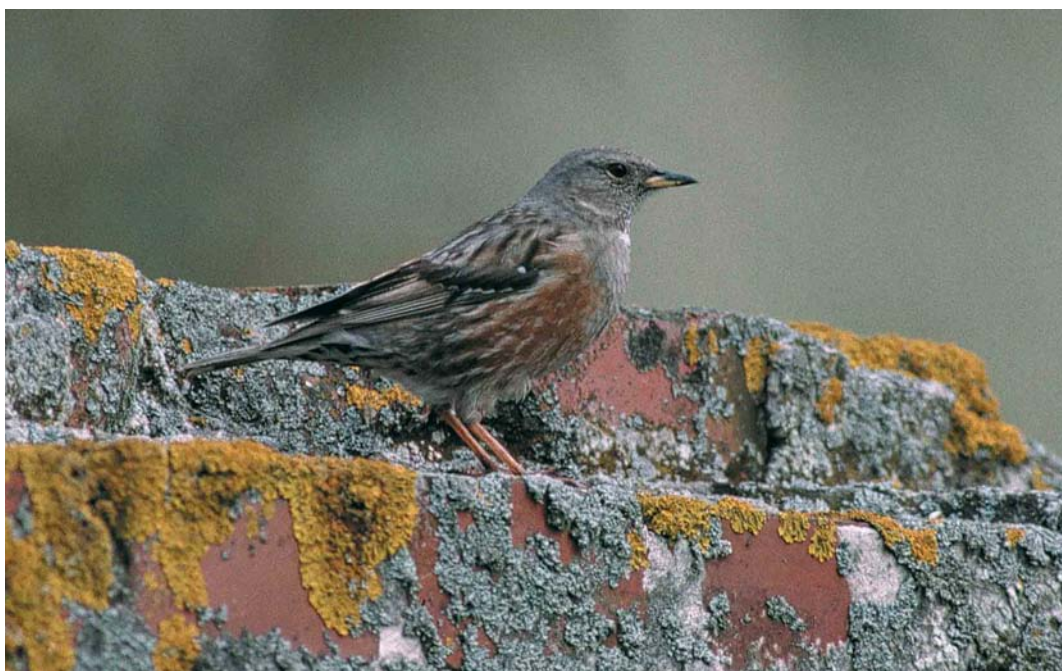
145 Alpenheggenmus / Alpine Accentor Prunella collaris , Formerum aan Zee, Terschelling, Friesland, 4 mei 2000