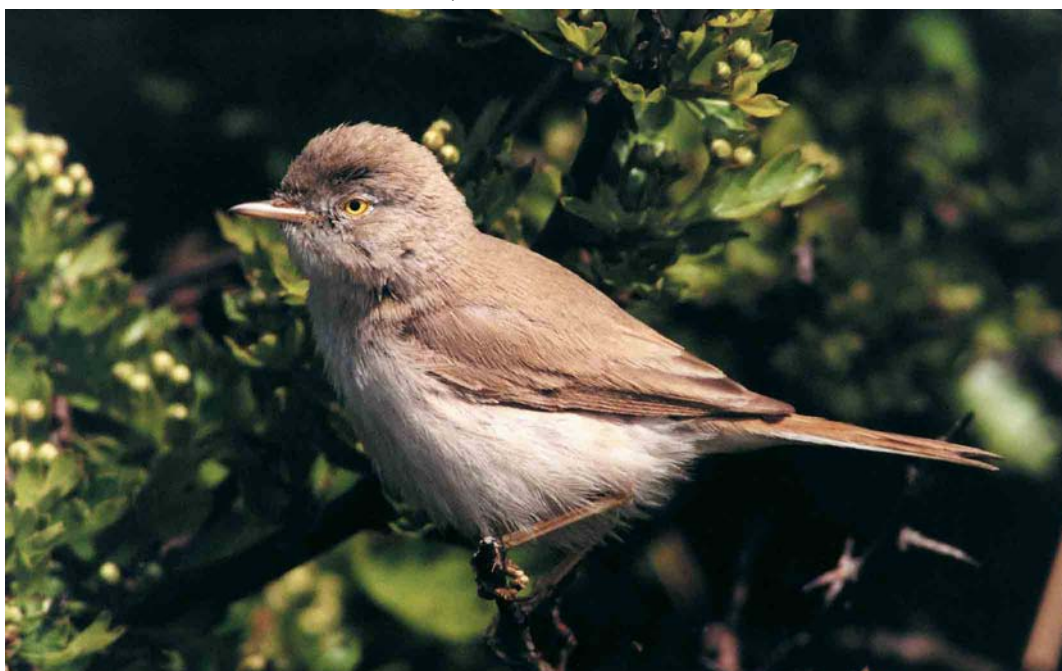
138 Asian Desert Warbler / Aziatische Woestijngrasmus Sylvia nana nana , Spurn, East Yorkshire, England, May 2000 (Iain H Leach)