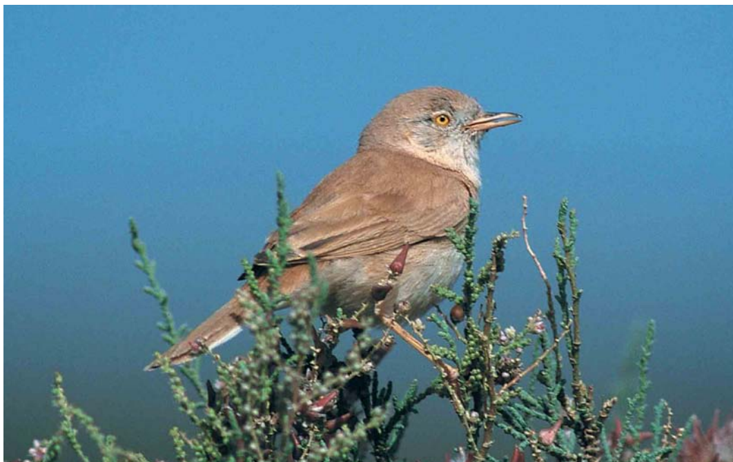
137 African Desert Warbler / Afrikaanse Woestijngrasmus Sylvia nana deserti , Merzouga, Morocco, 20 April 2000