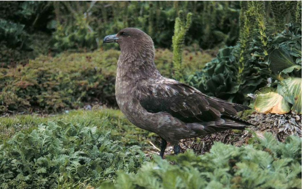
119 Subantarctic Skua / Lönnerbergs Grote Jager Stercorarius antarcticus lonnbergi , female, Mayes Island, Kerguelen Archipelago, December 1995. Very large and powerful female with huge deep bill