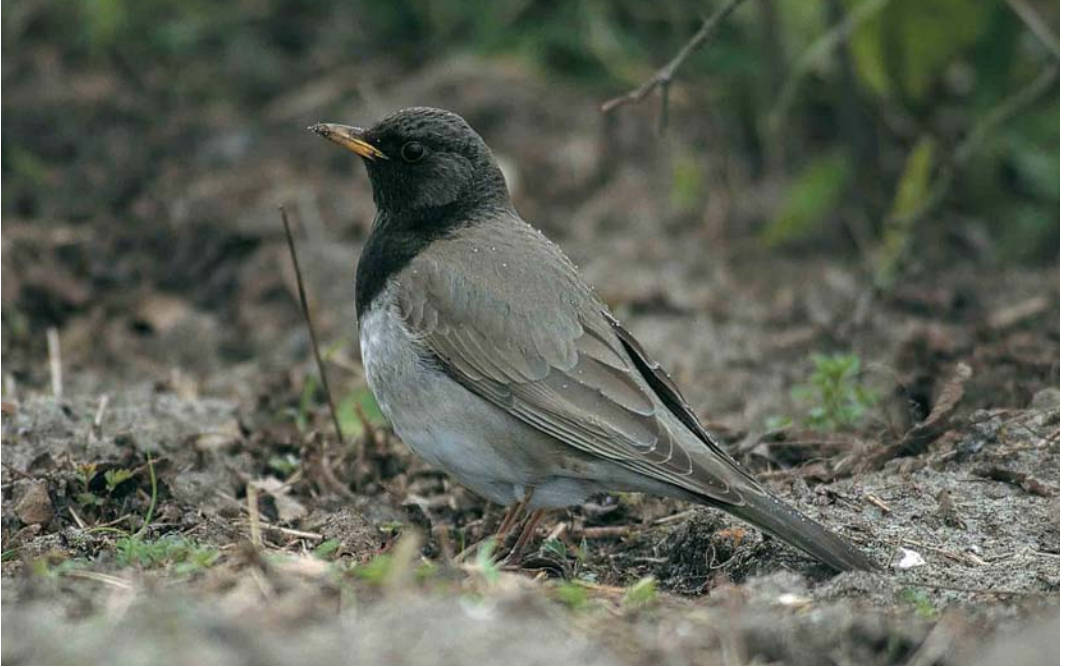
113 Zwartkeellijster / Black-throated Thrush Turdus ruficollis atrogularis , adult mannetje, West-Terschelling, Terschelling, Friesland, 13 april 1998

gevallen in België houdt mogelijk verband met het feit dat de voorjaarsvangst van lijsters reeds in 1875 werd afgeschaft (Gunter De Smet in litt).