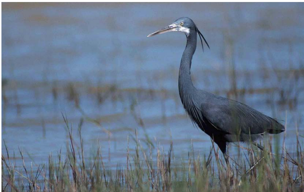
127 Western Reef Egret / Westelijke Rifeiger Egretta gularis , Carrapateira, Cabo de São Vicente, Algarve, Portugal, May 2000