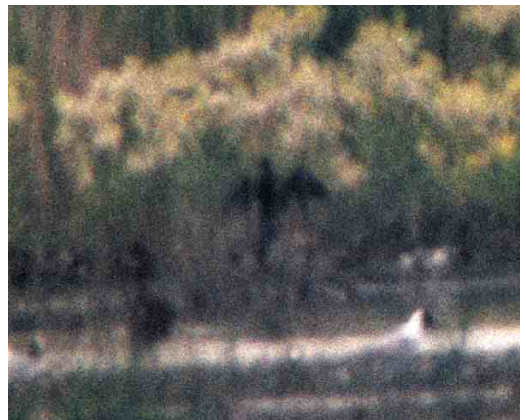
108 Dwergaalscholver / Pygmy Cormorant Microcarbo pygmeus , Oostvaardersplassen, Flevoland, 12 juni 1999 (Ferry Ossendorp)