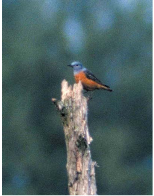
157 Roodsterblauwborst / Red-spotted Bluethroat Luscinia svecica svecica , mannetje, Vlieland, Friesland, 5 mei 2000 158 Rode Rotslijster / Rufous-tailed Rock Thrush Monticola saxatilis , mannetje, Blaricum, Noord-Holland, 4 mei 2000 159 Bijeneters / European Bee-eaters Merops apiaster , Oudeschip, Groningen, 2 juni 2000 160 Zwartkoppors / Black-headed Bunting Emberiza melanocephala , mannetje, Midsland, Terschelling, Friesland, 30 juni 2000