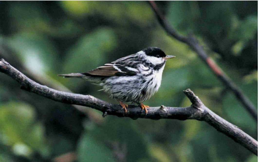
135-136 Blackpoll Warbler / Zwartkopzanger Dendroica striata , Seaforth Docks, Merseyside, England, 2 June 2000