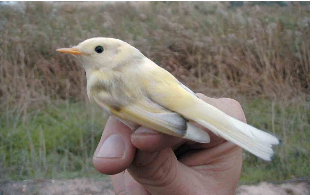
115 Leucistic Northern Chiffchaff / leucistische Tjiftjaf Phylloscopus collybita , Remolar-Filipines reserve, Llobregat delta, Barcelona, Spain, 2 November 1999 ( Ricard Gutiérrez )