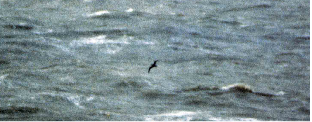
117 Dark gadfly-petrel / donkere stormvogel Pterodroma , Oostende, West-Vlaanderen, Belgium, 7 February 1999

nearly as dark as the mystery petrel; 2 even the darkest individuals show contrastingly pale primary bases; 3 in Northern Fulmar, the bill is paler; 4 the flight was strikingly different from nearly 30 Northern Fulmars seen that day; and 5 the petrel was smaller than Northern Fulmar. Shearwaters have flatter stiffer wings and a more slender body than the mystery petrel. Jaegers have a more falcon-like shape, with more obviously hooked wings. According to Klaus Malling Olsen (pers comm), the bird was definitely not a jaeger. All jaegers show at least some pale shafts (and many also pale bases) to the primaries. There is no reason to consider the Oostende petrel as a melanistic or oiled individual of a regularly occurring species.