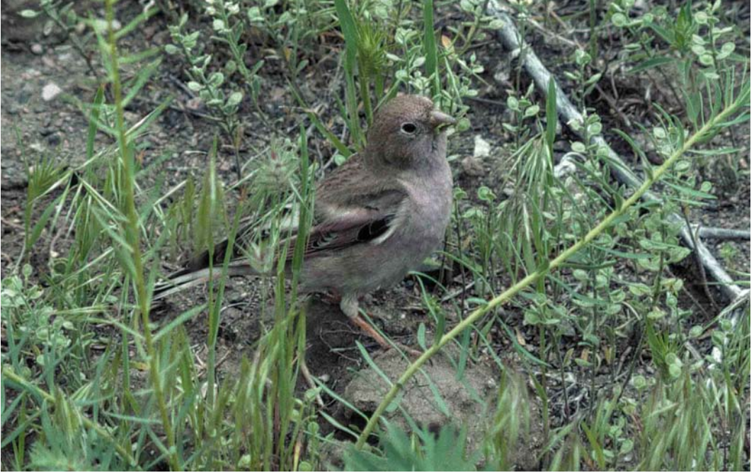
116 Mongolian Finch / Mongoolse Woestijnvink Bucanetes mongolicus , male, Ishak Pasa Sarayi, Turkey, 29 May 1994

mid-May, and Snow & Perrins (1998) report eggs in the second half of April and fledged young in mid-May in Azerbaijan. These latter data accord more strongly with Turkish observations although, given the occurrence of dependent young until mid-July and, based on MB's observation above, even late August, it is possible that the species has a remarkably protracted breeding season, or that more than one clutch is attempted. Climatic factors may plausibly influence the timing of breeding.