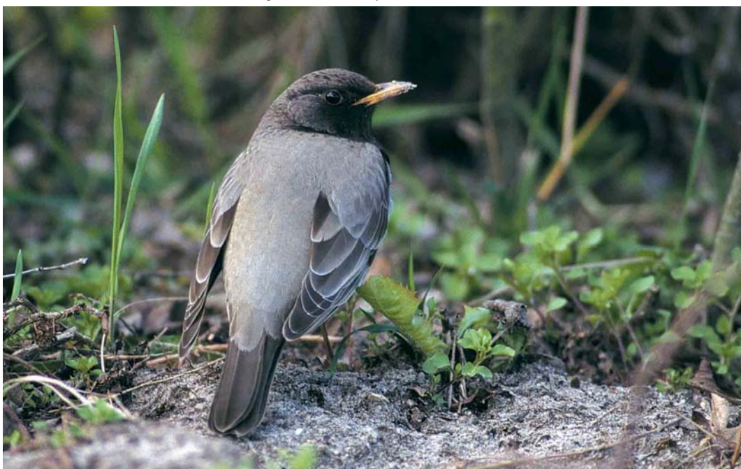
112 Zwartkeellijster / Black-throated Thrush Turdus ruficollis atrogularis , adult mannetje, West-Terschelling, Terschelling, Friesland, 12 april 1998