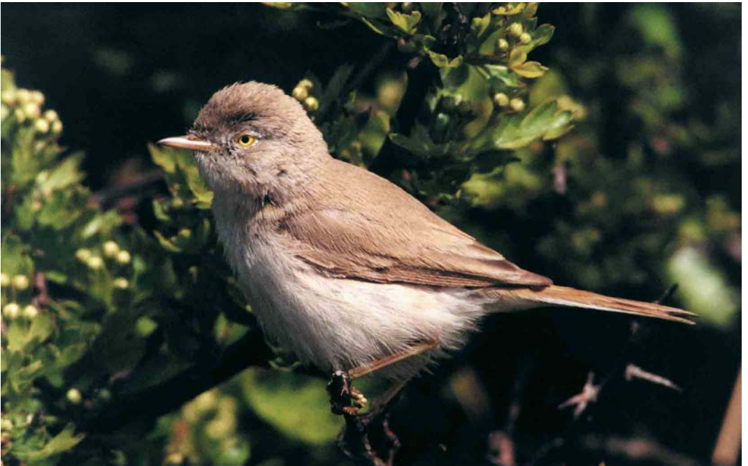
138 Asian Desert Warbler / Aziatische Woestijngrasmus Sylvia nana nana , Spurn, East Yorkshire, England, May 2000