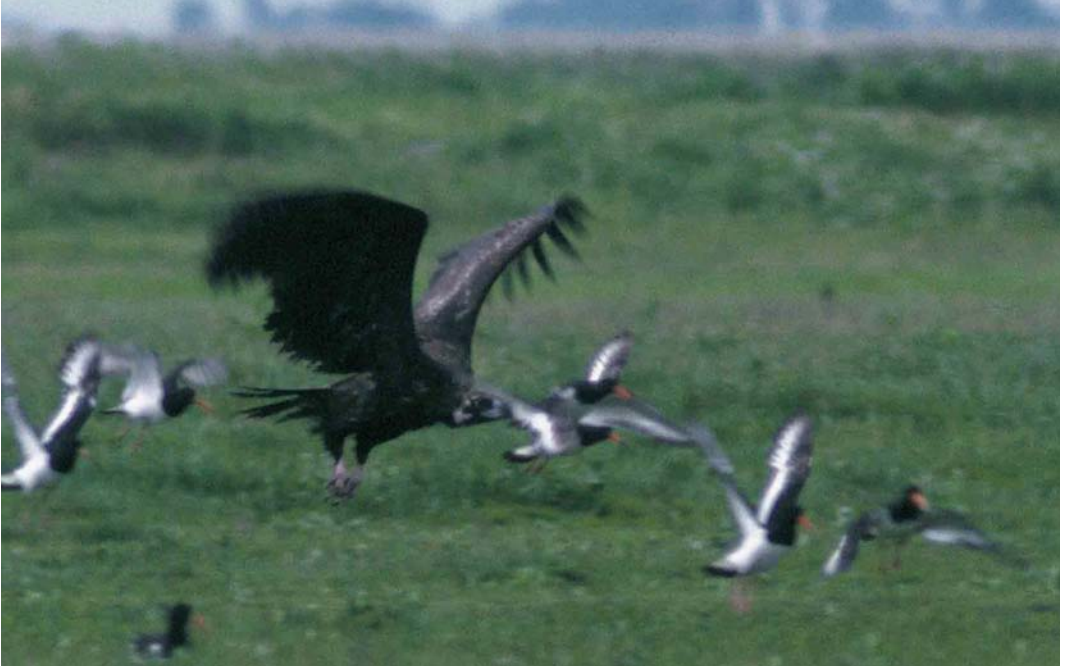
163 Monniksgier / Eurasian Black Vulture Aegypius monachus , onvolwassen, Bildtpollen, Ferwerderadiel, Friesland, 14 juli 2000

1948 werd geschoten in Beneden-Leeuwen, Gelderland. Over de herkomst van de Friese vogel is weinig te zeggen. Door het ontbreken van ringen of gebleekte pennen is het onwaarschijnlijk dat hij afkomstig is van een herintroductieproject zoals dat in de Cévennes, Frankrijk. Het is interessant dat Monniksgieren van Azië in tegenstelling tot die van Europa bekend staan om hun trek- en zwerfgedrag. In Handbuch der Vögel Mitteleuropas 4 (Glutz von Blotzheim et al 1971) wordt vermeld dat de soort vooral in april-september ten noorden van het broedgebied voorkomt: in Europa als dwaalgast (met in Noord-Europa slechts enkele aanvaarde gevallen) maar in de steppen van West-Siberië