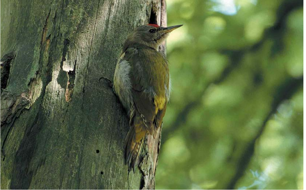
144 Grijskopspecht / Grey-headed Woodpecker Picus canus , mannetje, Oosterbeek, Gelderland, 31 mei 2000