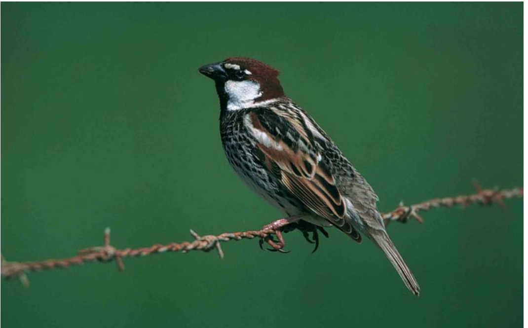
156 Spaanse Mus / Spanish Sparrow Passer hispaniolensis , adult mannetje, Camperduin, Noord-Holland, 13 mei 2000 (Jan van Holten)