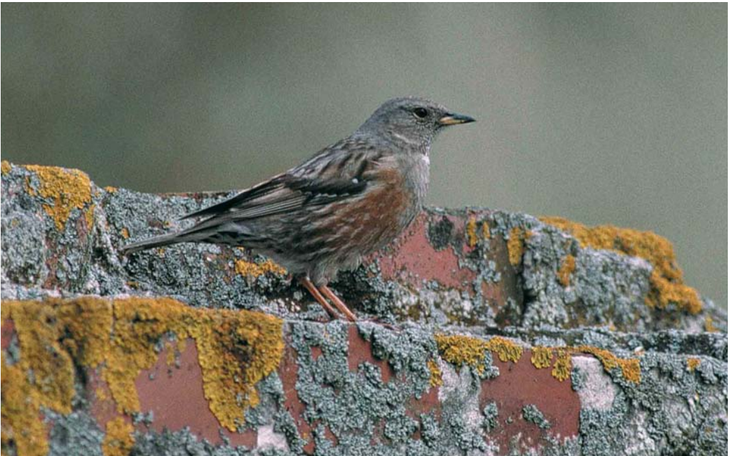
145 Alpenheggenmus / Alpine Accentor Prunella collaris , Formerum aan Zee, Terschelling, Friesland, 4 mei 2000