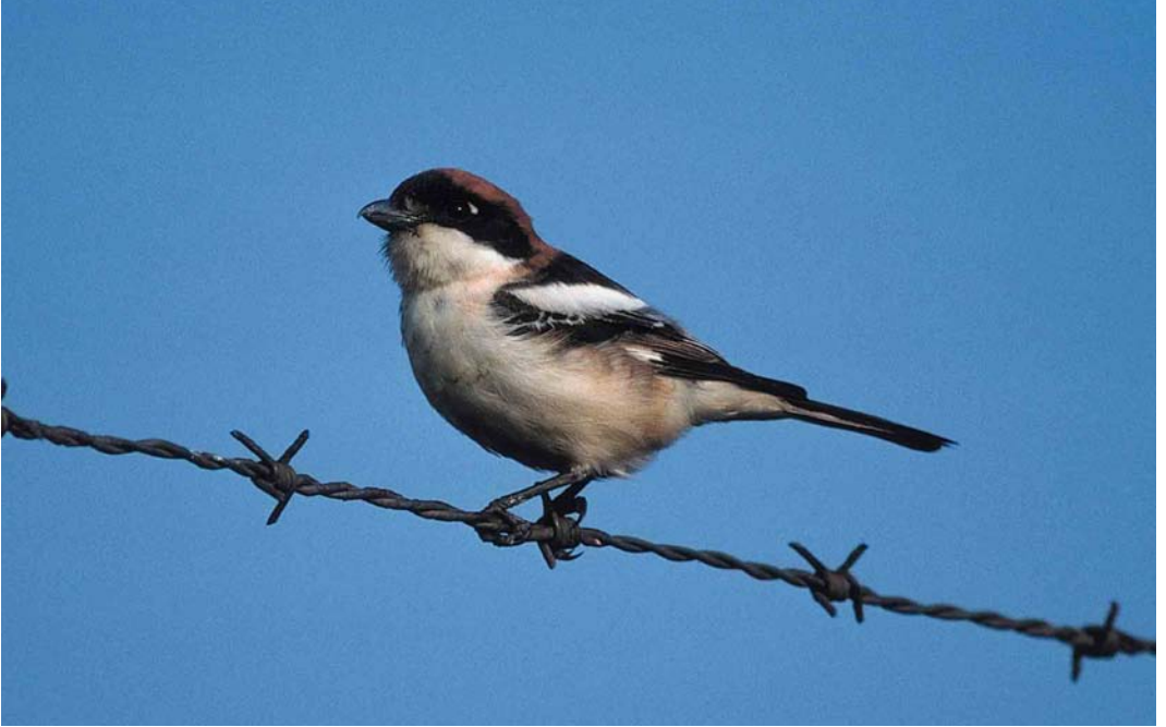
155 Roodkopklauwier / Woodchat Shrike Lanius senator , Maasvlakte, Zuid-Holland, 14 mei 2000 (Marten van Dijk)