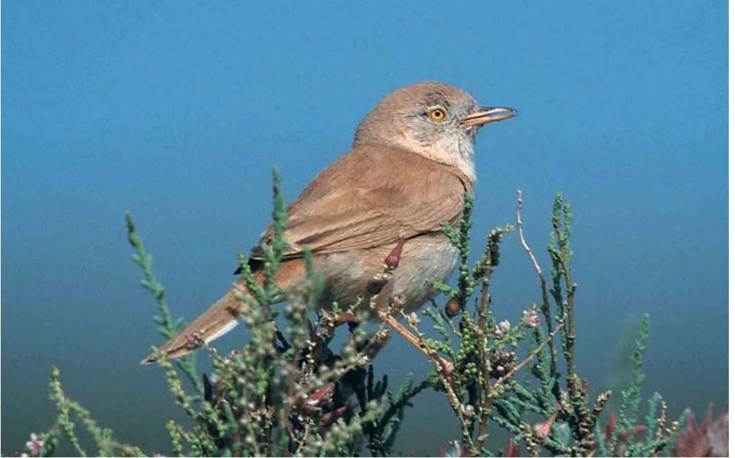
137 African Desert Warbler / Afrikaanse Woestijngrasmus Sylvia nana deserti , Merzouga, Morocco, 20 April 2000 (Markus Roemhild)