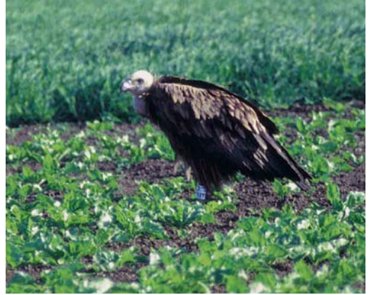
110 Vale Gier / Eurasian Griffon Vulture Gyps fulvus , tweedejaars, Wissenkerke, Zeeland, 3 juni 1999

GROOTTE & BOUW Zeer grote roofvogel, spanwijdte c 2.50 m; spanwijdte onder meer geschat door directe vergelijking met attaquerende Kokmeeuwen en Kleine Mantelmeeuwen L. graellsii . In vlucht lange, zeer brede en sterke gevingerde vleugels, weinig uitstekende kop en korte afgeronde staart. Achterrand van armvleugel gebogen. In cirkelvlucht vleugels in ondiepe V, met hand iets naar voren gehouden.