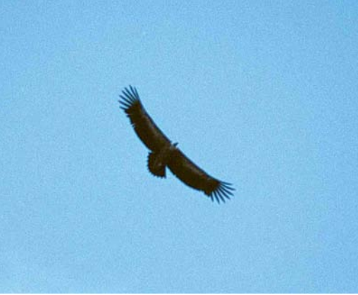
109 Vale Gier / Eurasian Griffon Vulture Gyps fulvus , tweedejaars, Goes, Zeeland, 1 juni 1999