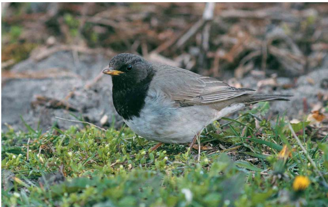
111 Zwartkeellijster / Black-throated Thrush Turdus ruficollis atrogularis , adult mannetje, West-Terschelling, Terschelling, Friesland, 13 april 1998 (Ruud E Brouwer)