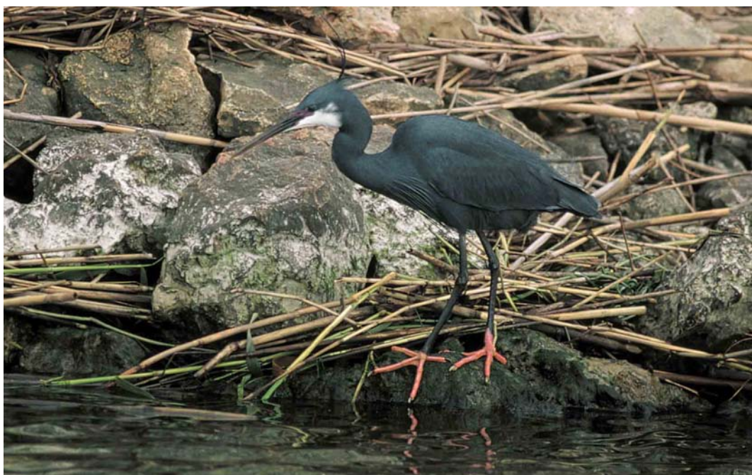
128 Western Reef Egret / Westelijke Rifeiger Egretta gularis , Ebro delta, Spain, 19 May 2000 (Mariano Cebolla Borrell)