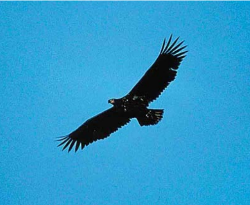
124 White-tailed Eagle / Zeearend Haliaeetus albicilla , juvenile, Praamweg, Flevoland, Netherlands, February 1998