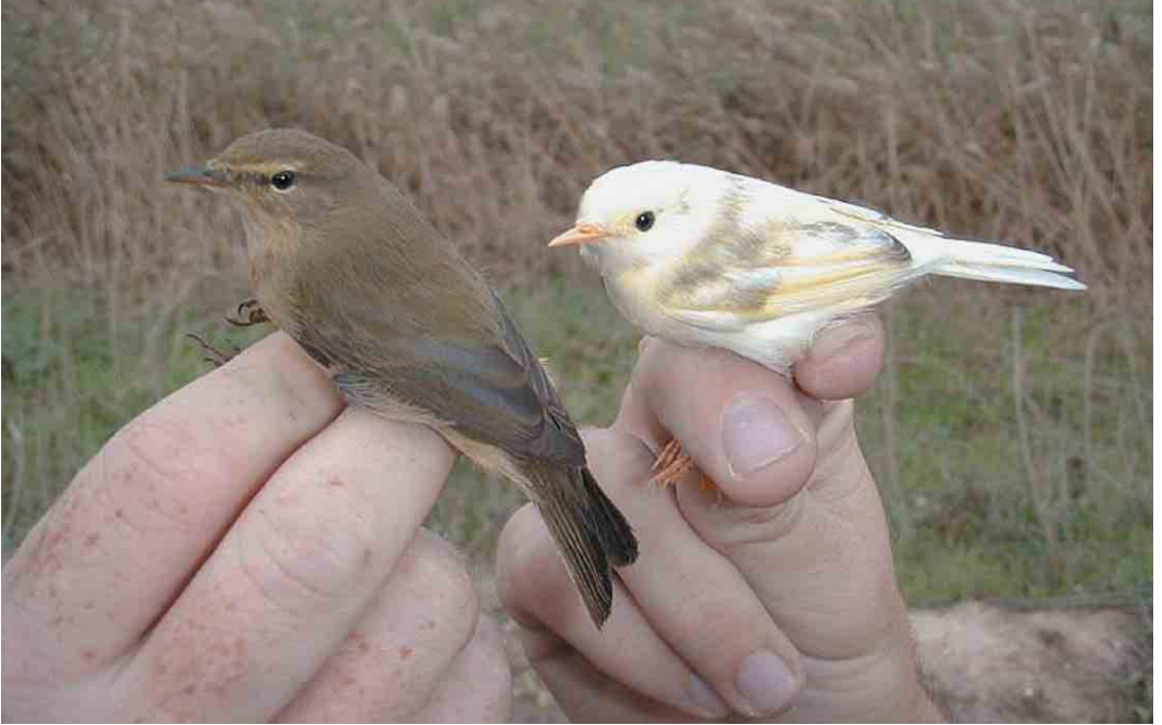
114 Leucistic Northern Chiffchaff / leucistische Tjiftjaf Phylloscopus collybita with normal Northern Chiffchaff, Remolar-Filipines reserve, Llobregat delta, Barcelona, Spain, 2 November 1999 ( Ricard Gutiérrez )