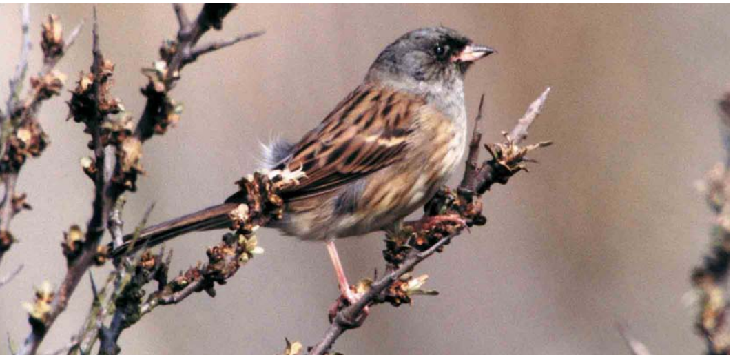
139 Royal Tern / Koningsstern Sterna maxima , Agadir, Morocco, 1 April 2000 140 Eurasian Griffon Vulture / Vale Gier Gyps fulvus , Korppoo, Finland, 3 May 2000 141 Redhead / Amerikaanse Tafeleend Aythya americana , male, with Common Pochard / Tafeleend A. ferina , female, Rieselfelder, Münster, Germany, 21 April 2000 142 Pied-billed Grebe / Dikbekfuut Podilymbus podiceps , Vistula river, Gdąnsk-Pleniewo, Poland, April 2000 143 Black-faced Bunting / Maskergors Emberiza spodocephala , male, Spurn, East Yorkshire, England, May 2000