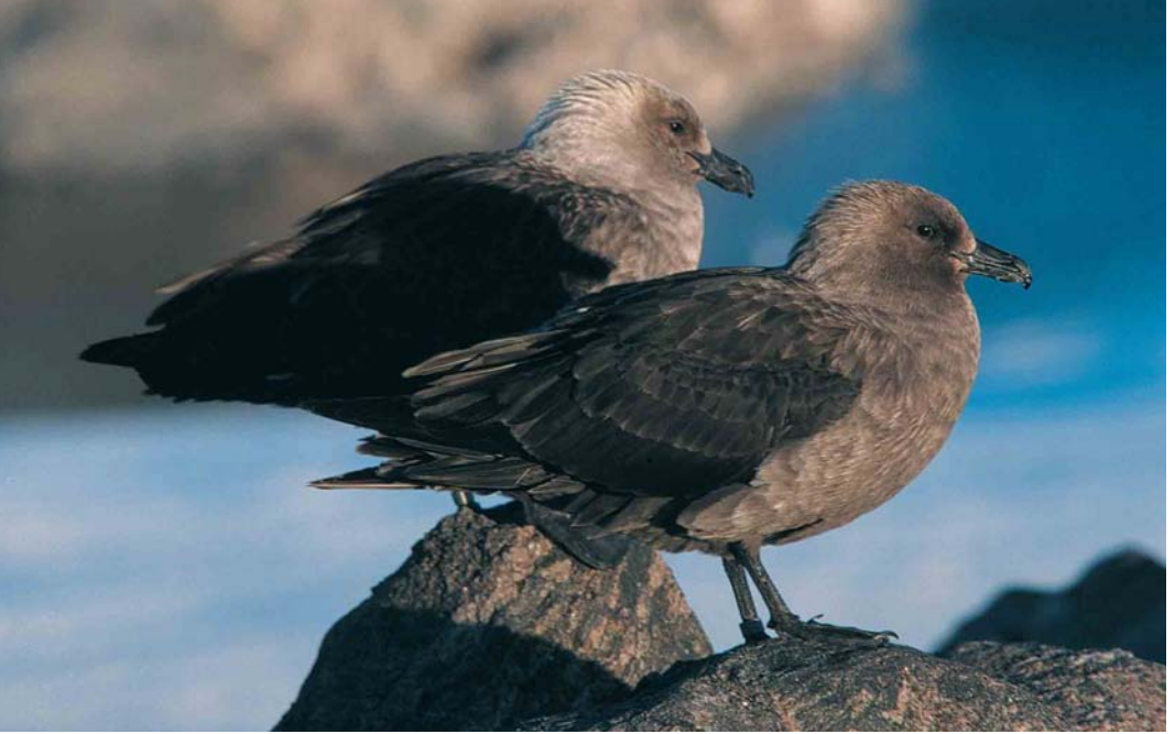
118 South Polar Skuas / Zuidpooljagers Stercorarius maccormicki , Adelie Land, Antarctica, January 1998 ( Christophe Barbraud ). Note large and huge bill of female in background and slimmer and smaller bill of male in foreground