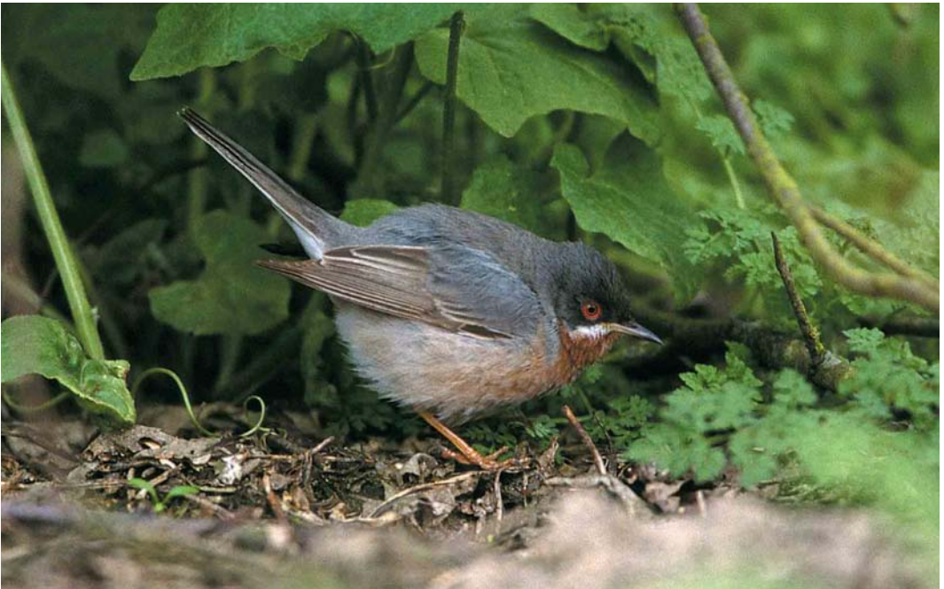
161 Baardgrasmus / Subalpine Warbler Sylvia cantillans , mannetje, Maasvlakte, Zuid-Holland, 30 april 2000 (Jan van Holten)

19 tot 22 mei bij Metslawier, Friesland, werd te laat doorgegeven om gecontroleerd te kunnen worden. De Cetti's Zanger Cettia cetti bleef aanwezig aan het Oostvoornse Meer, Zuid-Holland, tot ten minste 28 juni. Drie Graszangers Cisticola juncidis werden vanaf 7 mei gezien en gehoord bij Kruispolderhaven, Zeeland. Van 8 mei tot 1 juni zong er één in De Zoom ten noordwesten van Roggel, Limburg (de eerste voor deze provincie), vanaf 24 mei één bij de Hellegatsplaten en op 29 mei één bij Ovezande, Zeeland. Een Krekelzanger Locustella fluviatilis zong van 2 tot 15 juni aan de Australiëhavenweg in het Westelijk Havengebied van Amsterdam, Noord-Holland. Na kort blijvende Orpheusspotvogels Hippolais polyglotta op 8 mei bij Huizen, op 9 mei in het Westduinpark bij Den Haag en op 20 mei bij Budel-Dorplein volgden in juni exemplaren vanaf 8 juni bij Epen (die van 14 tot 18 juni gezelschap kreeg van een tweede, enkele kilometers verderop), begin juni bij Roosendaal, Noord-Brabant, op 12 juni bij Vijlen, Limburg, op 21 juni bij Maastricht en vanaf 29 juni in de omgeving van Heibloem, Limburg. Op 7 mei werd zowel op Vlieland als op Terschelling een mannetje Baardgrasmus Sylvia cantillans gevonden. Zingende Bergfluiters Phylloscopus bonelli werden gezien op 1 mei in De Dorst bij Rijen, Noord-Brabant, en van 14 tot 22 mei in het Harderbos, Flevoland. Er was tevens een melding op 3 mei op landgoed Duno bij Doorwerth, Gelderland. Een onvolwassen mannetje Kleine Vliegenvanger Ficedula parva