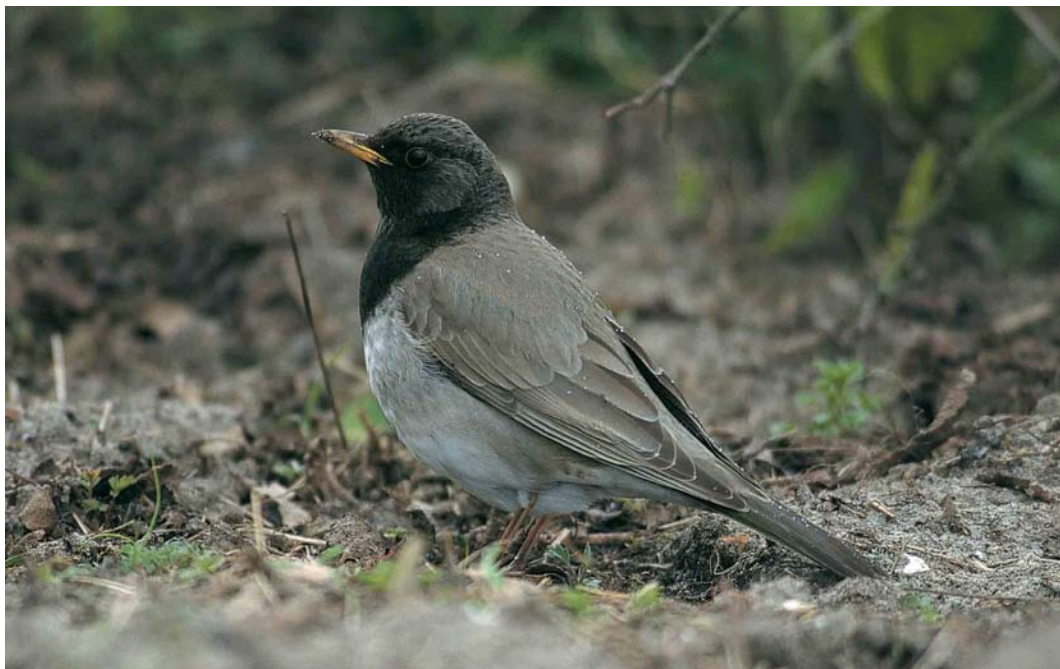
113 Zwartkeellijster / Black-throated Thrush Turdus ruficollis atrogularis , adult mannetje, West-Terschelling, Terschelling, Friesland, 13 april 1998 (Arie Ouwerkerk)

gevallen in België houdt mogelijk verband met het feit dat de voorjaarsvangst van lijsters reeds in 1875 werd afgeschaft (Gunter De Smet in litt).