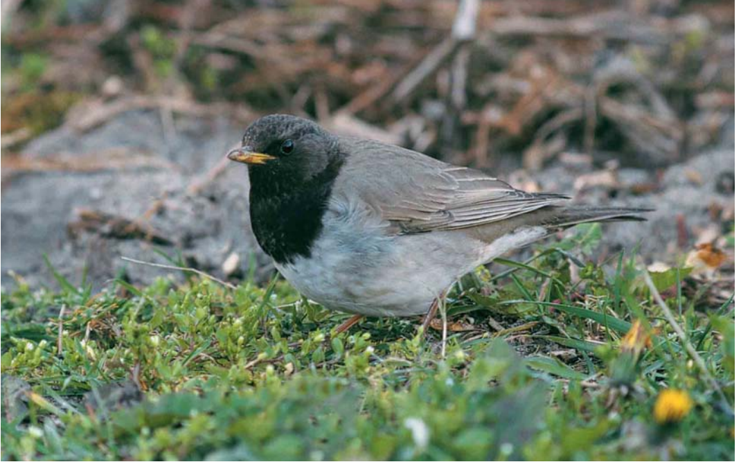
111 Zwartkeellijster / Black-throated Thrush Turdus ruficollis atrogularis , adult mannetje, West-Terschelling, Terschelling, Friesland, 13 april 1998