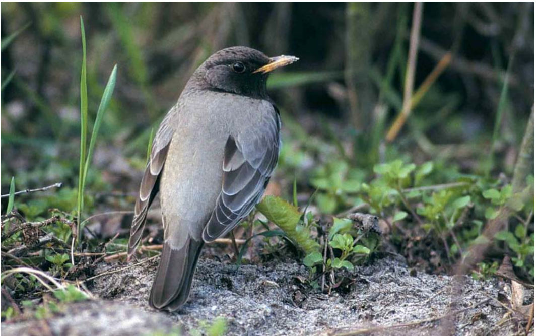
112 Zwartkeellijster / Black-throated Thrush Turdus ruficollis atrogularis , adult mannetje, West-Terschelling, Terschelling, Friesland, 12 april 1998