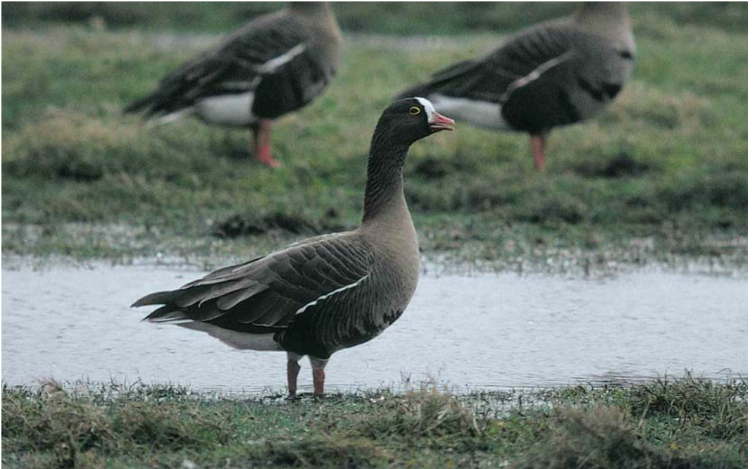
50 Dwerggans / Lesser White-fronted Goose Anser erythropus , Oude Land van Strijen, Zuid-Holland, 9 februari 2000 (Marten van Dijl)