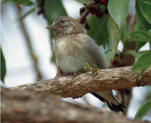
36 European Goldfinch / Putter Carduelis carduelis, juvenile, Luz, Algarve, Portugal, 16 July 1999