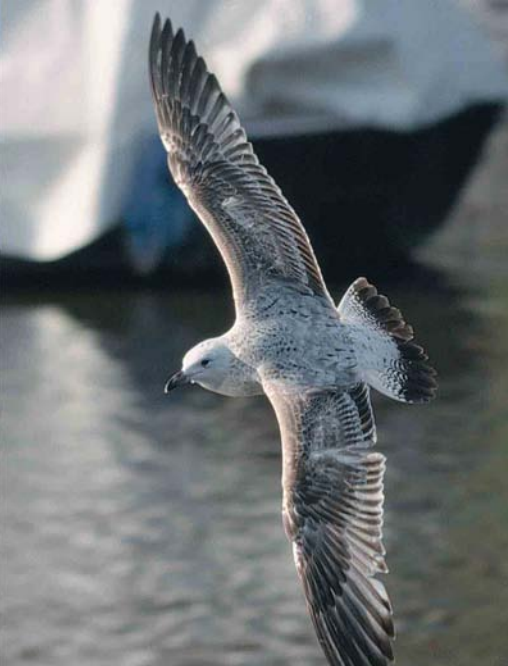
42 Pontic Gull / Pontische Meeuw Larus cachinnans , first-winter, Amsterdam, Noord-Holland, Netherlands, 25 February 2000