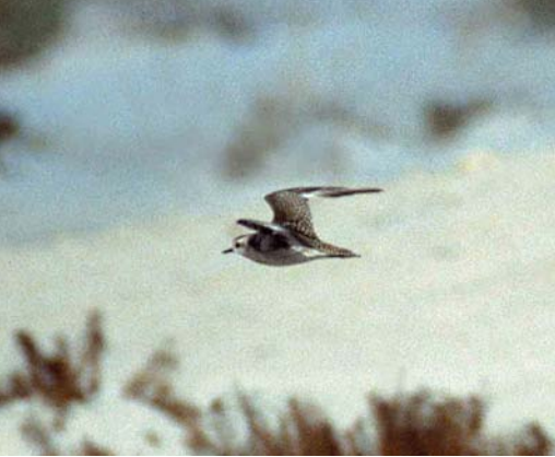
24 American Golden Plover / Amerikaanse Goudplevier Pluvialis dominicus , Abu Nawash Golf Course (Plage de Sidi Mahrès), Djerba, Tunisia, 24 December 1998