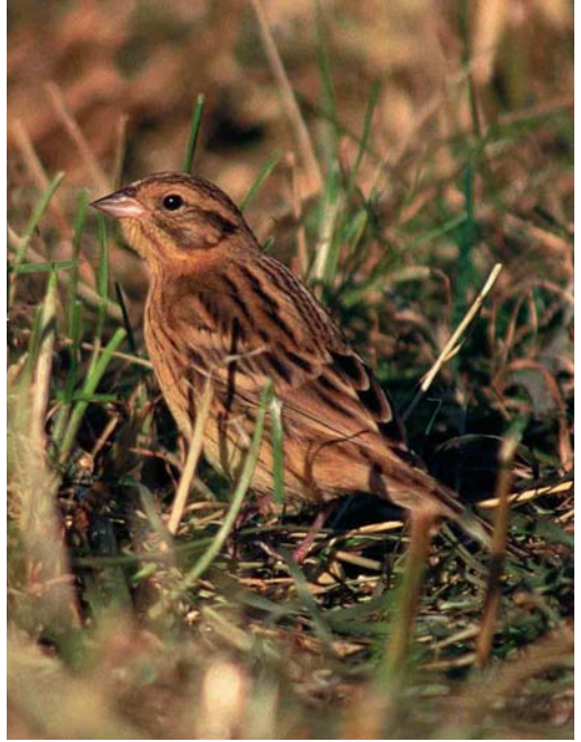
6 Pallas's Grasshopper Warbler / Siberische Sprinkhaanzanger Locustella certhiola , Fair Isle, Shetland, Scotland, September 1997 (Roger Riddington) 7 Yellow-breasted Bunting / Wilgengors Emberiza aureola , Fair Isle, Shetland, Scotland, September 1987 (Tim Loseby) 8 Pechora Pipit / Petsjorapieper Anthus gustavi , Fair Isle, Shetland, Scotland, September 1997 (Tim Loseby)