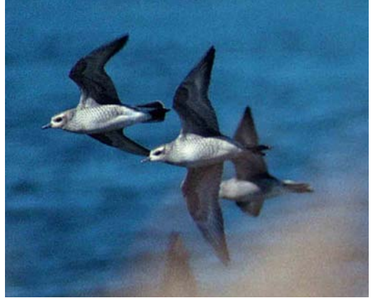
25 American Golden Plovers / Amerikaanse Goudplevieren Pluvialis dominicus , Newfoundland, Canada, 22 September 1991 (Bruce Mactavish)

After receiving the processed slides, PM quickly checked if the bird was indeed a 'lesser golden plover': it was. Comparison of his slides with the plates on page 354 in Beaman & Madge (1998) led him to the conclusion that it probably was a Pacific Golden Plover, mainly based on the clearly protruding legs visible on a flight shot. The next day, the slides were sent to the editors of Dutch Birding who selected a slide of the standing bird for inclusion in WP reports (Dutch Birding 21: 55, plate 45, 1999).