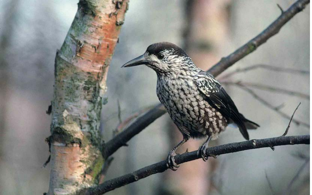
56 Notenkraker / Spotted Nutcracker Nucifraga caryocatactes , Terschelling, Friesland, 2 december 1999 (Arie Ouwerkerk)