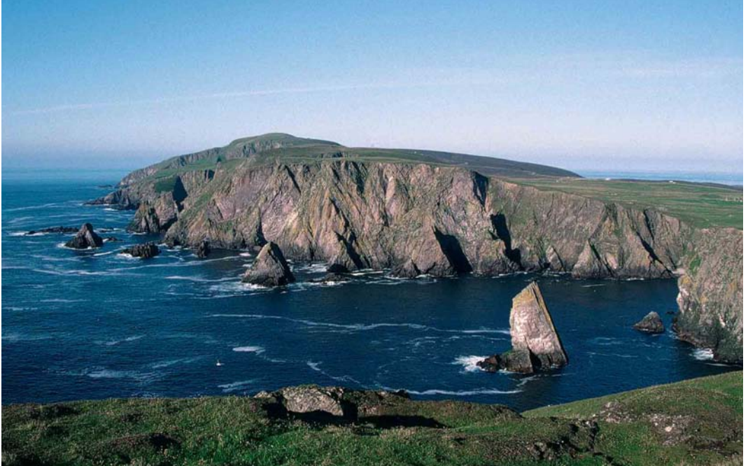
1 West coast of Fair Isle, Shetland, Scotland, September 1996

basin. Cyclonic weather to the west, with low cloud and drizzle over the British side of the North Sea, will encourage birds to fly lower and use islands and headlands to rest and refuel. Under certain circumstances, other wind directions may be productive (warm southerlies can be rewarding in spring, similarly easterly or north-easterly winds in autumn); but really the winds to pray for are south-easterlies.