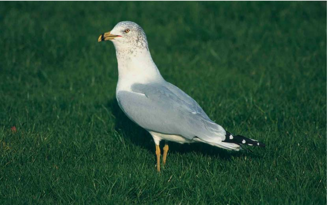
55 Ringsnavelmeeuw / Ring-billed Gull Larus delawarensis , adult, Goes, Zeeland, 21 november 1999 (Peter van Rij)