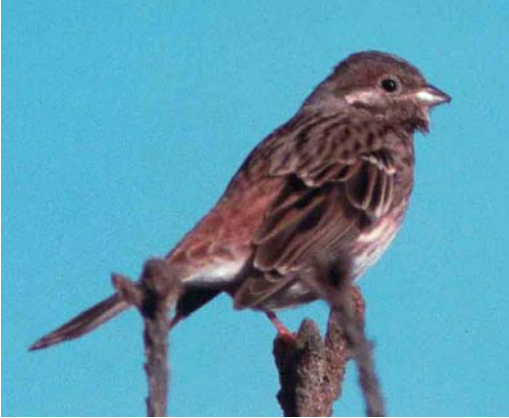
46 Pine Bunting / Witkopgors Emberiza leucocephalos , male, Principina a marc, Parco dell' Uccellina, Toscana, Italy, November 1999