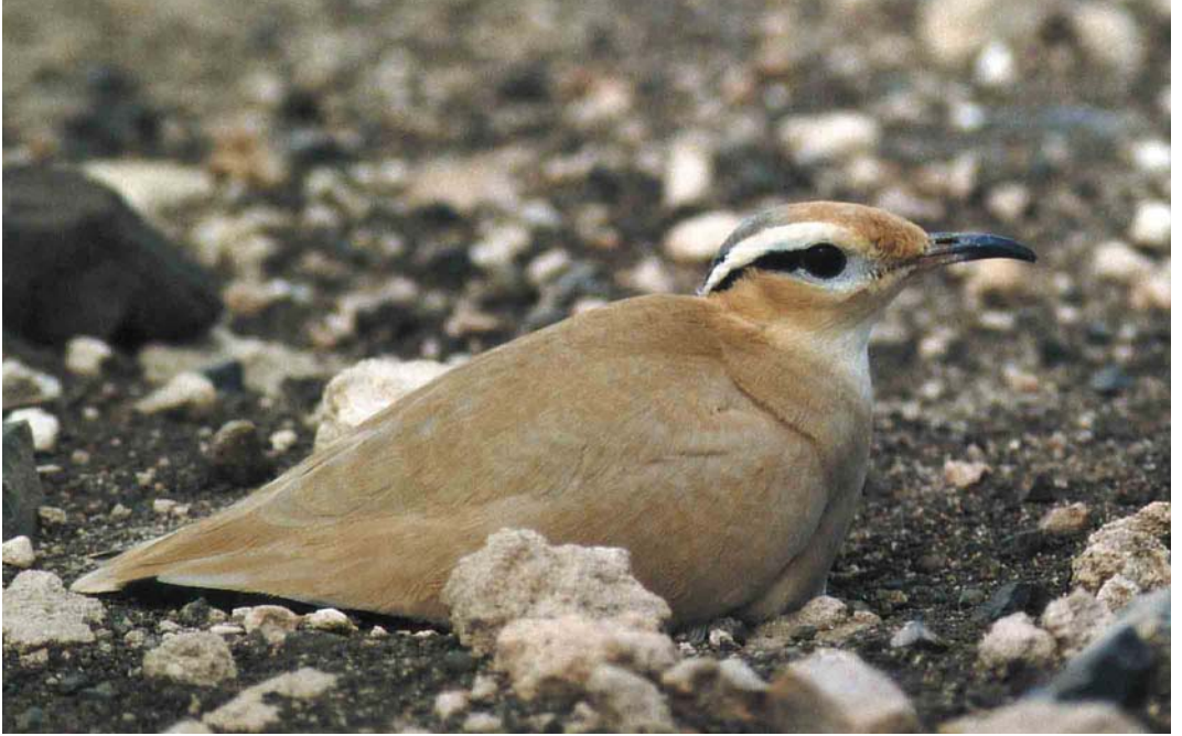
19 Cream-coloured Courser / Renvogel Cursorius cursor at nest, Sal, Cape Verde Islands, 26 February 1997