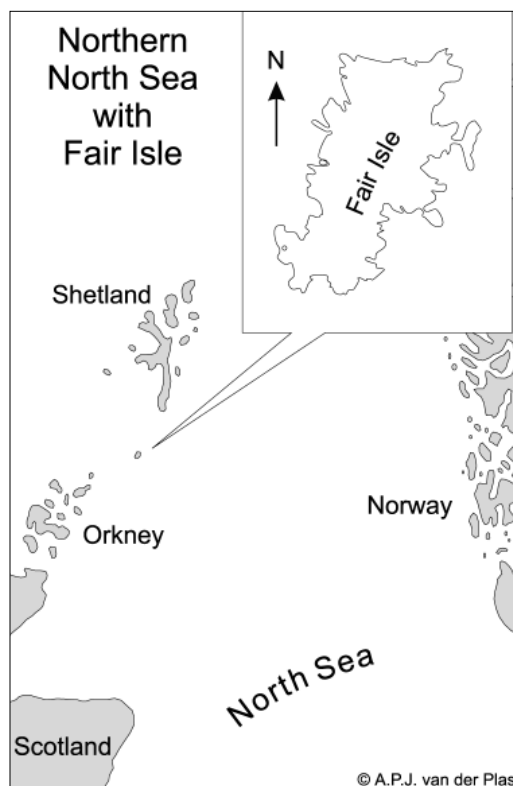
FIGURE 1 Geographical position of Fair Isle

The reason why Fair Isle is so good for migrants is a combination of many factors. Its geographical location and isolation make it ideally situated for regular migrant arrivals. Its small size and lack of cover mean that a relatively large proportion of the birds arriving there will be discovered, this being reinforced by the number of observers at peak times. As with all migrant hotspots however, weather conditions are crucial. The magic wind direction is south-east, although 'local' south-easterlies, blowing off the top of a westerly depression are not much use. In simple terms, classic weather for the Fair Isle involves a large, stable anticyclone over Scandinavia and the Eurasian landmass, producing south-easterlies right across the North Sea