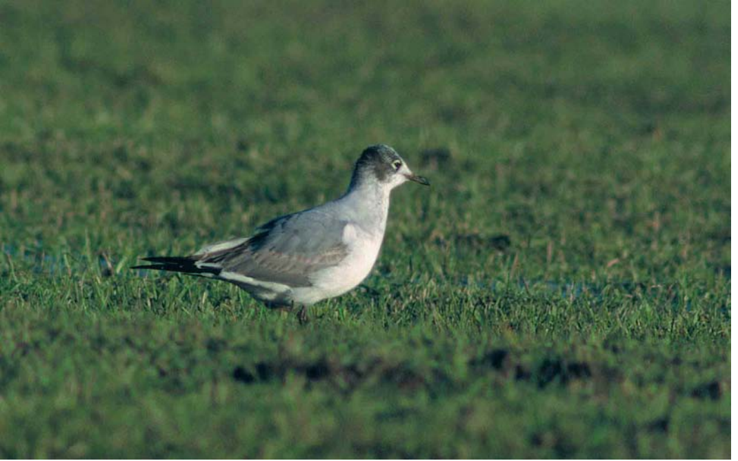
54 Franklins Meeuw / Franklin's Gull Larus pipixcan , eerste-winter, Kampen, Overijssel, 20 februari 2000 (Arnoud B van den Berg)