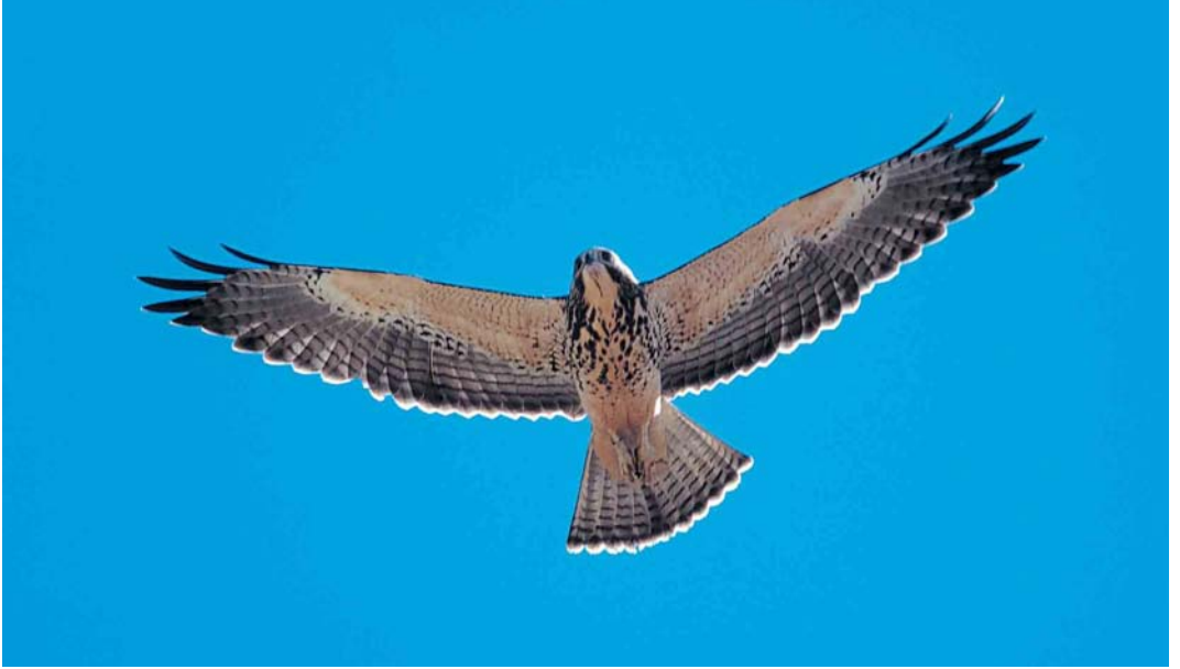
29 Swainson's Hawk / Prairiebuzierd Buteo swainsoni , juvenile, Antelope Valley, California, USA, 10 August 1997 ( Ned Harris ). Dark flight-feathers (somewhat paler than in adults) contrast with pale underwing-coverts. Underparts typically boldly marked. Note also diffuse dark trailing edge to wings and tail typical of juvenile 30 Swainson's Hawk / Prairiebuzierd Buteo swainsoni , adult dark morph, Davis, California, USA, 16 August 1997 ( Ned Harris ). Note difference in underside coloration between dark flight-feathers and paler tail-feathers with typical barring. Very pale vent and undertail-coverts contrast with dark remainder of underparts 31 Swainson's Hawk / Prairiebuzierd Buteo swainsoni , adult pale morph, Antelope Valley, California, USA, 5 July 1997 ( Ned Harris ). Typical individual with prominently two-toned underwings