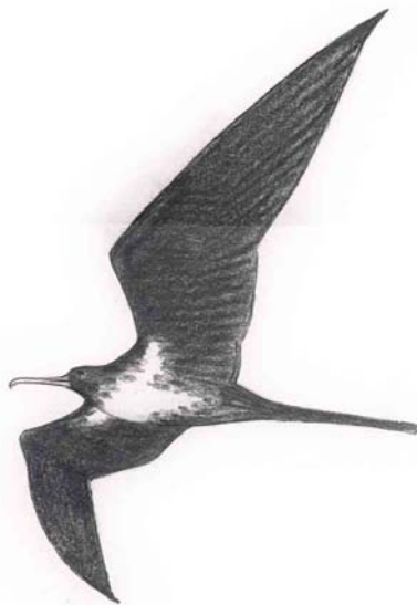
FIGURE 1 Lesser Frigatebird / Kleine Fregatvogel Fregata ariel , North Beach, Eilat, Israel, 6 May 1999

The next day, I went to the International Birdwatching Center at Eilat, where Henk Smit was involved in ringing birds. It appeared that he