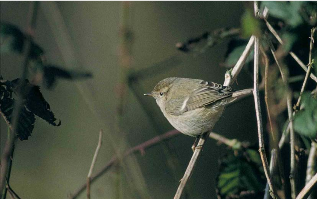
57 Humes Bladkoning / Hume's Leaf Warbler Phylloscopus humei , Jollema, Terschelling, Friesland, 15 januari 2000 (Arie Ouwerkerk)