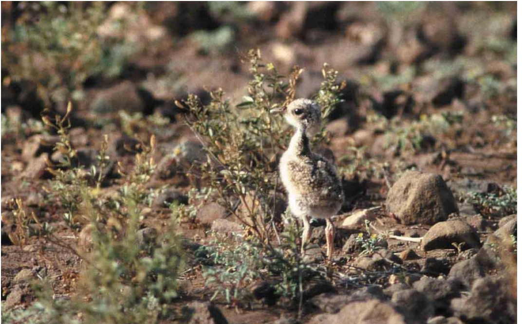
20 Cream-coloured Courser / Renvogel Cursorius cursor , downy young, Boavista, Cape Verde Islands, 1 November 1998