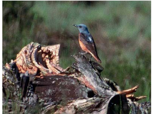
15 Rode Rotslijster / Rufous-tailed Rock Thrush Monticola saxatilis , mannetje, Hoge Veluwe, Gelderland, 17 mei 1998

De volgende beschrijving is gemaakt aan de hand van videobeelden van Marc Plomp (Plomp et al 1999), aantekeningen van Max Berlijn, AV en Wim Wiegant en foto's van Arnoud van den Berg en Jan van Holten (cf Birding World 11: 176, 1998, Dutch Birding 20: 132, plaat 93-94, 1998; van den Berg & Bosman 1999).