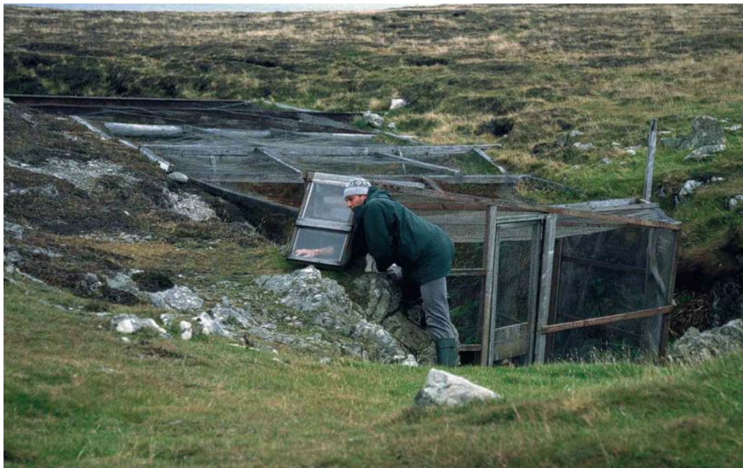
9 Retrieving a bird from the Gully trap, Fair Isle, Shetland, Scotland, October 1994 ( Andy Johnson )