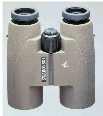
Swarovski SLC 10x42 WB binoculars

Only subscribers to Dutch Birding are eligible to enter. Excluded from entry are the editors and members of the editorial board of Dutch Birding and the members of the board of the Dutch Birding Association. Photographers whose work is used in the competition (both as mystery birds or as photographs accompanying the solutions)