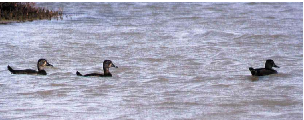
37 Booted Eagle / Dwergarend Hieraetus pennatus , Somerset, England, February 2000 ( Iain H Leach ) 38 Ross's Gull / Ross' Meeuw Rhodostethia rosea , adult, Skagen, Nordjylland, Denmark, 13 February 2000 ( Vincent Legrand ) 39 Laughing Gull / Lachmeeuw Larus atricilla , Blanes, Girona, Spain, 10 March 1999 ( Cristian Jensen Marcet ) 40 Black Duck / Amerikaanse Zwarte Eend Anas rubripes , Stithians Reservoir, Cornwall, November 1999 ( Steve Young/Birdwatch ) 41 Ring-necked Ducks / Ringsnaveleenden Aythya collaris , Sal, Cape Verde Islands, 16 November 1999 ( Manfred Koch )