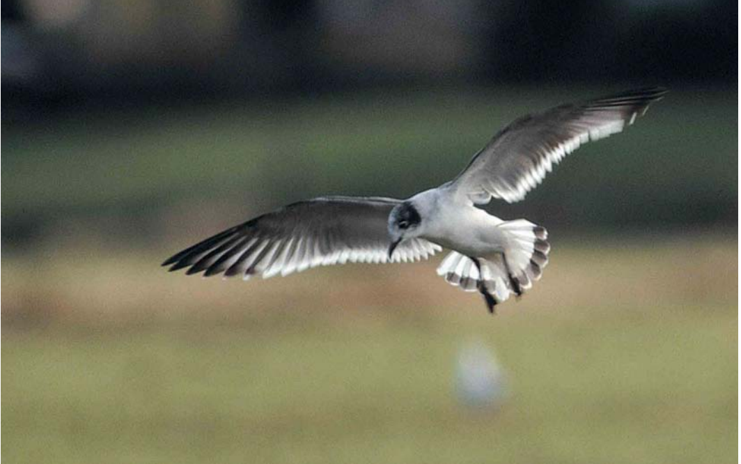
62 Franklins Meeuw / Franklin's Gull Larus pipixcan , eerste-winter, Kampen, Overijssel, 20 februari 2000

Deze waarnemingen betekenden de tweede Franklins Meeuw voor België en de derde voor Nederland, na eerdere gevallen van 13 juni tot 11 juli 1987 aan weerszijden van de Belgisch-Nederlandse grens bij Nieuwmoer en Wuustwezel, Antwerpen, België, en Achtmaal-Wernhout, Noord-Brabant, Nederland, en op 10 juni 1988 bij Brandemeer, Friesland (doodgevonden). Op basis van vergelijking van het fotomateriaal lijkt het zeer waarschijnlijk dat het in 2000 wederom om een 'gedeelde' waarneming van hetzelfde exemplaar ging. NICO GEIREGAT & DOLF STOMPHORST