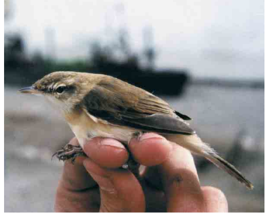
47 Paddyfield Warbler / Veldrietzanger Acrocephalus agricola , first-winter, L'Encanyissada, Ebro delta, Tarragona, Spain, 12 December 1999 (Cristian Jensen Marcet)