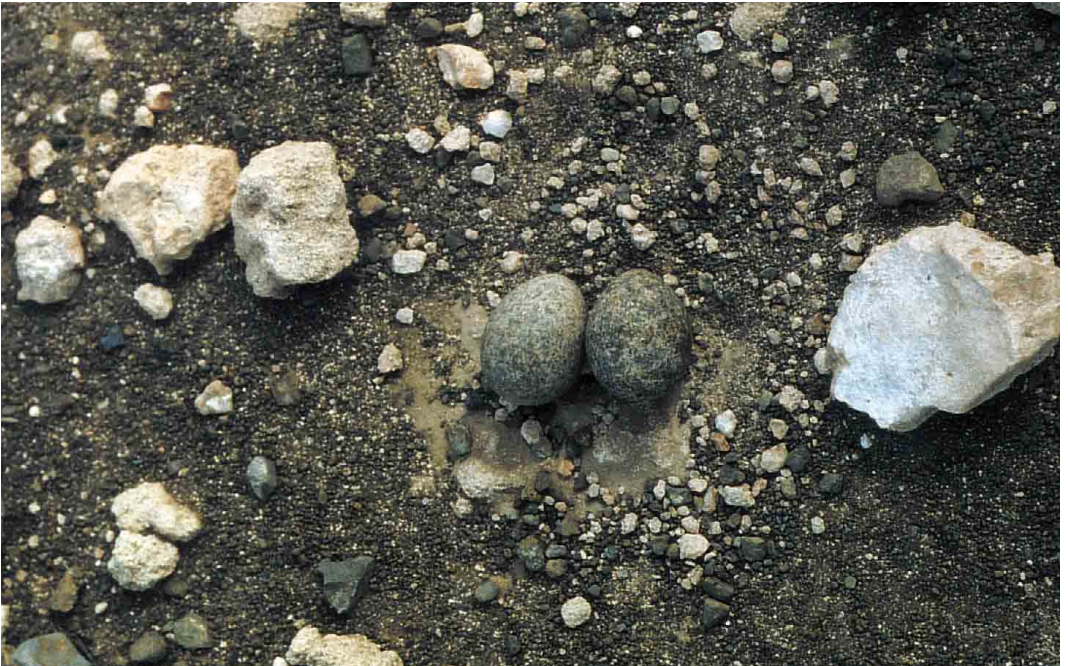
18 Nest of Cream-coloured Courser / Renvogel Cursorius cursor , Sal, Cape Verde Islands, 25 February 1997 (Manfred Koch)