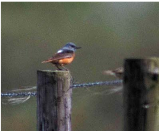
16 Rode Rotslijster / Rufous-tailed Rock Thrush Monticola saxatilis , mannetje, Lauwersmeer, Groningen, 4 mei 1999

GROOTTE & BOUW Middelgrote zangvogel, met lange, rechte en vrij spitse snavel en relatief korte staart. Vleugelpunt net niet tot staartpunt reikend KOP & HALS Geheel lichtblauw.