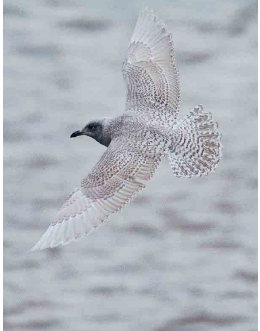
43 Iceland Gull / Kleine Burgemeester Larus glaucooides , first-winter, Whitby, North Yorkshire, England, January 2000

Yellowlegs T flavipes for Portugal was a juvenile moulting to first-winter in the Sado estuary on 28 November 1999. The first Brown Skua Catharacta lonnbergi for the UAE was seen at Sandy Beach on 8 January.