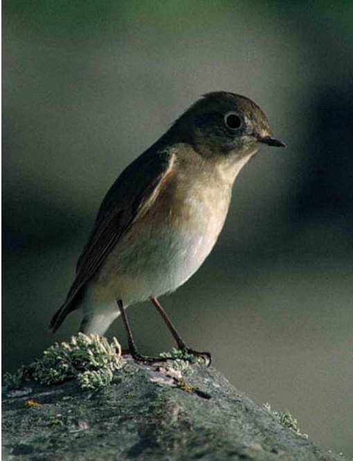
13 Red-flanked Bluetail / Blauwstaart Tarsiger cyanurus , Fair Isle, Shetland, Scotland, September 1993 (Dennis Coultts)