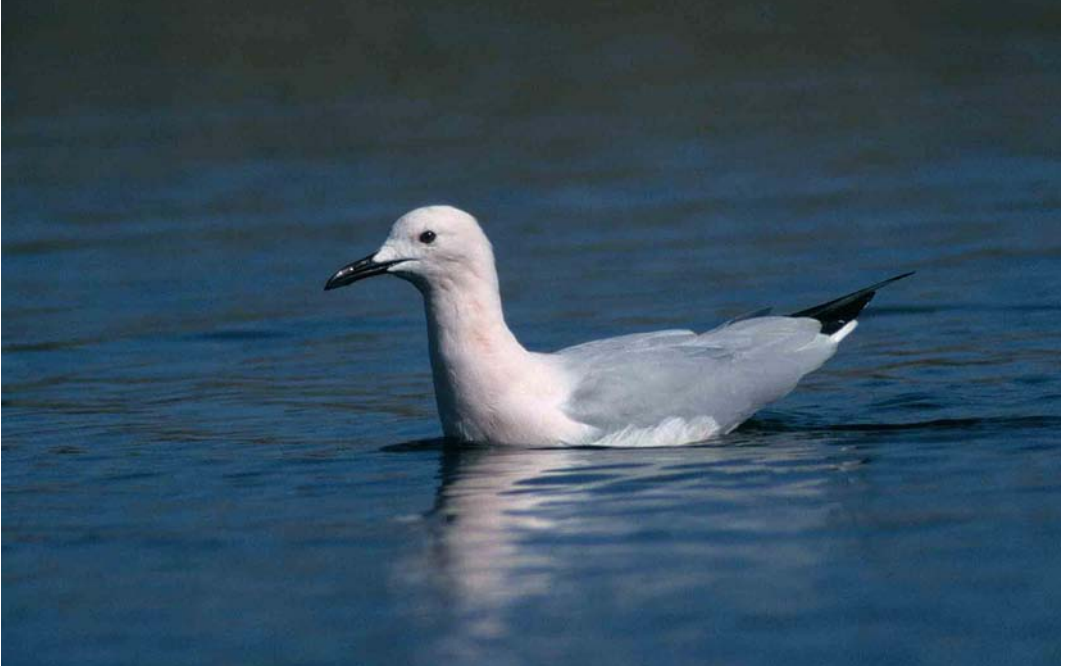
44 Slender-billed Gull / Dunbekmeeuw Larus genei , adult, Castro Marim NR Algarve, Portugal, February 2000