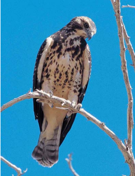
35 Swainson's Hawk / Prairiebuzerd Buteo swainsoni , juvenile, Antelope Valley, California, USA, 25 July 1998. Note pale supercilium, streaked rather than barred underparts and more diffusely demarcated dark sub-terminal band on tail-feathers, all typical of juvenile

of the flight-feathers and the somewhat paler underside of the tail. The pattern of underparts and underwing-coverts can show some superficial resemblance, but Swainson's Hawk can be rather easily separated in all plumages from Booted Eagle by the lack of a pale hind-neck and upperwing-bars, lack of pale spots at the leading edge of the wing, lack of paler inner primaries and a different, more pointed wing-shape.