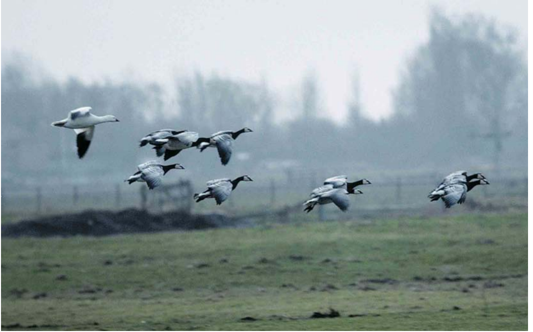
49 Ross' Gans / Ross's Goose Anser rossii , adult, met Brandganzen / Barnacle Geese Branta leucopsis , Oude Land van Strijen, Zuid-Holland, 9 februari 2000