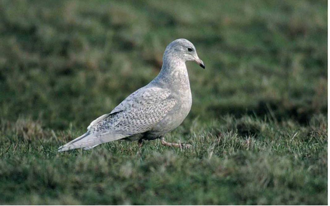
52 Kleine Burgemeester / Iceland Gull Larus glaucoides , eerste-winter, Formerum, Terschelling, Friesland, 7 januari 2000