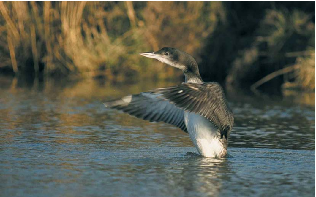
51 Ijsduiker / Great Northern Loon Gavia immer , Tuitjenhorn, Noord-Holland, 10 december 1999

aangetroffen bij Heel, Limburg. Later werd bekend dat deze vogel bij tijden al vanaf september 1998 in deze omgeving aanwezig was. In totaal werden 15 Kuifaalscholers Stictocarbo aristotelis waargenomen, voornamelijk in december en januari, met adulte van 12 tot 25 december bij Den Oever, van 27 december tot 17 februari in de Eemshaven, Groningen, bij het Kornwerderzand, Friesland (op 25 december dood gevonden), op 2 januari bij de Oosterscheldekering, en op 1 februari in Den Helder. Maximaal vier waaronder twee adulte werden gezien bij IJmuiden, Noord-Holland. Maximaal drie overwinterende Kwakken Nycticorax nycticorax werden tot in februari gezien bij Veere, Zeeland. Andere waren er op 5 december (maar naar het schijnt al lange tijd aanwezig) bij Hazerswoude, Zuid-Holland, en van 5 tot 18 januari bij Deventer, Overijssel. Koereigers Bubulcus ibis verbleven tot 5 december bij Nieuw-Lekkerland, Zuid-Holland, tot 4 december, van 4 tot 23 januari én op 27 februari bij Strijen, en op 25 februari bij Ulrum, Groningen. Met uitzondering van exemplaren van 11 januari tot 10 februari bij Hoofddorp, Noord-Holland, en twee op 12 februari bij Den Helder, werden alle Kleine Zilverreigers Egretta garzetta (15-20) gezien in de Delta, Zeeland/Zuid-Holland. In deze periode werden ook nog eens 45 Grote Zilverreigers Casmerodius albus gemeld, met als groepjes op 1 december drie vliegend langs de Oostvaardersdijk, op 2 december vier in de Ezumakeeg, Friesland, op 30 december vijf