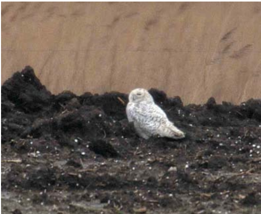
63 Sneeuwuil / Snowy Owl Nyctea scandiaca , Oostvaardersplassen, Flevoland, 11 maart 2000

SNOWY OWLS A Snowy Owl Nyctea scandiaca near Amerongen, Utrecht, the Netherlands, on 17-19 February 2000 turned out to be an escape from a nearby collection; after capture, it was returned to the owner. From 8 to at least 19 March 2000, a presumably wild bird was seen at Oostvaardersplassen, Flevoland. This record coincides with the large invasion in northern Europe in the winter of 1999/2000.