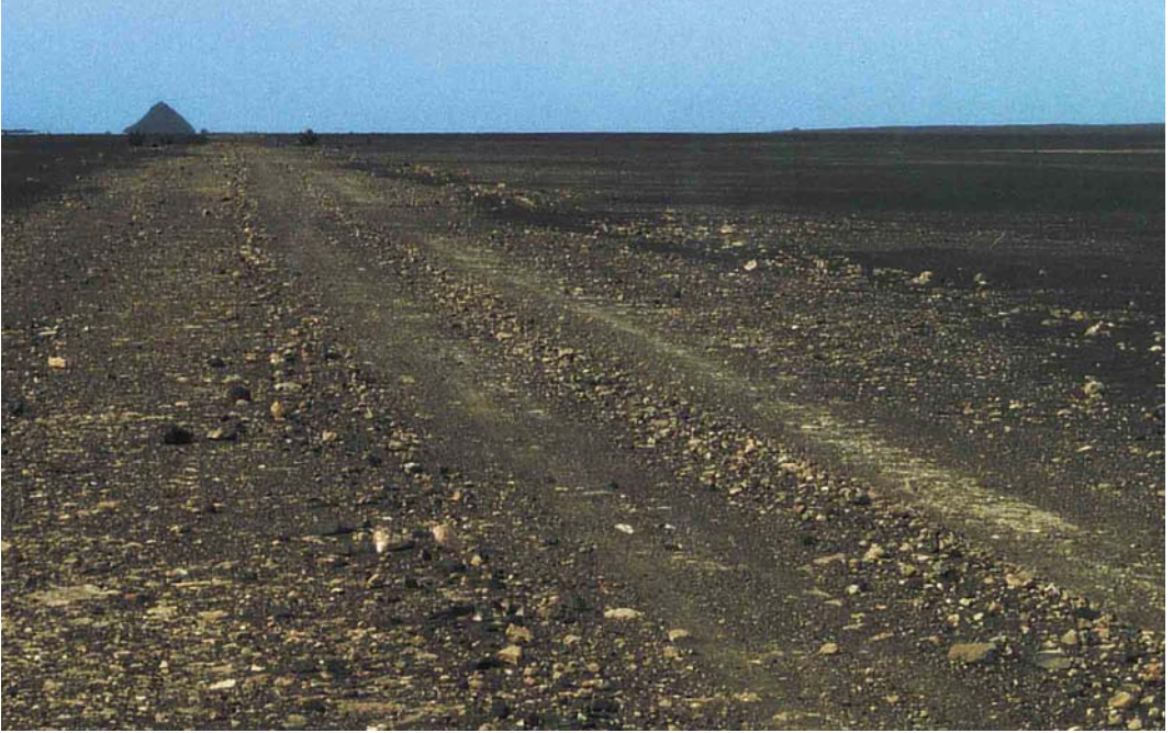
17 Nesting site (nest in centre of track) of Cream-coloured Courser / Renvogel Cursorius cursor , Sal, Cape Verde Islands, 25 February 1997 (Manfred Koch)