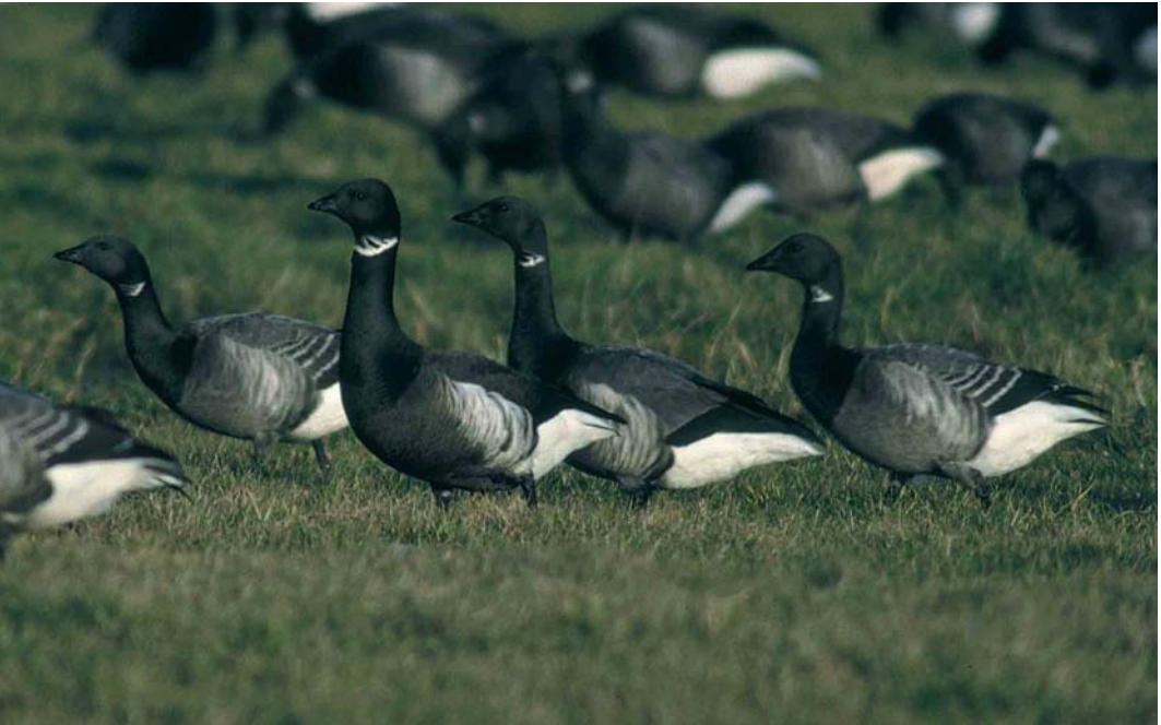
48 Zwarte Rotgans / Black Brant Branta nigricans met Rotganzen / Dark-bellied Brent Geese B bernicla , Landerum, Terschelling, Friesland, 9 januari 2000

daar op 6 januari wederom opgemerkt en tijdens een bootexcursie op 15 januari uiteindelijk door een flinke groep vogelaars nogmaals gezien. Dit betrof de derde waarneming voor Nederland. Op 18 december was er een melding van een langsvliegende Stellers Eider Polysticta stelleri over de Waddenzee ter hoogte van de Marnewaard in de Lauwersmeer, Groningen. Een mannetje Koningseider Somateria spectabilis werd weer eens gezien op 16 december bij Vlieland, Friesland. Het maximum aantal Ijseenden Clangula hyemalis bij de Brouwersdam, Zuid-Holland, bedroeg 30 op 22 januari, maar dit valt in het niet bij het aantal dat in februari in de westelijke Waddenzee werd geteld. Hoewel het bekend is dat hier grote aantallen in de winter verblijven, komen daar zelden getallen over naar buiten. Tussen 7 en 21 februari pleisterden hier c 400 exemplaren. Amerikaanse Smienten Mareca americana werden opgemerkt van 5 december tot 18 januari enkele keren tussen Amerongen, Utrecht, en Lienden, Gelderland, van 26 december tot 10 januari op de Reeuwijkse Plassen, Zuid-Holland, van 3 januari tot 26 februari in de omgeving van de Kapelsche Moer, Zeeland, op 29 januari op de IJssel tussen Welsum en Terwolde, Overijssel, van 9 februari tot in maart op de Ouderkerker Plas, Noord-Holland, en op 28 februari bij Onderdijk, Noord-Holland. De Amerikaanse Wintertaling Anas carolinensis van Texel bleef daar tot 3 december. Grote aantallen doortrekkende Roodkeel-