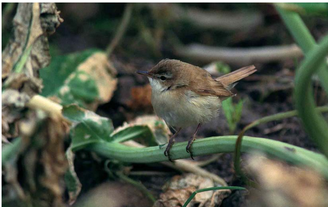
10 Paddyfield Warbler / Veldrietzanger Acrocephalus agricola , Fair Isle, Shetland, Scotland, September 1997 ( Tim Loseby )