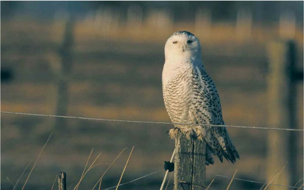
45 Snowy Owl / Sneeuwuil Nyctea scandiaca , Malmö, Skåne, Sweden, January 2000 (Felix Heintzenberg)