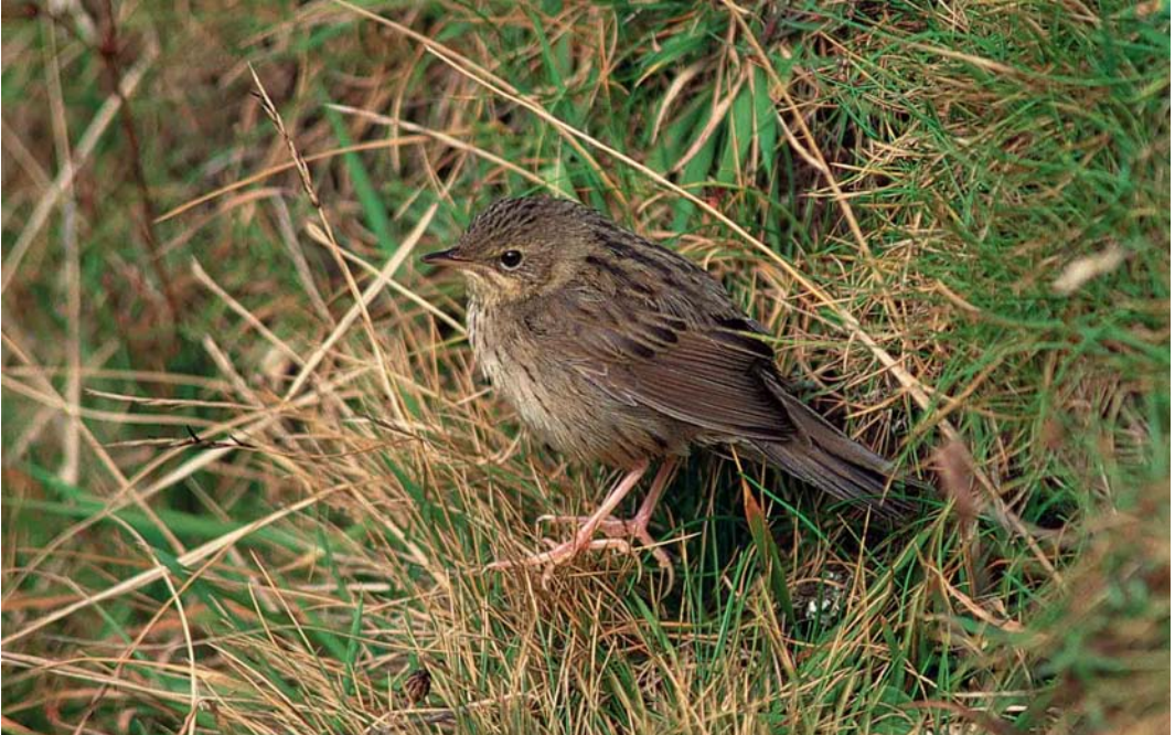
12 Lanceolated Warbler / Kleine Sprinkhaanzanger Locustella lanceolata , Fair Isle, Shetland, Scotland, September 1987

regular, but in recent years, there have always been at least one or two, and often more, during the course of the autumn. If these species are your goal, then I suggest that 10 days from c 20 September is perhaps statistically the best chance of a clean sweep. Great Snipe, Citrine Wagtail and Yellow-breasted Bunting are not unusual in late August/early September, whilst I have seen Pechora Pipit, Lanceolated Warbler and Pallas's Grasshopper Warbler in mid October. But the latter half of September is Fair Isle's zenith and, in addition to the above, the list of vagrants is long and mouth-watering. Both new to Britain were Pallas's Reed Bunting E pallasii (29 September to 11 October 1976; the second British record was also on Fair Isle, on 17-18 September 1981) and River Warbler L fluviatilis (24 September 1961). Other momentous late September finds have included the second British records of both Buff-bellied Pipit A rubescens (17 September 1953) and Savannah Sparrow Passerculus sandwichensis (30 September to 1 October 1987), as well as Red-flanked Bluetail Tarsiger cyanurus (three in the past 20 years), Upland Sandpiper Bartramia longicauda , Laughing Gull Larus atricilla , European Roller Coracias garrulus ,