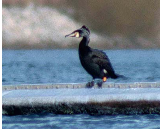
21 Grote Aalscholver / Atlantic Great Cormorant Phalacrocorax carbo carbo , mannetje (links / left) en Continentale Aalscholver / Continental Great Cormorant P c sinensis , Heel, Limburg, 4 februari 2000