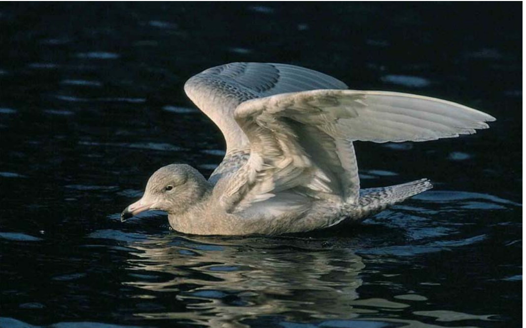
53 Grote Burgemeester / Glaucous Gull Larus hyperboreus , eerste-winter, Rotterdam, Zuid-Holland, 25 januari 2000